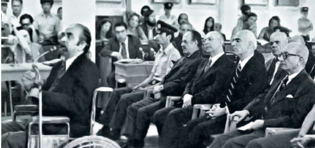
Η δίκη της Χούντας. Παπαδόπουλος, Μακαρέζος, Πατακός, Σπαντιδάκης στο εδώλιο ακούνε να καταθέτει ένας μάρτυρας κατηγορίας

νταγματικές πολυτέλειες της κοινοβουλευτικής δημοκρατίας. Έτσι, κάθε οργάνωση του κινήματος και της Αριστεράς απαγορεύεται, ο δημοκρατικός χώρος κάθε συλλογικής έκφρασης (συγκέντρωση, διαδήλωση, κλπ) κλείνει, οι ηγέτες των κάθε λογής αντιφρονούντων (ακόμα και των αστικών κομμάτων) συλλαμβάνονται και φυλακίζονται. Η χούντα απάντησε καταλυτικά στην πρόκληση που έθεσαν το 1965 στην κυρίαρχη τάξη το “πεζοδρόμιο” και το εργατικό κίνημα. Η αλματώδης ανάπτυξη του ελληνικού καπιταλισμού τα χρόνια της δικτατορίας δεν θα μπορούσε να πραγματοποιηθεί χωρίς την αιματηρή καταστολή της εργατικής τάξης και των οργανώσεών της, συνδικαλιστικών και πολιτικών.