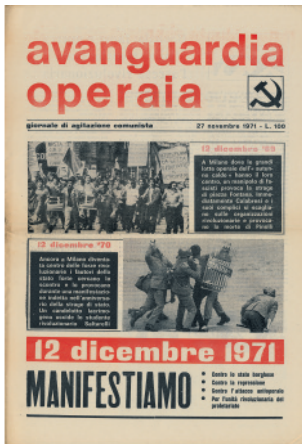
Πρωτοσέλιδο της εφημερίδας "Εργατική Προπορεία", οργάνωσης της ιταλικής επαναστατικής αριστεράς.

των ΗΠΑ που δίνει αυτές τις δυνατότητες στους τοπικούς υπο-ιμπεριαλισμούς. Οι αλλαγές στην παγκόσμια οικονομία έχουν οδηγήσει σε μεγαλύτερη διεθνοποίηση των επενδύσεων. Η κλειστή αυτόκεντρη ανάπτυξη που επικρατούσε μετά τον πόλεμο (έστω και με αμερικάνικη χρηματοδότηση), από τα τελευταία χρόνια της δεκαετίας του '60 έχει δώσει τη θέση της στις διεθνείς ροές κεφαλαίων. Στις τράπεζες της Δυτικής Ευρώπης οι καταθέσεις σε ξένο νόμισμα οχταπλασιάστηκαν από το 1968 ως το 1974. Η ελληνική άρχουσα τάξη, για παράδειγμα, κάθε άλλο παρά έχει κλείσει τα μάτια σε αυτή τη διαδικασία, και γι' αυτό, τα πιο δυναμικά της τμήματα προσανατολίζονται προς την Ευρωπαϊκή Οικονομική Κοινότητα από πολύ νωρίς.