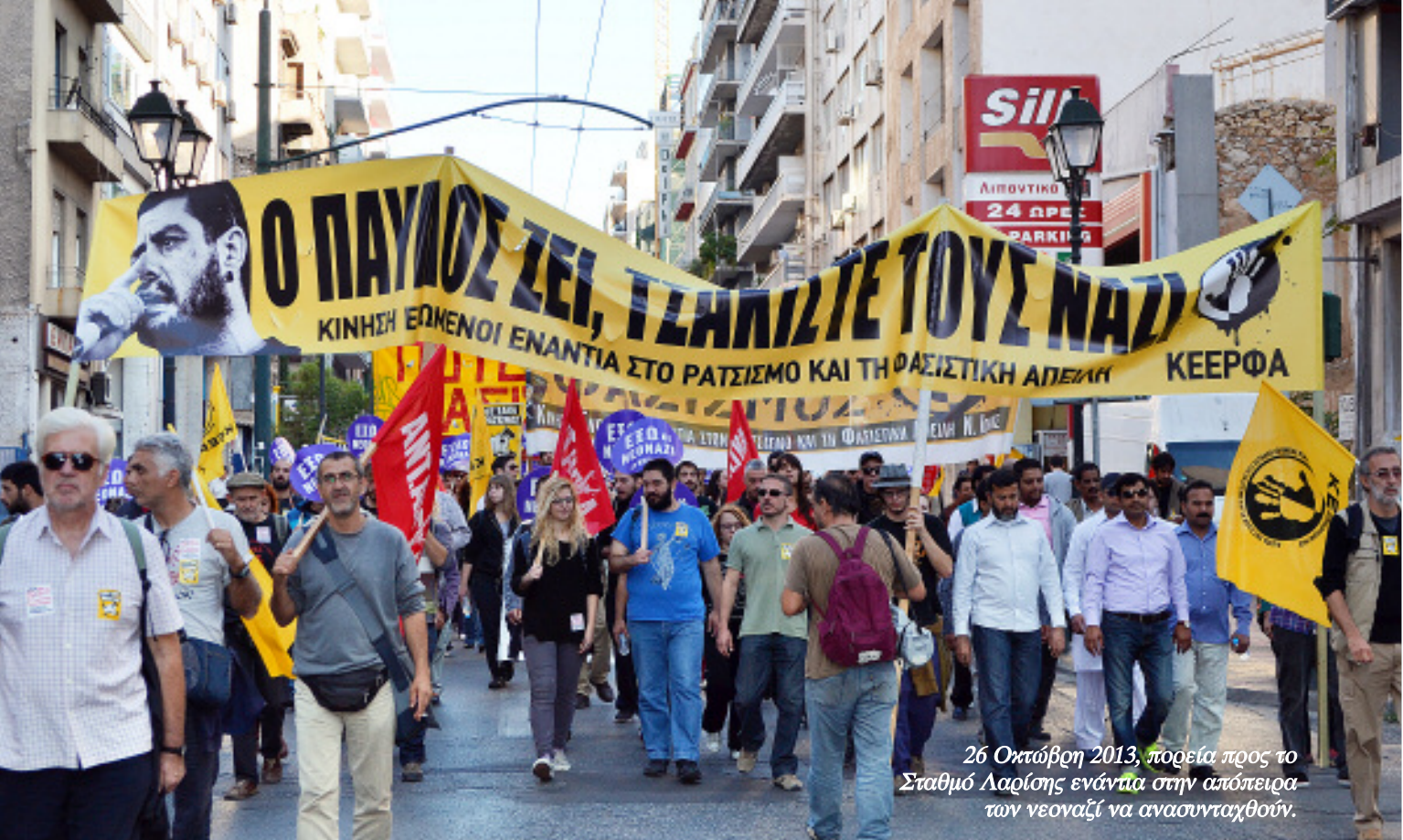
26 Οκτώβρη 2013, πορεία προς το Σταθμό Λαρίσης ενάντια στην απόπειρα των νεοναζί να ανασυνταχθούν.