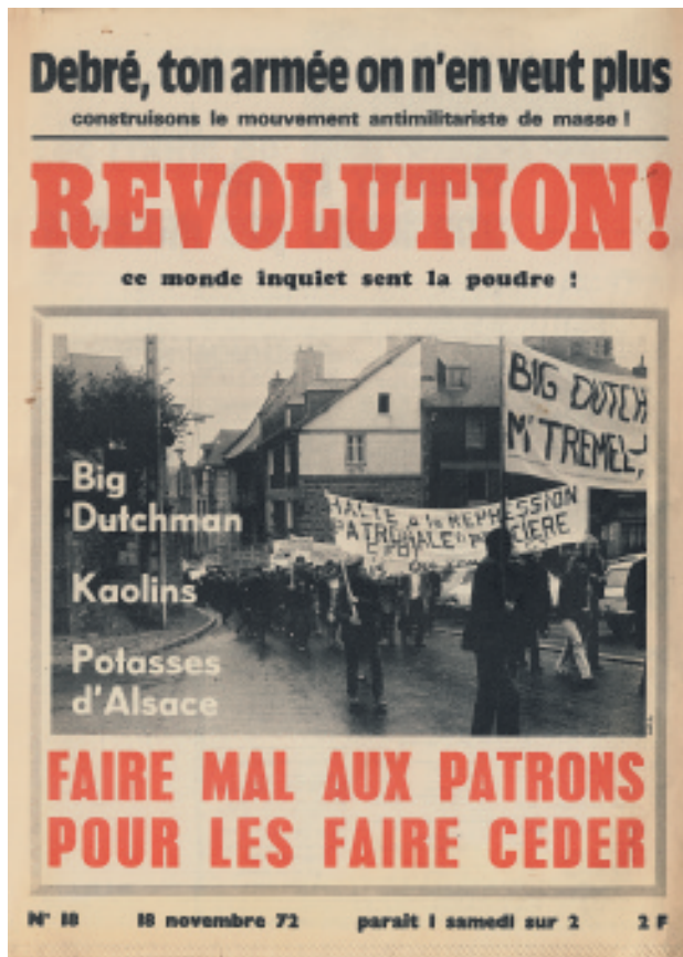
Πρωτοσέλιδο της “Revolution”, οργάνωση της επαναστατικής αριστεράς στη Γαλλία, που δημιουργήθηκε στις αρχές του '71.

Η Χούντα, όμως, άρχισε να γίνεται εμπόδιο για την άρχουσα τάξη από πολύ