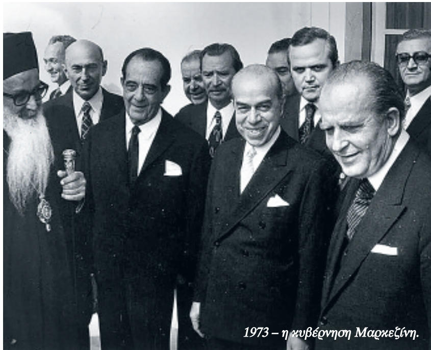
1973 - η κυβέρνηση Μαρκεζίνη.

Αυτές οι επιφανειακές διαφορές δεν εμπόδισαν και τα δυο κόμματα να διαμορφώσουν μια τακτική απέναντι στη