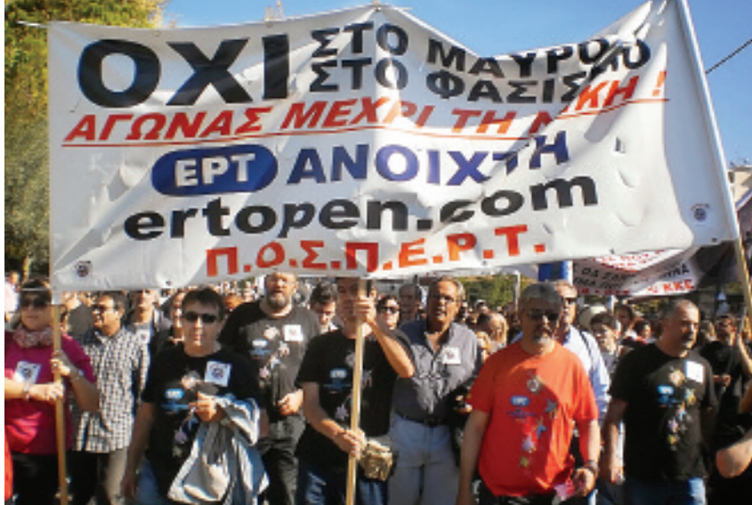
“Αγώνας μέχρι τη νίκη” - το μήνυμα της ΕΡΤ.

συνδικαλιστικής γραφειοκρατίας να δώσει ανάσα ζωής στην συγκυβέρνηση Σαμαρά-Βενιζέλου, κρατώντας απομονωμένη την απεργία των καθηγητών. Με την ελπίδα ότι με αυτόν τον τρόπο θα μπορούσαν ΠΑΣΚΕ-ΔΑΚΕ να την σταματήσουν από τα μέσα. Ομως αποδείχθηκε ότι ούτε αυτό ήταν αρκετό. Ο μόνος τρόπος για να σταματήσουν την απεργία ήταν ξανά τα γραφειοκρατικά τερτίπια που είχαν χρησιμοποιήσει και τον Μάιο. Τότε ήταν το ερώτημα αν έχουμε τους όρους και τις προϋποθέσεις για απεργία διαρκείας. Αυτήν τη φορά δεν προχώρησαν στην συνέχιση με πενήνήμερες, παρόλο που αυτή η πρόταση συγκέντρωσε το 65,7% των ψήφων των ΕΛΜΕ με την δικαιολογία ότι η πρόταση δεν ξεπέρασε το όριο του 66,6%!! Σε καμία άλλη ομοσπονδία δημόσιου ή ιδιωτικού τομέα δεν υπάρχει τέτοιο όριο για να βγει μια απεργία.