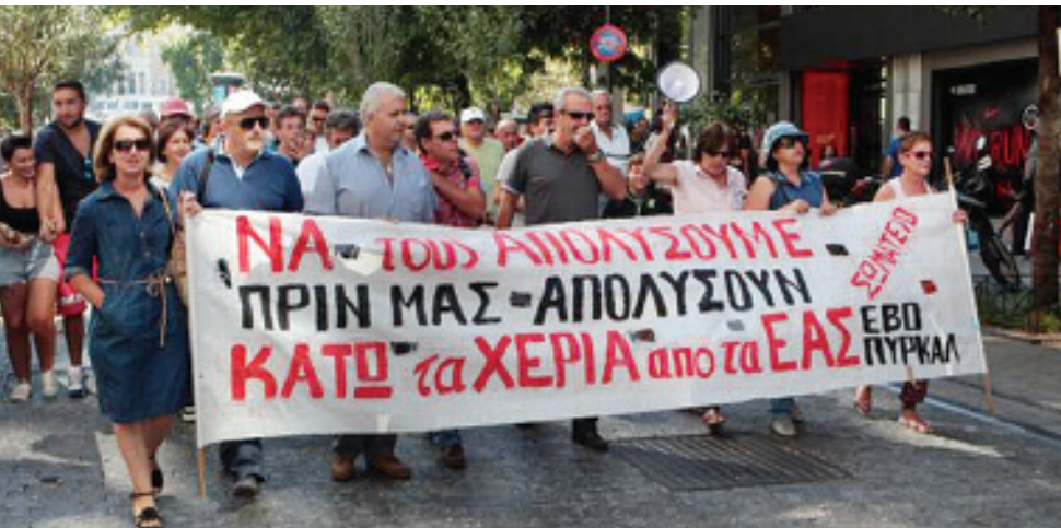
Το πανό των εργατών ΕΒΟ-ΠΥΡΚΑΛ τα λέει όλα.

ΔΗΝ και της ΟΕΝΓΕ να κινητοποιούνται. Στον ενάμιση χρόνο λειτουργίας του το συντονιστικό συσπειρώνει πρωτοβάθμια σωματεία, επιτροπές αγώνα και απλούς εργαζόμενους από σχεδόν είκοσι νοσοκομεία του λεκανοπέδιου. Μπήκε μπροστά να υπερασπίσει τα νοσοκομεία που ήθελε να κλείσει η τρόικα και η κυβέρνηση. Οργάνωσε και στηριξε την πανελλαδική κινητοποίηση επαγγελματιών νοσοκομείων, άνοιξε την συμπαράσταση με συναυλία και αφίσα μέσα στο καλοκαίρι για τα νοσοκομεία του λεκανοπέδιου που πήγαιναν για κλείσιμο. Προτείνει και οργάνωσε απεργιακά βήματα των εργαζόμενων στα νοσοκομεία μετά τον Αυγουστο, ενάντια στην αδράνεια των συνδικαλιστικών ηγεσιών, δίνοντας την μάχη για να μπουν τα νοσοκομεία στο μέτωπο των απεργιών διαρκείας του Σεπτεμβρίου. Αυτό το παράδειγμα χρειάζεται να το γενικεύσουμε την επόμενη περίοδο.