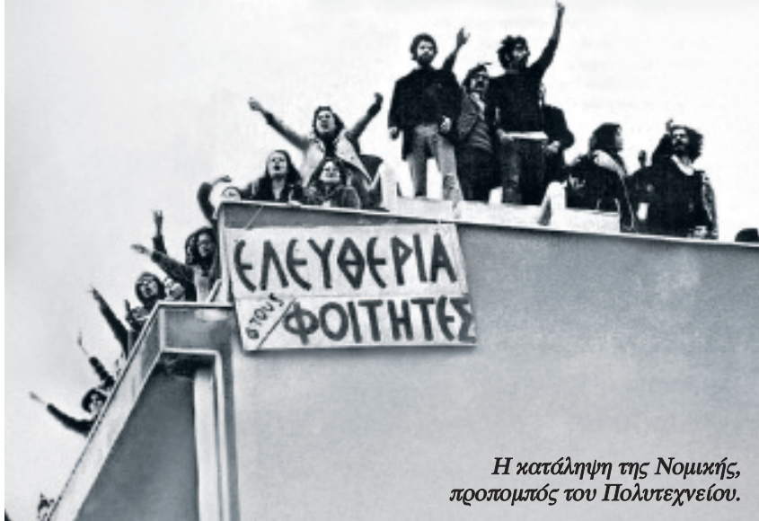
Η κατάληψη της Νομικής, προπομπός του Πολυτεχνείου.

του κράτους με ορισμένα μόνο κομμάτια της κυρίαρχης τάξης κι έτσι οξύνει τις αντιθέσεις μέσα της” 3