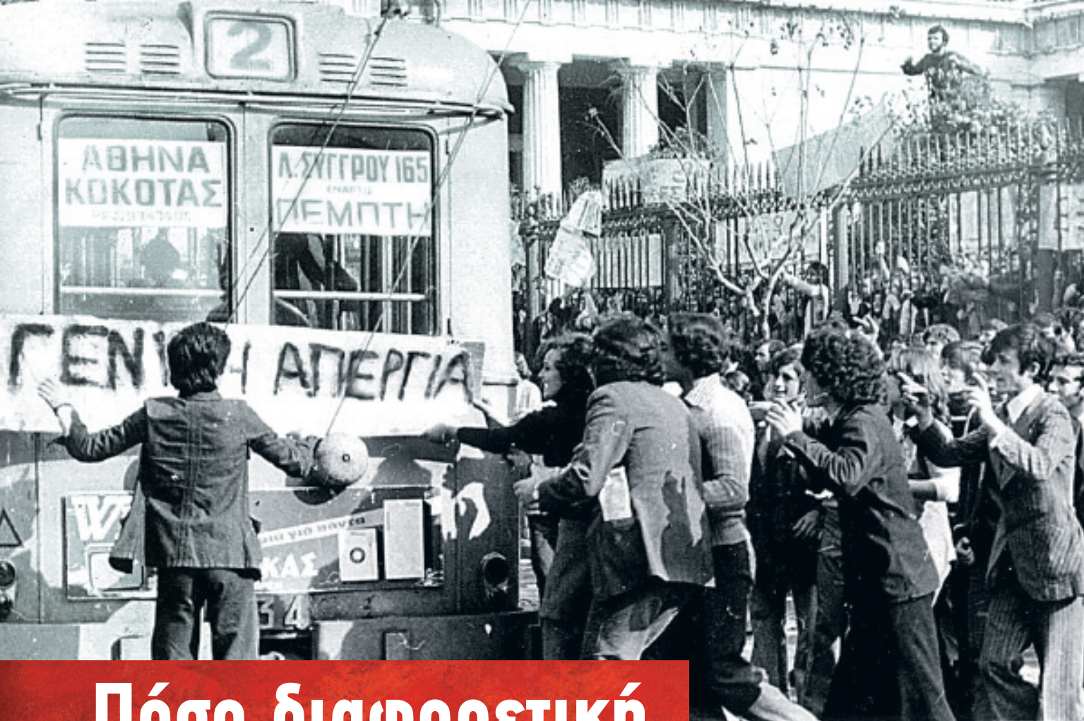
Οι εξεγερμένοι γεμίζουν τα τρολεί με συνθήματα.