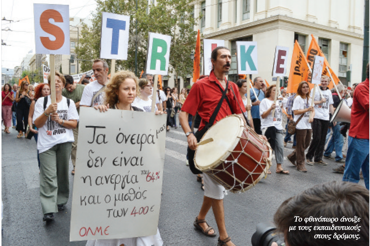
Το φθινόπωρο άνοιξε με τους εκπαιδευτικούς στους δρόμους.