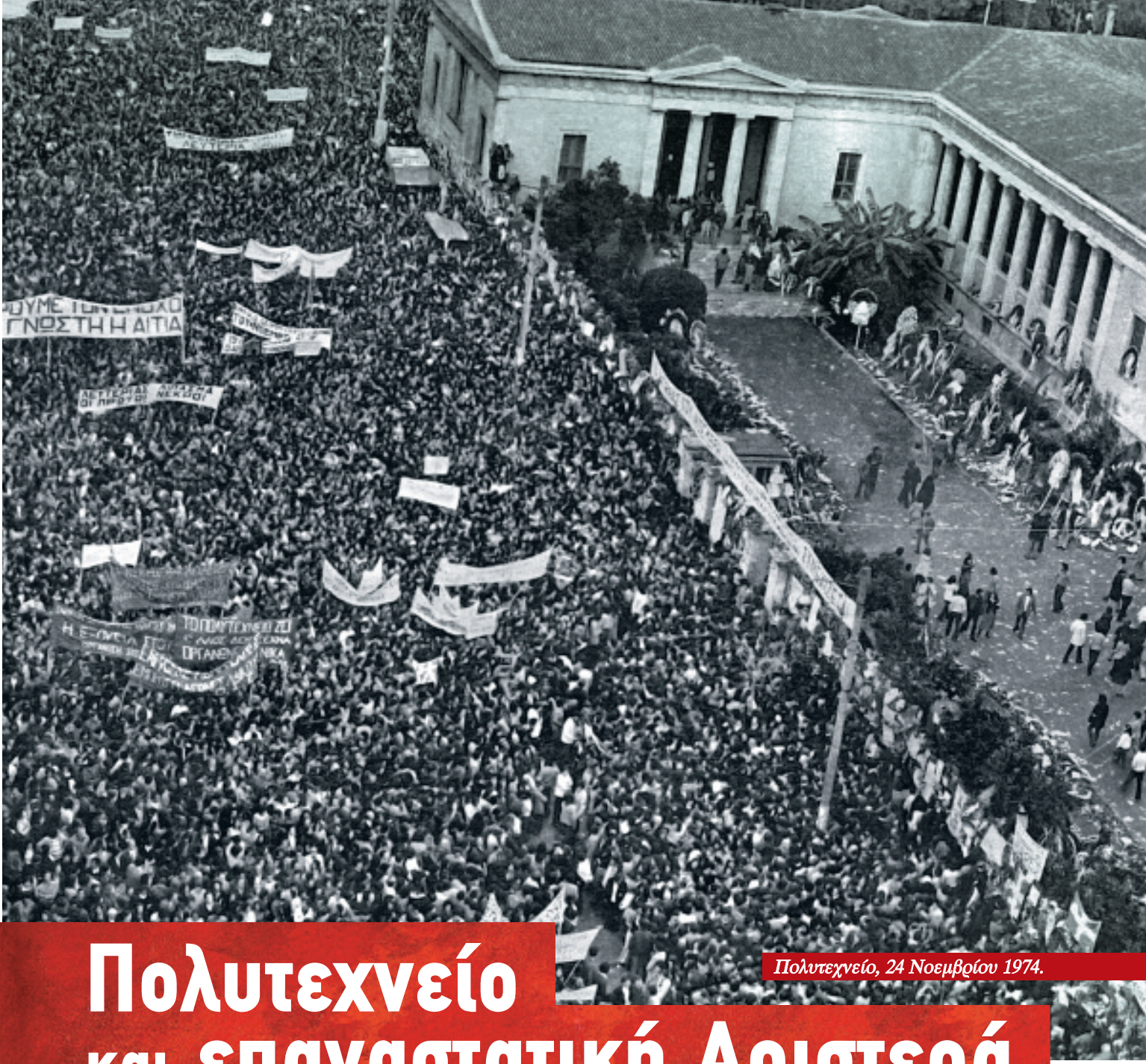
Πολυτεχνείο, 24 Νοεμβρίου 1974.