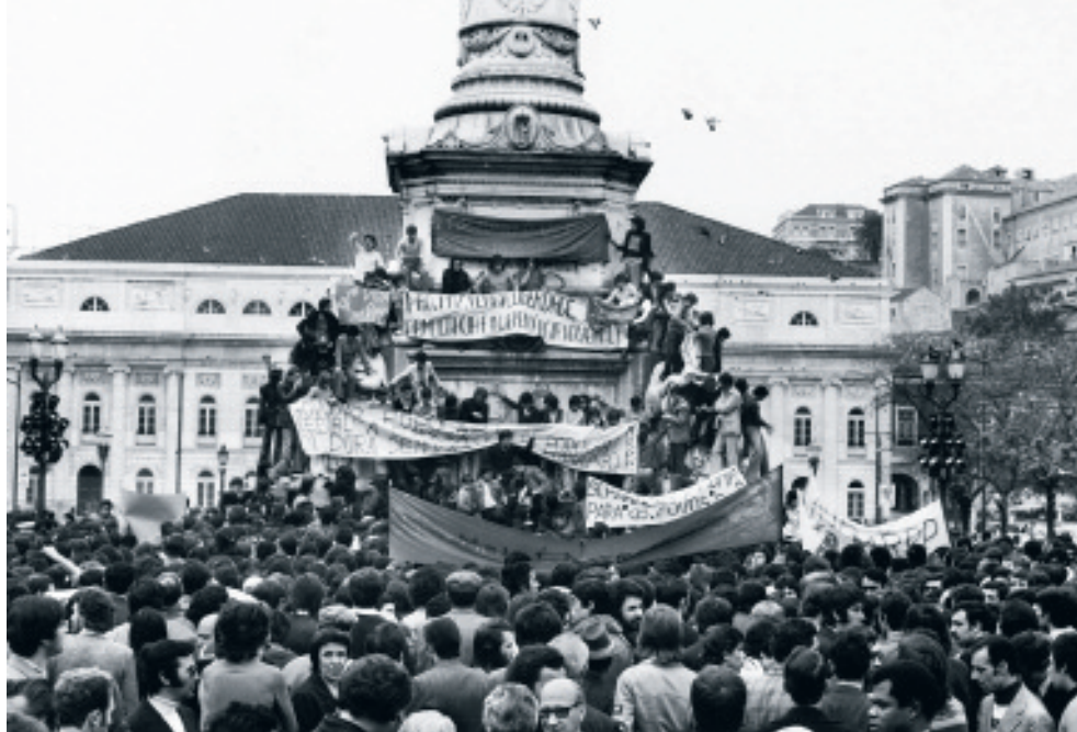
“Επανάσταση των Γαρυφάλλων”, Πορτογαλία

Οι άρχουσες τάξεις σε ολόκληρη την Ανατολική Μεσόγειο παίρνουν θέση μπροστά στη νέα μοιρασιά. Μέσα σε συνθήκες αυξημένων τιμών των πρώτων υλών, ολόκληρη η συζήτηση για την εκμετάλλευση των υδρογονανθράκων στο Αιγαίο και στη Μεσόγειο ξανανοίγει. Ενώ ταυτόχρονα η «δια αντιπροσώπων» σύγκρουση των δύο υπερδυνάμεων που εξελίσσεται στη Μέση Ανατολή οδηγεί τις άρχουσες τάξεις Ελλάδας και Τουρκίας να διαγωνίζονται για το ποιος θα αποκτήσει το πάνω χέρι ως καλύτερος συνεργάτης των ΗΠΑ. Οι έλληνες εφοπλιστές που ήδη έχουν απλώσει τα πλοκάμια τους στην μεταφορά πετρελαίου από τις χώρες του Κόλπου δεν θέλουν να χάσουν το ρόλο τους. Στην Κύπρο αυτή η αντιπαράθεση μεταφράζεται σε