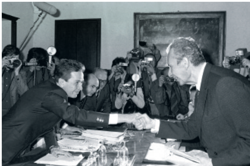
Η επισφράγιση του Ιστορικού Συμβιβασμού. Χειραψία Ενρίκο Μπερλίνγκουερ - Αλντο Μόρο.

Και τα δύο ΚΚΕ τρέχουν όχι να προχωρήσουν μπροστά αυτό το κίνημα και να το βαθύνουν, αλλά να το περιορίσουν στα όρια της σταθεροποίησης της Μεταπολίτευσης του Καραμανλή. Η συλλογιστική «Καραμανλής ή Τάνκς», όπως το είπε ο Μίκης Θεοδωράκης, ήταν το κοινό υπόβαθρό τους. Πρακτικά αποδέχονται τον Καραμανλή, στηρίζουν την άποψη ότι οι εκλογές έπρεπε να γίνουν στις 17 Νοέμβρη, στην πρώτη επέτειο του Πολυτεχνείου, αντίθετα μ' αυτά που διεκδικούσε το κίνημα, και στη συνέχεια, αρχίζουν να καταγγέλλουν την επαναστατική αριστερά σαν «αριστεροχουντικούς προβοκάτορες». Μέσα σ' αυτές τις συνθήκες, το κόμμα της δεξιάς με νέο όνομα (Ν.Δ.), αλλά με παλιό ηγέτη, τον Κωνσταντίνο Καραμανλή, πήρε το 54,4% των ψήφων, ενώ η Ενωμένη Αριστερά πήρε 9,5%. Στις βουλευτικές εκλογές του Νο-