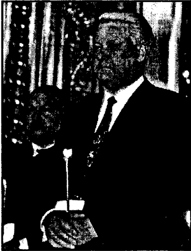
Προσευχές! Αλλά το αδιέξοδο συνεχίζεται

συνέπεια μιας συνωμοσίας του Γέλτσιν και του Γκαϊτάρ.