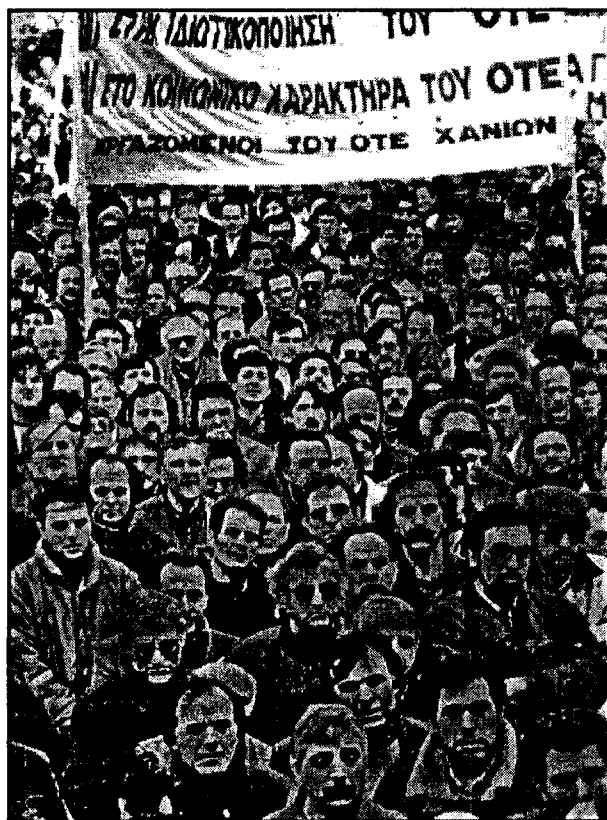
Από το μεγάλο πανελλαδικό συλλαλητήριο της ΟΜΕ-ΟΤΕ ενάντια στις ιδιωτικοποιήσεις

Ακόμα πιο δύσκολο να συγκαλυφθούν είναι τα προβλήματα της Νέας Δημοκρατίας στο εσωτερικό. Οι οικονομικές εξελίξεις τους πρώτους μήνες του 1993 εξαφανίζουν τα οποιαδήποτε περιθώρια μπορεί να υπολόγιζαν τα κυβερνητικά επιτελεία για προεκλογικές παροχές. Ο πληθωρισμός δεν λείπει να πέσει παρόλο