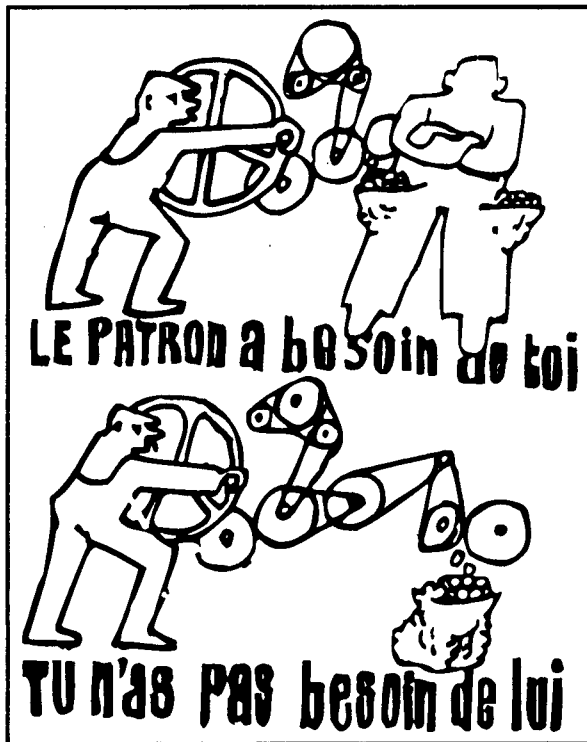
Το αφεντικό σε χρειάζεται, Εσύ δεν τον χρειάζεσαι Αφίσα, απ' τον Μάη του '68

Αυτό για χώρες όπως η Ελλάδα, από τους αδύνατους κρίκους στον παγκόσμιο καπιταλισμό, σημαίνει όχι μόνο παρατεταμένη κρίση, αλλά και επιθεσεις ενάντια στην εργατική τάξη. Η ζωή των εργατών στην Ελλάδα έχει πραγματικά χειροτερέψει τα τελευταία χρόνια: οι περισσότεροι για να τα βγάλουν πέρα αναγκάζονται να δουλεύουν πολύ περισσότερες