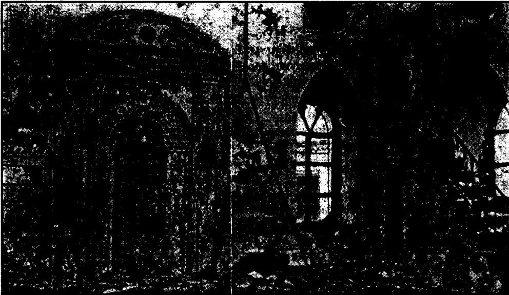
Μάρτης 1993: φωτογραφία από το καμμένο Τζαμί στην Αλεξανδρούπολη

σκευάσουν τα σπίτια τους. Δεν παίρνουν άδειες οδήγησης, δεν παίρνουν δάνεια, δεν διορίζονται στο δημόσιο. Κραυγαλέες απαλλοτριώσεις τούς παίρνουν τα κτήματα για διάφορα έργα που, συνήθως, δεν γίνονται ποτέ.