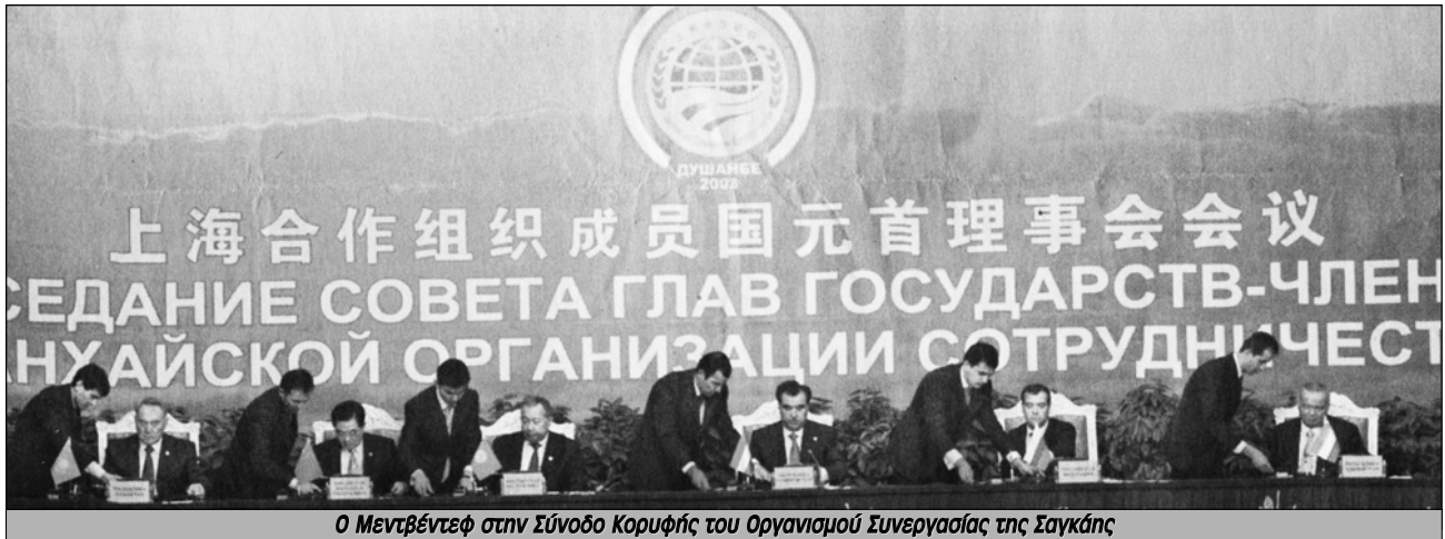
Ο Μεντβέντεφ στην Σύνοδο Κορυφής του Οργανισμού Συνεργασίας της Σαγκάης

τους εξοπλισμούς σε δυσθεώρητα ύψη. Το Σύμφωνο της Βαρσοβίας διέθετε στην Ευρώπη σαφή υπεροπλία στο επίπεδο των χερσαίων δυνάμεων. Για να αντισταθμίσουν αυτό το "μειονέκτημα" οι ΗΠΑ άρχισαν το 1957 να εγκαθιστούν στην Δυτική Ευρώπη πυρηνικά όπλα -που παρέμειναν κάτω από αμερικανικό έλεγχο. Η Ρωσία, φυσικά, δεν μπορούσε να μείνει πίσω. Στο απόγειο του πυρηνικού παροξυσμού τα δυο μπλοκ διέθεταν από κοινού στην ευρύτερη περιοχή της Ευρώπης έξι εκατομμύρια στρατιώτες και δέκα χιλιάδες πυρηνικά όπλα. Ο "αμυντικός" προϋπολογισμός αυτής της παραφροσύνης έφτανε τα 600 δισεκατομμύρια δολάρια το χρόνο! Ο Τζοναθαν Ντιν, ο εκπρόσωπος των ΗΠΑ στις ειρηνευτικές συνομιλίες της εποχής εκείνης χαρακτήρισε τον Ψυχρό Πόλεμο "την μεγαλύτερη, πιο αιματηρή και πιο ακριβή στρατιωτική αντιπαράθεση σε περίοδο ειρήνης στην ιστορία". Και δεν είχε άδικο.