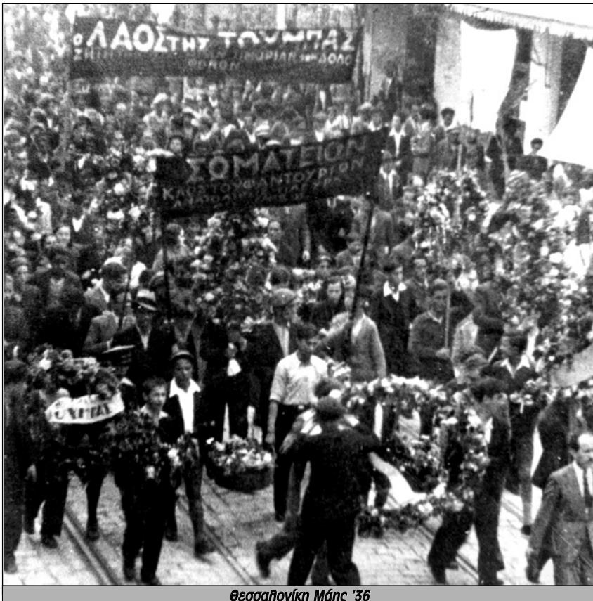
Θεσσαλονίκη Μάης '36

Η στάση αυτή δεν ήταν προϊόν λανθασμένης εκτίμησης. Ήταν η εφαρμογή της στρατηγικής επιλογής που είχε κάνει το ΚΚΕ το 1934. Τον Γενάρη εκείνης της χρονιάς η 6η Ολομέλεια της ΚΕ είχε εγκαταλείψει ως στρατηγικό στόχο την σοσιαλι-