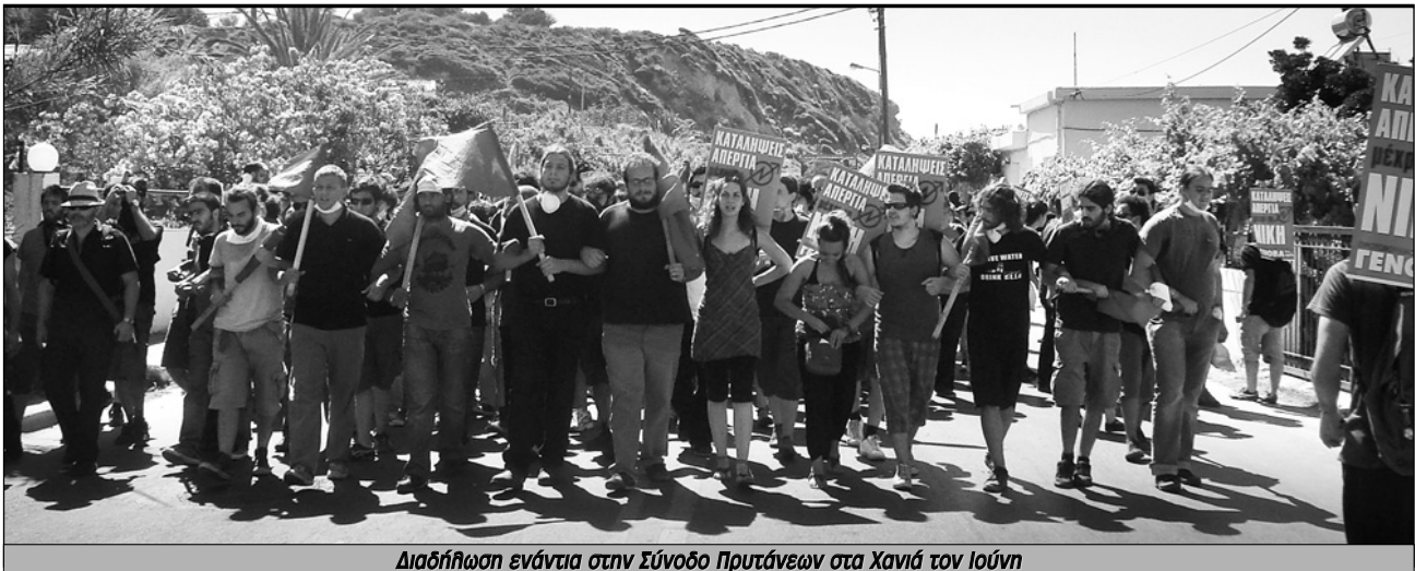
Διαδήλωση ενάντια στην Σύνοδο Πρυτάνεων στα Χανιά τον Ιούνιο

ση του Καραμανλή, όταν βρίσκει τα σκούρα επικαλείται ότι είναι "δημοκρατικά εκλεγμένη" και πως ισχυρίζεται πως έχει τη δημοκρατική νομιμοποίηση να περάσει νόμους, να στείλει τα ΜΑΤ, να κάνει επιστράτευση απεργών. Αλίμονο αν σε κάθε τέτοια επίκληση της δημοκρατίας, το κίνημα έσκυβε το κεφάλι.