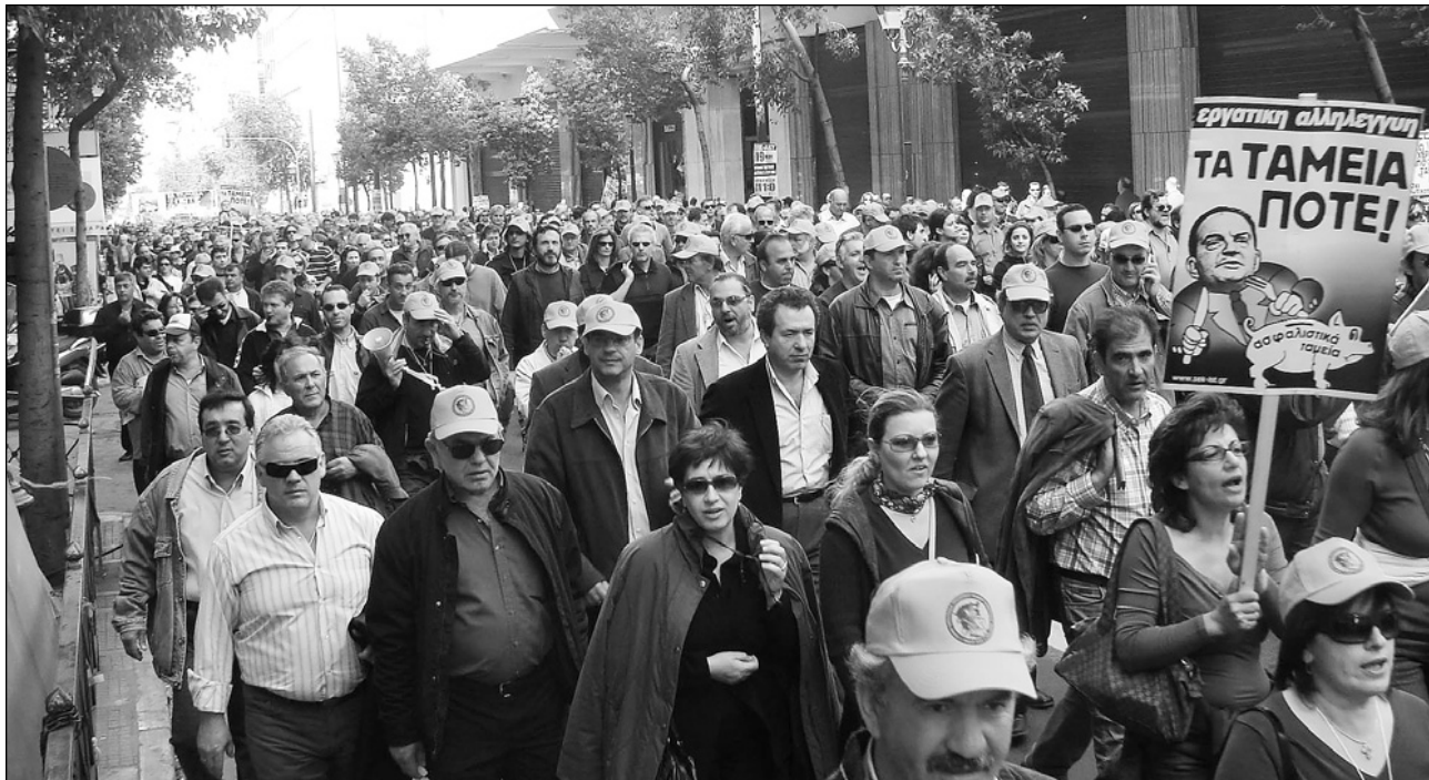
Οι απεργοί της ΔΕΗ ήταν στην πρώτη γραμμή του πανεργατικού ξεσηκωμού ενάντια στον Ασφαλιστικό νόμο. Η φωτο από την πανεργατική απεργία 19 Μάρτι