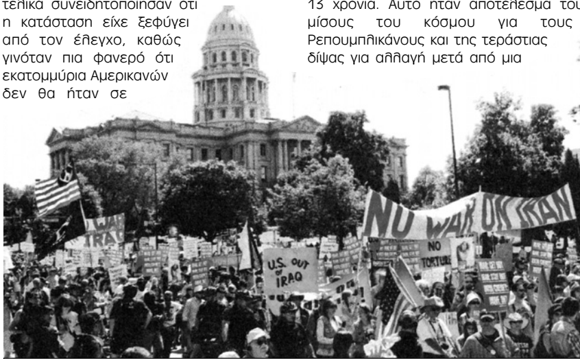
Αντιπολεμική διαδήλωση έξω από το Συνέδριο των Δημοκρατικών τον Αύγουστο

Μέσα σε αυτές τις συνθήκες θα περίμενε κανείς ότι οι αντίπαλοι του Μπους θα έκαναν περίπατο. Οι Δημοκρατικοί πέτυχαν συντριπτικές νίκες στις βουλευτικές εκλογές του Νοέμβριο του 2006 και απέκτησαν ξανά τον έλεγχο του Κογκρέσου μετά από 13 χρόνια. Αυτό ήταν αποτέλεσμα του μίσους του κόσμου για τους Ρεπουμπλικανούς και της τεράστιας δίψας για αλλαγή μετά από μια