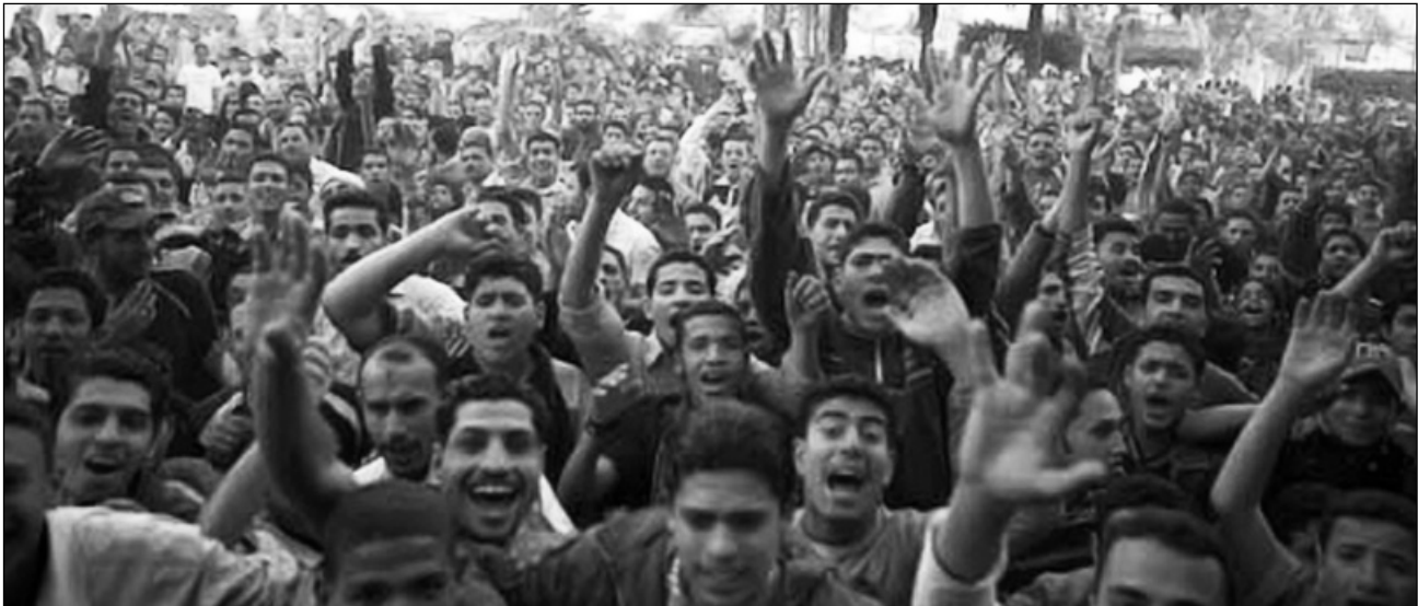
Οι εργάτες της υφαντουργίας Μαχάλα ξεσηκώθηκαν τον Απρίλη