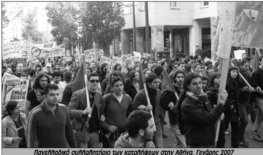
Πανελλαδικό συλλαλητήριο των καταλήψεων στην Αθήνα, Γενάρης 2007

Δεν ήταν τυχαίο ότι παράλληλα με αυτή την αρθρογραφία στην Αυγή και την Εποχή εξελισσόταν και μια άλλη σειρά άρθρων στις αστικές εφημερίδες. Εκεί αναλυτές όπως ο Ηλίας Νικοηακόπουλος ερμήνευαν τη δημοσκοπική άνοδο (αλλά και σταθεροποίηση) του ΣΥΡΙΖΑ δίνοντας συμβουλές ότι ο ΣΥΡΙΖΑ θα μπορέσει να ανέβει και άλλο αν δεν ταυτιστεί με τις ακραίες ομάδες στα Πανεπιστήμια και αν πάρει αποστάσεις από τη βία. Από δίπλα, πρώην στελέχη των "1000" καθηγητών που στήριξαν την Μαριέττα Γιαννάκου ενάντια στις καταλήψεις, έκαναν αναπαραγωγή των επιχειρημάτων, στολίζοντας τα άρθρα τους με αναφορές στο "μεγαλειώδες" κίνημα του 2006 που δεν συγκρίνεται με τις "μικρο-ομάδες που κλέβουν κάλπες". Οι ίδιοι άνθρωποι που πολέμησαν με όλη τους τη μανία το κίνημα του 2006 εμφανίζονταν ως υπερασπιστές της μαζικότητας. Τις ίδιες μέρες είχε αρχίσει να κάνει την εμφάνισή του και το όνομα του Παύλου Τσίμα ως δύναμη υπευθύνου της καμπάνιας του ΣΥΡΙΖΑ. Άλλος ένας από αυτούς που από τις στήλες των αστικών εφημερίδων ήθελε να βάθουν μυαλό στους φοι-