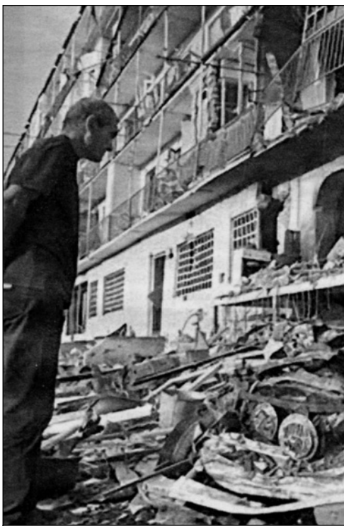
Οι καταστροφές του πολέμου στον Καύκασο

Την Παρασκευή 22 Αυγούστου ΝΑΤΟϊκά αεροσκάφη βομβάρδισαν το Αζίζαμπάντ, μια περιοχή του Σιντάντ που ανήκει στην