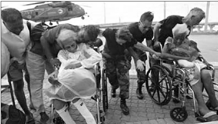
Σεπτέμβριος 2005: ο κυκλώνας Κατρίνα κατέστρεψε την Ν.Ορλεάνη. Οι φτωχοί πλήρωσαν το τίμημα της πολιτικής του Μπους

Η προσπάθεια να οικοδομηθεί ένα ανεξάρτητο κόμμα των εργατών, των μειονοτήτων, των καταπιεσμένων στην Αμερική πάει πίσω στα τέλη του 19ου αιώνα. Ο Γιουτζήν Ντεμς, σιδηροδρομικός και υποψήφιος πρόεδρος του Σοσιαλιστικού Κόμματος στις αρχές του 20ου αιώνα έφτασε να παίρνει εκατομμύρια ψήφους. Το ίδιο πέτυχε και στις εκλογές του 2000 ο αντικαπιταλιστής ακτιβιστής Ραλφ Νένντερ, που υποστηρίχτηκε από το κόμμα των Πρασίνων. Αυτή η προσπάθεια συνάντησε τη ηθισσασμένη αντίδραση του αμερικάνικου κατεστημένου, που προσπάθησε να τη διαλύσει με όλα τα μέσα, από τη βάρβαρη τρομοκρατία, μέχρι το χαρτί των φυλετικών διαχωρισμών και μια σειρά από νόμους που κάνουν εξαιρετικά δύσκολο για οποιοδήποτε νέο κόμμα τη συμμετοχή