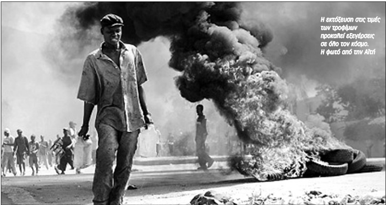
Η εκτόξευση στις τιμές των τροφίμων προκαλεί εξεγέρσεις σε όλο τον κόσμο. Η φωτο από την Αϊτί