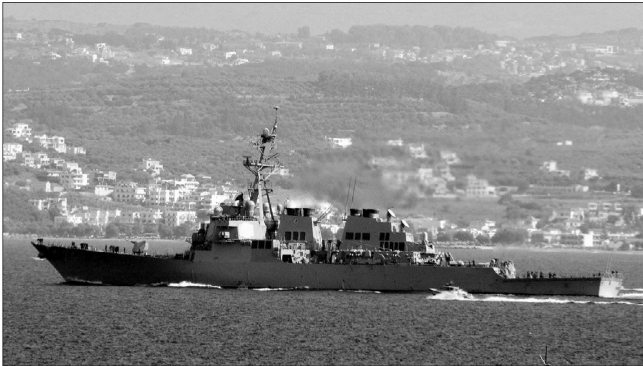
Το αμερικάνικο καταδρομικό McFaul φεύγει από την βάση της Σούδας για την Γεωργία

επιβάρησε οποιαδήποτε "τάξη" στην χώρα. "Δισεκατομμύρια δολάρια από την διεθνή βοήθεια έχουν δαπανηθεί", γράφει η εφημερίδα Financial Times, "για την κατασκευή ενός εθνικού οδικού δικτύου... Ο αφγανικός στρατός και η αφγανική αστυνομία, όμως, είναι ανίκανοι να επανακτήσουν τον έλεγχο των δρόμων από τους αντάρτες και τις διάφορες εγκληματικές συμμορίες που εισπράτουν παράνομα διόδια από τους εμπόρους που περνάνε από τις περιοχές τους... Οι επιβάτες στα λεωφορεία ελέγχονται συστηματικά και σκοτώνονται αν βρεθεί οποιοδήποτε στοιχείο που δείχνει ότι δουλεύουν για την κυβέρνηση ή τους ξένους... Οι εκπρόσωποι του ΝΑΤΟ ήνευ ότι οι επιχειρήσεις τους δεν έχουν επηρεαστεί από τις επιθέσεις στις γραμμές εφοδιασμού τους, αλλιώς φέτος προσπάθησε να βρει εναλλακτικούς δρόμους μέσω της κεντρικής Ασίας, αντί να στηριχτεί στα υλικά που έρχονται μέσω Πακιστάν. Τον Μάρτη σαράντα βυτία καταστράφηκαν κοντά στα σύνορα ανάμεσα στις δύο χώρες... Ένας δυτικός αξιωματικός ασφαλείας είπε στους Financial Times ότι για μια περίοδο το περασμένο καλοκαίρι μερικές στρατιωτικές βάσεις στο νότο είχαν σχεδόν ξεμείνει 'διακόπτοντας κάθε μη απαραίτητη μετακίνηση και κάθε επιθετική αποστολή λόγω έλλειψης καυσίμων... Στο Camp Bastion, την κεντρική βρετανική βάση στην επαρχία Χελμάντ, οι οδηγίες ήνευ ότι πρέπει να έχουν καύσιμα για 30 ημέρες. Τον περασμένο μήνα είχαν πέσει στις 7 ημέρες..."