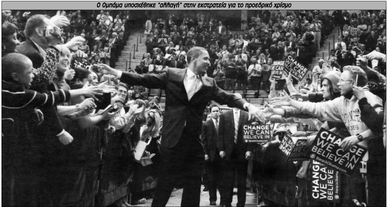
Ο Ομπάμα υποσχέθηκε "αλληλαγή" στην εκστρατεία για το προεδρικό χρίσμα

μακρά περίοδο νεοφιλελεύθερης διακυβέρνησης από τη δεκαετία του 80.