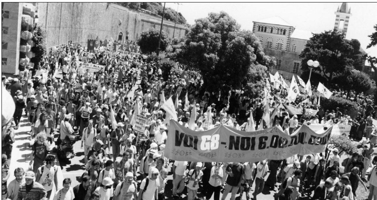
Γένοβα Ιούλης 2001 το πανό γράφει "Είστε Ο8 είμαστε 6 δισεκατομμύρια"

αυξήσεις, απ'όπου κι αν ξεκινήσουν, χρειάζεται να είναι το κέντρο της απάντησης όλων των ακτιβιστών. Απεργίες όχι συμβολικές αλλή σκληρές για να συνεχίσουν. Έτσι μόνο μπορείς να παλέψεις τον πληθωρισμό και τον κίνδυνο να μετατραπεί σε κρίση τροφίμων όπου οι πεινασμένοι θα τρώνε πλάση όπως στην Αιτή και οι χορτάτοι θα εξαπολύουν τις ρατσιστικές βρωμιές για να μας διαιρέσουν. Η δύναμη μας δεν στηρίζεται στην εξαθλίωση, αλλή στους αγώνες του πιο οργανωμένου κομματιού του εργατικού κινήματος.