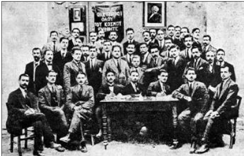
Το Δεύτερο Συνέδριο του ΣΕΚΕ Αθήνης 1920

απεργία της Καβάλας ήταν η πρώτη μεγάλη καπνεργατική απεργία μετά από χρόνια. Επίσης, οι καπνέμποροι είχαν αξιοποιήσει τα προηγούμενα χρόνια για να επιβάλουν μια νέα μέθοδο επεξεργασίας των καπνών τη «τόγκα» στην οποία μπορούσε να εργαστεί πιο ανειδίκευτο προσωπικό, ιδιαίτερα γυναίκες. Στη Καβάλα το 1933, γυναίκες και άντρες, «παλιοί» και «νέοι» εργάτες, παλεύουν μαζί. Το σημαντικότερο: νικάνε.