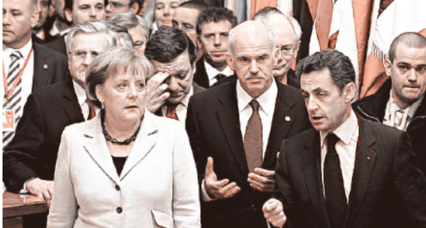
Ο Παπανδρέου μαζί με Μέρκελ και Σαρκοζί συμφωνούν τα μέτρα.

Στην Ουγγαρία, την Λετονία και την Ρουμανία, χώρες μέλη της ΕΕ και εν δυνάμει μελλοντικοί εταίροι στο ευρώ, είναι βέβαια το «νέο» ΔΝΤ που έφερε απολύσεις στο δημόσιο, μείωση μισθών, ακόμη και κλείσιμο νοσοκομείου (π.χ.