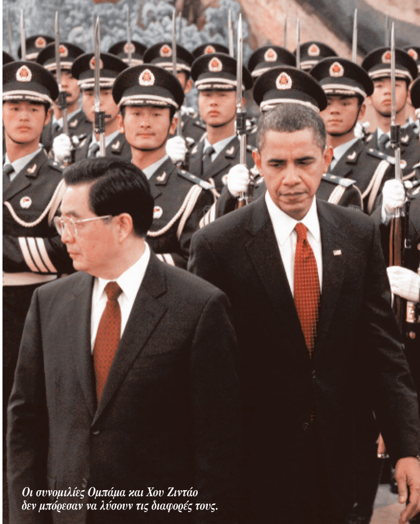
Οι συνομιλίες Ομπάμα και Χον Ζιντάο δεν μπόρεσαν να λύσουν τις διαφορές τους.

αυτοκινητοβιομηχανίες μας με όλα αυτά τα χρήματα για να πάνε όλα τα εργοστάσια στο εξωτερικό. Θέλω να δηλώσω πολύ έντονα τη διαφωνία μου με την αντίληψη που λέει ότι οι μεγάλες εταιρείες, ιδιαίτερα αυτές που είναι παγκόσμιες κλίμακας, δεν έχουν πλέον εθνικότητα», δήλωσε ο Σαρκοζί.