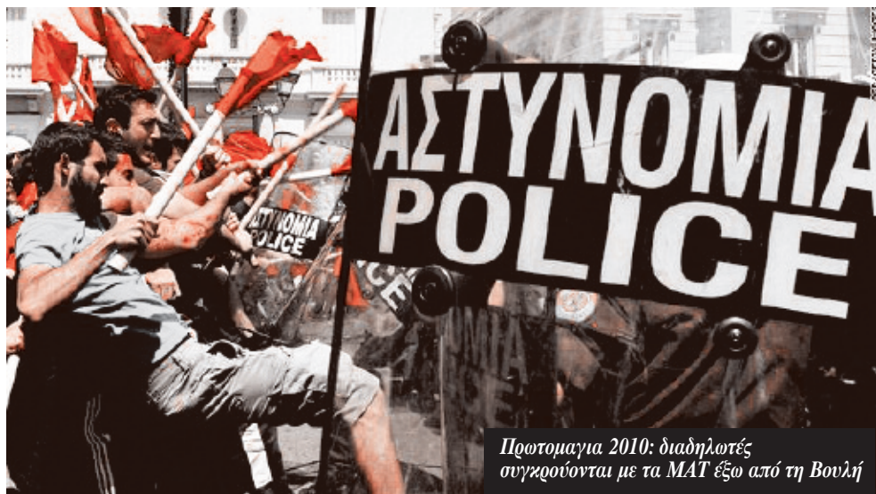
Προτομαγία 2010: διαδηλωτές συγγράφονται με τα MAT έξω από τη Βουλή

Αυτές οι εξελίξεις επηρέασαν όχι μόνο τα πιο παλιά αλλά και καινούργια κομμάτια της εργατικής τάξης. Οι μαθητές και οι φοιτητές του αντιπολεμικού κινήματος έγιναν η γενιά των 700 ευρώ, της επισφαλούς εργασίας και των ελαστικών σχέσεων απασχόλησης. Ανάμεσα σ' αυτά τα δύο κομμάτια της εργατικής τά-