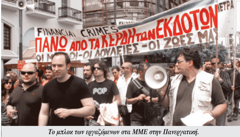
Το μπλοκ των εργαζόμενων στα ΜΜΕ στην Πανεργατική.

Η ελληνική δημοσιονομική κρίση δεν είναι παρά ένα ακόμη επεισόδιο της κρίσης του καπιταλισμού που άρχισε με την κατάρρευση της Lehman Brothers. Μιας κρίσης που ανέδειξε όλη την παράνοια του συστήματος, τα παιχνίδια και τις ρεμούλες των μεγάλων τραπεζών (βλέπε Goldman Sachs) και την μεταξύ τους αλληλεξάρτηση, δημιουργώντας μία ακόμη παγκόσμια φούσκα: αυτήν του δημόσιου και ιδιωτικού χρέους που αυτή τη φορά δεν κτυπά τους «υποανάπτυκτους» της Λατ. Αμερικής και της Ασίας αλλά τον αναπτυσσόμενο βορρά.