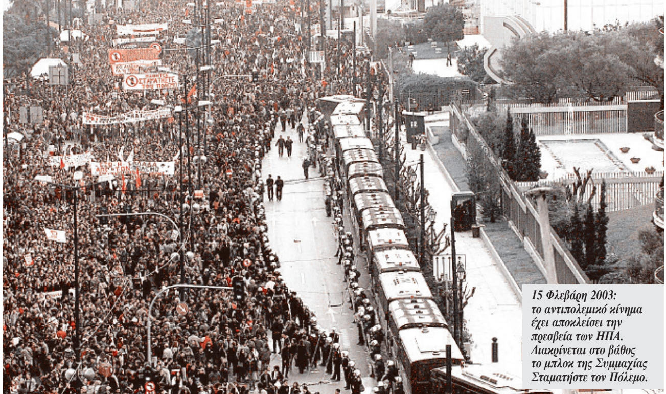
15 Φλεβάρη 2003: το αντιπολεμικό κίνημα έχει αποκλείσει την προσβεία των ΗΠΑ. Διακρίνεται στο βάθος το μπλοκ της Συμμαχίας Σταματήστε τον Πόλεμο.

σχέση αυτή γίνεται αρκετά ασταθής, όχι γιατί είναι διαφορετικός ο ρόλος της γραφειοκρατίας, αλλά γιατί είναι ευάλωτη, πιέζεται και αναγκάζεται να αντιδράσει μέσα από τους εργατικούς αγώνες.