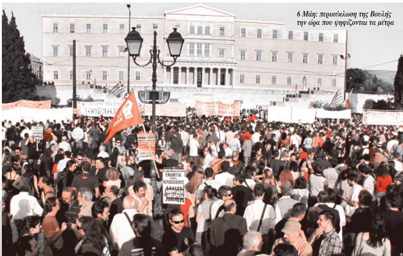
6 Μάη: περικύκλωση της Βουλής την ώρα που ψηφίζονται τα μέτρα

Στη Βρετανία, το Εργατικό Κόμμα ήταν στην κυβέρνηση στο Κραχ του 1929. Είχε κερδίσει τις εκλογές το Μάη εκείνης της χρονιάς και ο ηγέτης του, Ράμσεϊ Μακντόναλντ, είχε δηλώσει ότι «η παρούσα κυβέρνηση θα μείνει στην ιστορία ως η κυβέρνηση της πλήρους απασχόλησης». Το Εργατικό Κόμμα διέθετε τότε 289 βουλευτές, οι Συντηρητικοί 260 και οι Φιλελεύθεροι 58, ενώ οι άνεργοι έφταναν το 1.300.000. Μετά από ένα χρόνο η ανεργία ανέβηκε στα 2 εκατομμύρια. Στο τέλος της θητείας εκείνης της κυβέρνησης είχε φτάσει τα 2.700.000, πο-