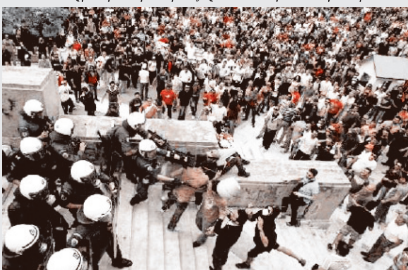
Πανεργατική 5 Μάη: διαδηλωτές προσπαθούν να φτάσουν στη Βουλή.

Είναι απαραίτητο να δυναμώσουμε την επαναστατική αριστερά και αριθμητικά και με σύνδεση με την εργατική τάξη και τα συνδικάτα. Δεν φτάνει να χαϊρόμαστε επειδή το εργατικό κίνημα στην Ελλάδα βρισκεται στην πρωτοπορία του εργατικού κινήματος στην Ευρώπη. Διεκδικούμε σ' αυτή τη μάχη, να κυριαρχήσει η επαναστατική αριστερά της ελπίδας και όχι η αντεπανάσταση της απελπισίας. ■