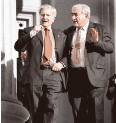
Οι δύο αρχιτραπεζίτες: Αριστερά ο Τρισέ (ΕΚΤ) και δεξιά ο Στρος Καν (ΑΝΤ)

νες, όπως αύριο οι Πορτογάλοι, οι Ισπανοί ανακαλύπτουν ότι στην πραγματικότητα νόμισμά τους δεν είναι το ευρώ, αλλά το «ελληνικό» ευρώ, το «πορτογαλικό» ευρώ, κλπ.