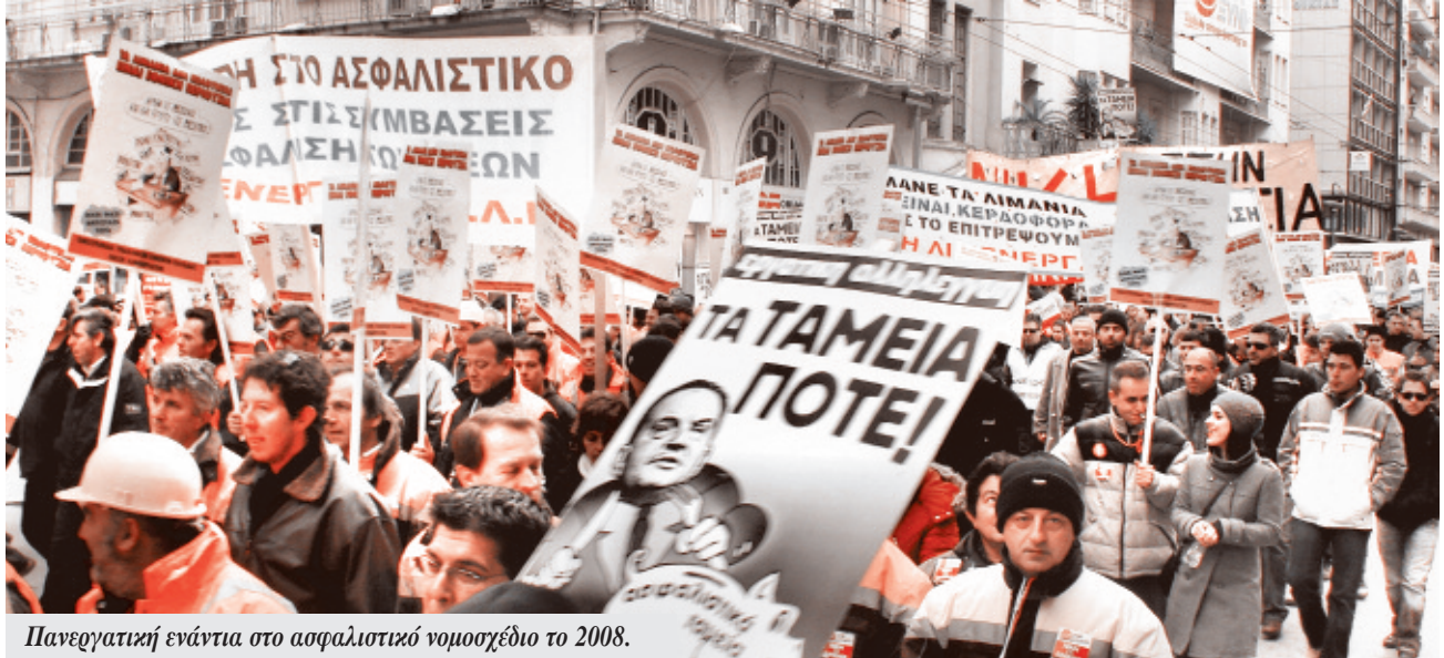
Πανεργατική ενάντια στο ασφαλιστικό νομοσχέδιο το 2008.

Ξησε το όριο από το 20 στο 23%. Το 2007, η κυβέρνηση του Καραμανλή το αύξησε ξανά. Οι “επενδυτές” έτριβαν τα χέρια τους από χαρά: