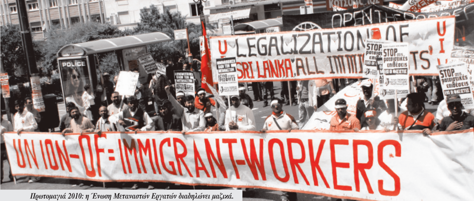
Πρωτομαγιά 2010: η Ένωση Μεταναστών Εργατών διαδηλώνει μαζικά.

νομικού με το πολιτικό αγώνα διότι όσο ποτέ άλλοτε είναι αναγκαία για να πετύχουμε νίκες.