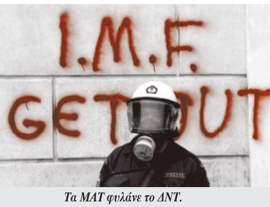
Τα ΜΑΤ φυλάει το ΔΝΤ.

δευτικούς» δεν πρέπει να γίνει. Μια τέτοια άποψη αγνοεί το τι επίδραση μπορεί να έχει ένας κλάδος που μπαινεί μπροστά.