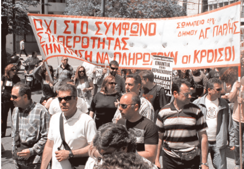
22 Απρίλη, απεργία ΑΔΕΔΥ: πανό του σωματείου του Δήμου Αγ. Παρασκευής.

για την παγκόσμια οικονομία (World economic outlook) αναφέρει ρητά ότι «βραχυπρόθεσμα, ο κύριος κίνδυνος είναι ότι, αν δεν ελεγχθούν, οι ανησυχίες των αγορών για τη ρευστότητα και την ικανότητα αποπληρωμής των χρεών της Ελλάδας μπορεί να μετεξελιχθούν σε μια μεταδοτική κρίση χρέους των κρατών με μεγάλες διαστάσεις.»