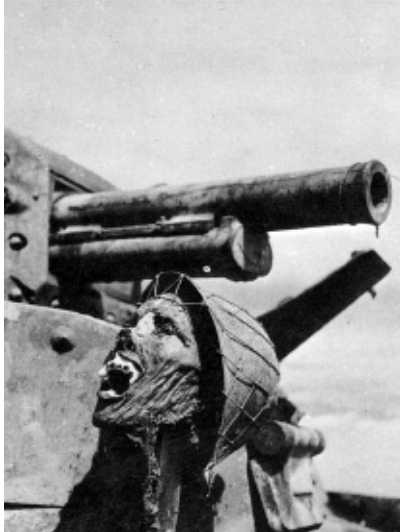
Η φρίκη του πολέμου: Γιαπωνέζος στρατιώτης καμμένος μέσα στο τάνκς.

Από τότε οι σταλινικές ηγεσίες προβάλλουν τη δικαιολογία ότι το Σύμφωνο έδωσε χρόνο και χώρο στη ρώσικη ηγεσία να προετοιμάσει την άμυνά της. Αυτή την άποψη υποστηρίζει και σήμερα το ΚΚΕ. Τα ιστορικά γεγονότα διαφεύδουν αυτούς τους ισχυρισμούς. Τις πρώτες μέ-