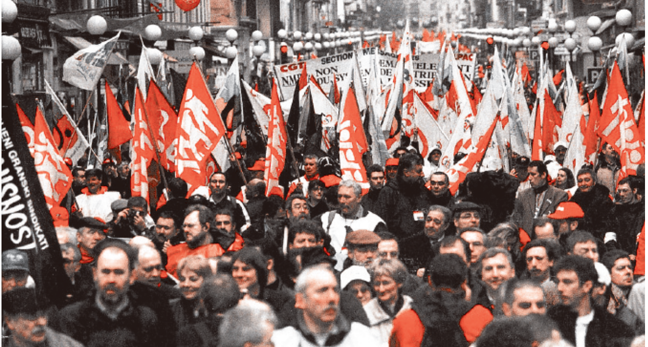
Δεκέμβριος 2000: τα συνδικάτα διαδηλώνουν στη Νίκαια της Γαλλίας ενάντια στη σύνοδο της ΕΕ.

στους εργαζόμενους. Η ανυπακοή και η ρήξη με την ΕΕ δεν μας οδηγεί να αναζητούμε λύση με εθνικό έλεγχο στο νόμισμα και τους θεσμούς αλλά με εργατικό έλεγχο στο τραπεζικό σύστημα και σε όλη την κοινωνία.