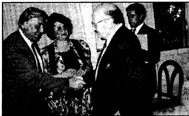
Οι τρυφερές στιγμές: ο πρωθυπουργός της Αλβανίας Μέξι στα εγκαίνια του σούπερ μάρκετ του Ε.Σταυρόπουλου. Ο Σταυρόπουλος έχει και την αντιπροσωπεία της ΕΒΓΑ στην Αλβανία.

Η χρησιμοποίηση της μειονότητας σαν εργαλείου του ελληνικού Υπουργείου Εξωτερικών είχε σαν αποτέλεσμα την αύξηση της καταπίεσής της από τον Μπερίσα. Η εμφάνιση για παράδειγμα ελληνικών σημαιών σε χωριά της μειονότητας ήταν η ευκαιρία για το κατέβασμα των αλβανικών ΜΑΤ (ας αναλογιστούμε και πάλι τι θα συνέβαινε αν εμφανίζονταν τουρκικές σημαίες στα χωριά της μειονότητας στη Δ.Θράκη). Ταυτόχρονα, όλες αυτές οι κινήσεις Μητσοτάκη-Σαμαρά ήταν ένα πρώτης τάξης πολιτικό δώ-