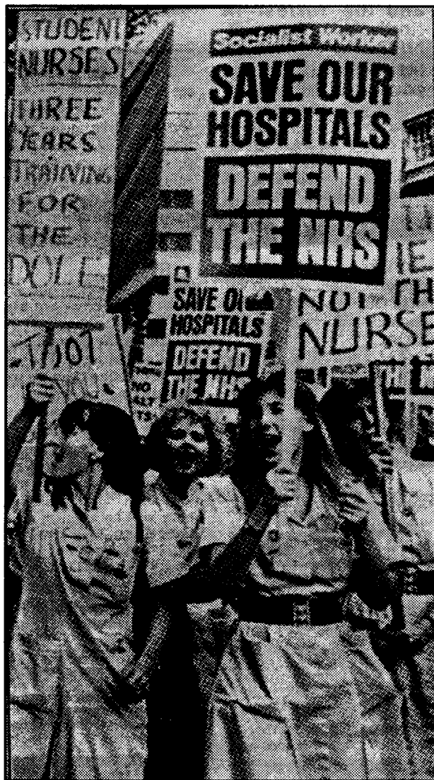
Σε όλη την Ευρώπη η εργατική τάξη αντιστέκεται στις περικοπές που διαλύουν σχολεία και νοσοκομεία. Ο έλεγχος των εργατών στην οικονομία θα μπορούσε αμέσως να διπλασιάσει τις δαπάνες για την υγεία και την παιδεία.

Ακόμα και μόνο τον έλεγχο αυτών των πόρων να έπαιρνε η εργατική τάξη όταν έρθει στην εξουσία και αρχίσει την προσπάθεια για το χτίσιμο του σοσιαλισμού, θα μπορούσε να διπλασιάσει α-