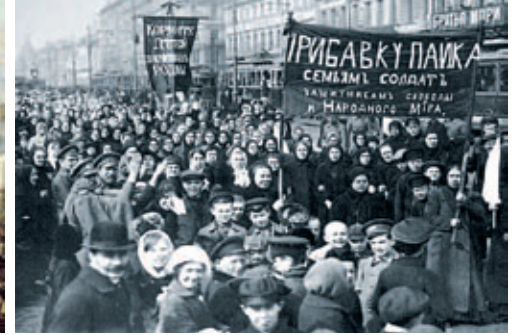
Σπαρτακος, Βαστίλη, Ρωσία 1917: οι μεγάλες επαναστατικές έφοδοι.

Η γραφειοκρατία που δημιουργήθηκε και την οποία εξέφρασε πολιτικά ο Στάλιν αναδείχθηκε σε νέα κυρίαρχη τάξη. Ο Στάλιν εξόντωσε τις αντιπολιτευόμενες φωνές, με πρώτη εκείνες της Αριστερής Αντιπολίτευσης του Τρότσκι, και έθεσε ως στόχο την «ανάπτυξη των παραγωγικών δυνάμεων» ώστε να «φτάσουμε και να ξεπεράσουμε τη Δύση σε πέντε – δέκα χρόνια», ενώ η εργατική τάξη αποστερήθηκε από κάθε έλεγχο στα μέσα παραγωγής.