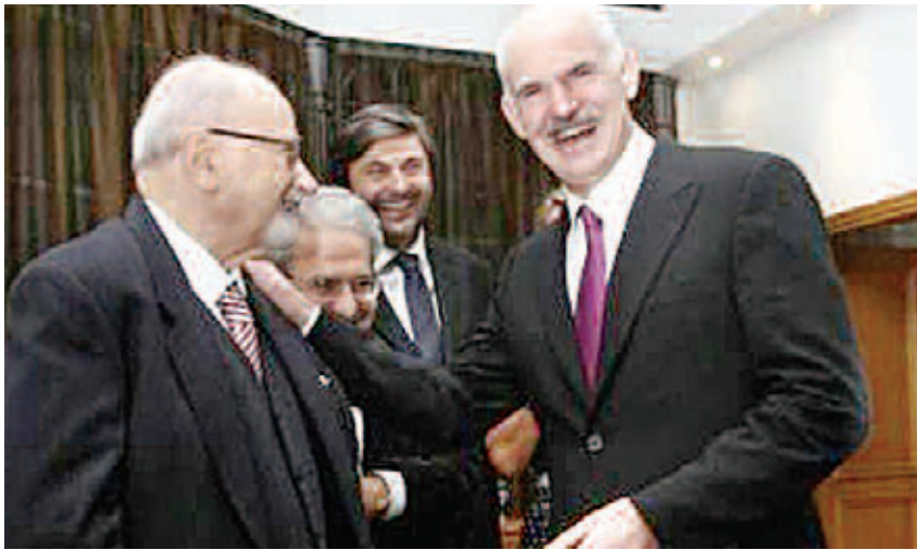
Ευτυχώς, η Αριστερά δεν ακοιούθησε τις συμβουλές του Κύρκου.

ρεί να έχει αντίπαλο την αριστερά, μπορεί όμως στην ανάγκη να την χρησιμοποιήσει και σαν σύμμαχο.