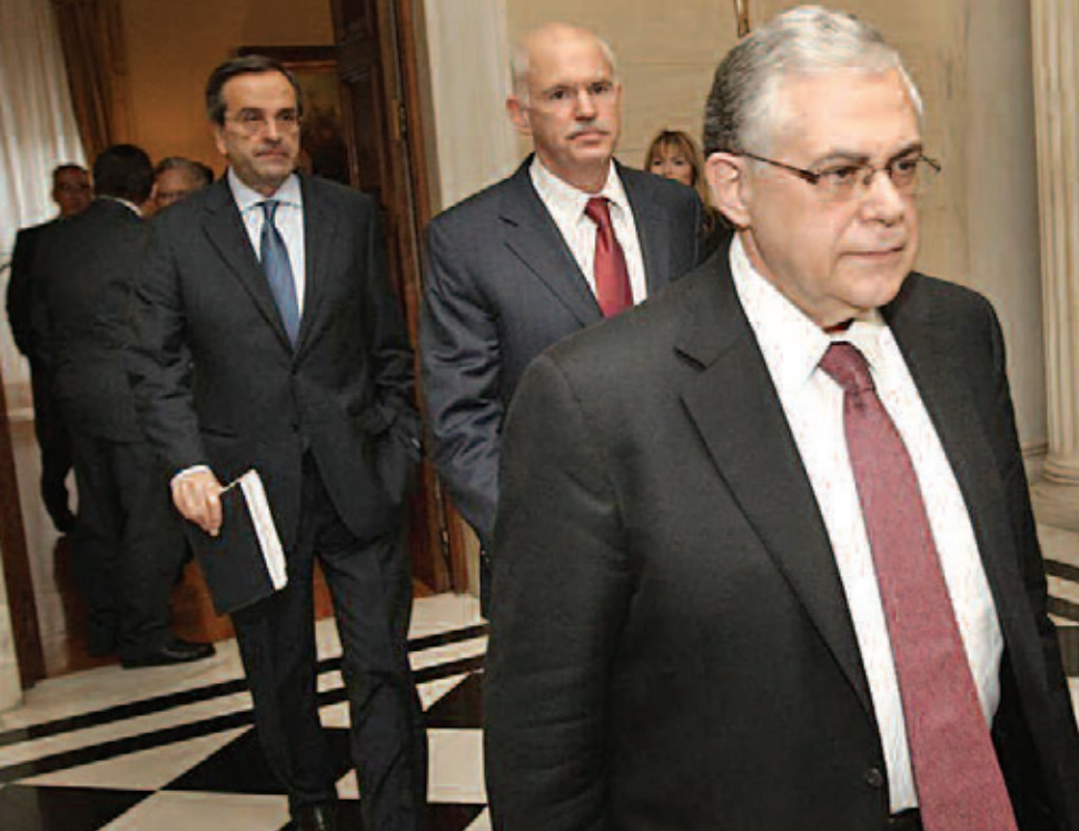
2012: Σαμαράς, Παπανδρέου, Παπαδήμος στο Προεδρικό Μέγαρο.

γικές. Μία άποψη λέει ότι βιώνουμε μια δημοκρατική και συνταγματική «εκτροπή», με τη μορφή ενός ιδιότυπου «κράτους έκτακτης ανάγκης». Αρκετές φορές η διαπίστωση αυτή συνοδεύεται από την αναγκαιότητα για τη δημιουργία ενός ευρύτατου δημοκρατικού λαϊκού μετώπου για την «αποκατάσταση της νομιμότητας». Μία άλλη άποψη μιλάει για τη «μετάλλαξη» της αστικής δημοκρατίας σε «χούντα». Μάλιστα, διανοούμενοι που φλερτάρουν με τέτοιες απόψεις κατάργησης των διαχωριστικών γραμμών ανάμεσα στην αστική δημοκρατία και μια δικτατορία βάζουν ακόμα και θετικό πρόσημο σε αυτή την εξέλιξη: ίσως έτσι διαλυθούν ευκολότερα οι δημοκρατικές αυταπάτες που υπήρξαν τόσο κεντρικές στην ιδεολογική και πολιτική ηγεμονία του καπιταλισμού στις κοινωνίες της Δύσης.