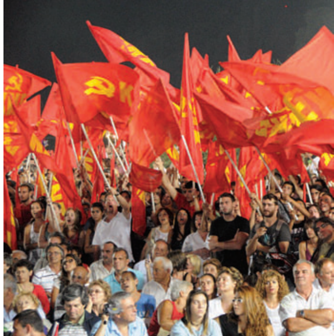
ΣΥΡΙΖΑ, ΚΚΕ, ΑΝΤΑΡΣΥΑ: οι πρωτοβουλίες του αντικαπιταλισμού επηρεάζουν όλη την Αριστερά.

μένων δυνάμεων της επαναστατικής Αριστεράς. Το γεγονός ότι είχαμε διαρκώς τρεις πόλους της Αριστεράς – το ΚΚΕ, το ΣΥΝ/ΣΥΡΙΖΑ και την επαναστατική Αριστερά – δημιουργούσε διαρκώς έναν ανταγωνισμό προς τα Αριστερά, που δεν επέτρεπε να γίνουν ανεξόδα δεξιές προδοσίες. Δεν υπάρχει άλλος λόγος που ο ΣΥΝ δεν έγινε αριστερό αξεσουάρ του ΠΑΣΟΚ, έχει να κάνει με το ότι έβλεπε πάντα δυνάμεις στα Αριστερά του που δεν μπορούσε να τους αφήσει ελεύθερο το πεδίο. Αντίστοιχα, το ΚΚΕ αναγκάστηκε να μπει μέσα σε κύματα καταλήψεων στα Πανεπιστήμια, επειδή υπήρχε η αντικαπιταλιστική Αριστερά που έπαιρνε πρωτοβουλίες και το έσερνε προς τα Αριστερά. Αντίθετα λοιπόν με τις εύκολες εκκλήσεις για “ενότητα της Αριστεράς”, σε μεγάλο βαθμό η “διάσπαση” της Αριστεράς ήταν αυτή που την κράτησε όρθια μέσα στις τελευταίες δύο δεκαετίες. Η ενότητα στη δράση επιβλήθηκε επειδή η αντικαπιταλιστική Αριστερά είχε την οργανωτική ανεξαρτησία της.