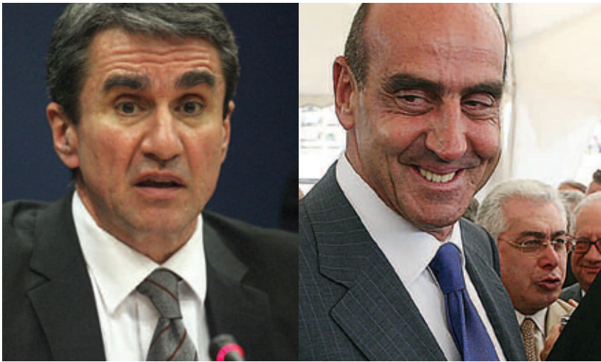
Λοβέρδος όπως Βουληγαράκης: "Αμα δεν είσαι αριστερός..."

να γίνει πολιτική έκφραση απέναντι στην επίθεση της λιτότητας. Στην Ουγγαρία οι φασίστες ηγεμόνευσαν στην αντιπολίτευση όλα τα προηγούμενα χρόνια, με αποτέλεσμα σήμερα η κρίση να μεταπορίζει το πολιτικό σκηνικό προς τα δεξιά, με την δεξιά να ελέγχει όχι μόνο την κυβέρνηση αλλά και το 93% των εδρών στα τοπικά συμβούλια, με ένα πρόγραμμα αλτρωτισμού, περιορισμού των δικαιωμάτων και ρατσισμού κατά των Ρομά. 7 Ακόμα νωρίτερα, η έλλειψη μιας πολιτικής Αριστεράς καθόρισε πως οι μεταβάσεις του '89-'91 στην Ανατολική Ευρώπη μπήκαν στο καλούπι της στροφής στην ελεύθερη αγορά, παρότι κινητήρια δύναμη ήταν οι αγώνες του κόσμου που πάλευε ενάντια στις συνέπειες της κρίσης. Οι φιλελεύθεροι βρίσκονταν μόνοι τους στην πολιτική αρένα και κατάφεραν να δώσουν σχήμα στην επαναστατική έκρηξη.