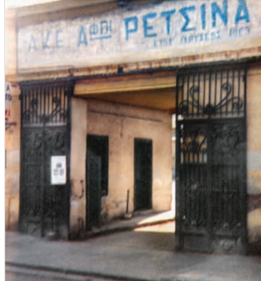
Σε αυτή την είσοδο του Ρετσίνα συγκεντρώθηκαν οι υφάντριες που απεργούσαν το 1892.

Όταν ο Έγκελς γράφει στο βιβλίο του «Η καταγωγή της οικογένειας, η ιδιοκτησία, και το κράτος» ότι η καταπίεση των γυναικών ξεκινάει από τη στιγμή που η κοινωνία διαιρείται σε τάξεις, θέλει να τονίσει ότι δεν υπήρχε καταπίεση στις πρωτόγονες αταξικές κοινωνίες, ότι η γέννηση των παιδιών δεν καθόριζε τη θέση της γυναίκας μέσα