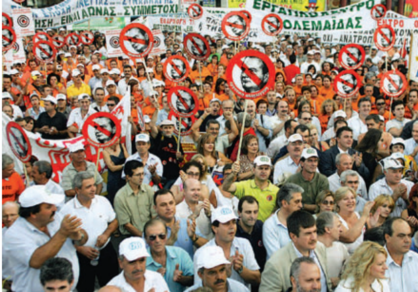
Θεσσαλονίκη, Σεπτέμβριος 2005.

Γένοβα, ο αντιιμπεριαλισμός από το μαζικό αντιπολεμικό κίνημα του 2003, το σπάσιμο των ψευδαισθήσεων για την ΕΕ από τα ΟΧΙ των Ιρλανδών και τον Γάλλων στο Ευρωσύνταγμα, οι μάχες ενάντια στα Μνημόνια του 2010-11 από τις επαναστάσεις στην Τυνησία και την Αίγυπτο.