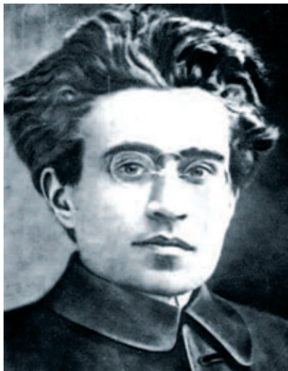
Αντόνιο Γκράμσι: εργατικοί θεσμοί στη θέση των αστικών.

Και για να μην αφήνει κανένα περιθώριο αμφιβολίας, λίγο αργότερα πρόσθετε: «Δεν μπορεί να υπάρξει καμιά κυβέρνηση των εργατών μέχρι τη στιγμή που η εργατική τάξη θα είναι σε θέση να