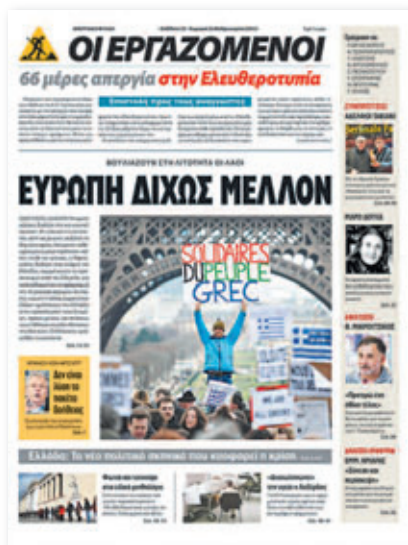
Το απεργιακό φύλλο της Ελευθεροτυπίας.

Ο συντονισμός είναι ένα ακόμα κρίσιμο τεστ για την Αριστερά. Η κυβέρνηση και τα αφεντικά κάνουν ό,τι περνάει από το χέρι τους για να ξεκόψουν τον ένα χώρο από τον άλλο, τον ένα αγώνα από τον διπλανό του. Αντίθετα, ο συντονισμός πολλαπλασιάζει τη δύναμη κάθε εργατικού αγώνα. Γι' αυτό έχουν πολεμήσει μ' όλα τα μέσα απεργιακούς συντονισμούς όπως στις αστικές συγκοινωνίες του Λεκανοπέδιου. Ο συντονισμός των κομματιών που παλεύουν είναι και η απάντηση στους συμβιβασμούς και τις τρικλοποδιές που βάζει η συνδικαλιστική γραφειοκρατία στο άπλωμα των αγώ-