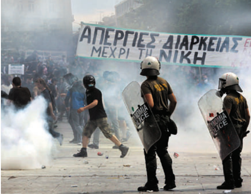
17/01/2012: 24ωρη απεργία των Εργατικών Κέντρων ενάντια στα κηλεύματα και τις απολύσεις.

αιώνα. Αν θέλαμε να κάνουμε μια χρονική περιοδολόγηση, θα χωρίζαμε την αναμέτρηση του ελληνικού αστισμού με την εργατική τάξη σε τρεις περιόδους.