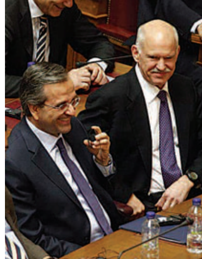
ΠΑΣΟΚ - ΝΔ: δίδυμο κρίσης.

για να δίνει τις όποιες μάχες της, οικονομικές, πολεμικές, ταξικές, έχει ανάγκη να κινητοποιεί πίσω της αν όχι ολόκληρη την εργατική τάξη, τουλάχιστο το μεγαλύτερο τμήμα της. Αυτή την κινητοποίηση την εξασφαλίζουν όλοι οι θεσμοί της, ο στρατός, η δικαιοσύνη, η εκπαίδευση, η εκκλησία. Μα τον ρόλο κλειδί τον παίζουν οι πολιτικοί εκφραστές της που δίνουν μορφή στους πολιτικούς στόχους της, έτσι ώστε να αποσπούν τη συναίνεση των εργατών και των άλλων στρωμάτων που οι αστοί θέλουν να σύρουν πίσω τους.