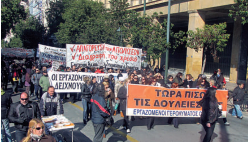
17/01/2012: 24ωρη απεργία των Εργατικών Κέντρων ενάντια στα κλεισίματα και τις απολύσεις.

μόνο από την κυβέρνηση του ΠΑΣΟΚ αλλά και από την “αντιμνημονιακή” τότε ΝΔ.