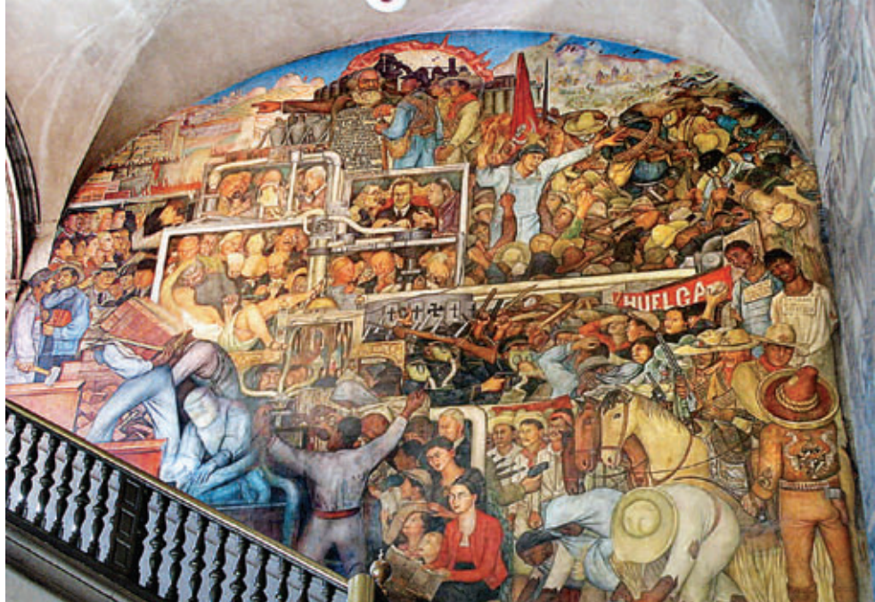
Τοιχογραφία του Ντιέγκο Ριβέρα που απεικονίζει την ιστορία του Μεξικού.

Οι πόλεις-κράτη εξαπλώθηκαν κατά την περίοδο της αρχαιότητας και λίγους αιώνες αργότερα δημιουργήθηκαν οι