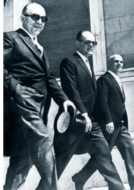
1967: Μακαρέζος, Παπαδόπουλος, Παττακός.

Για να βαθύνουμε ωστόσο την κατανόησή μας, πρέπει να πάμε τη σκέψη μας ένα βήμα παραπέρα από την αυτάρχειτη πραγματικότητα ότι η δημοκρατία ακυρώνεται από τους πολιτικούς που «τα παίρνουν» και να μπούμε στη σκοτεινή σφαίρα εκείνων που «τα δίνουν» και του πώς τα αποκτήσανε. Μόνον έτσι θα καταλάβουμε ότι η ακύρωση της δημοκρατίας στον καπιταλισμό δεν αποτελεί κάποιου είδους δυσλειτουργία του συστήματος, αλλά ένα καλά κρυμμένο δομικό συστατικό του. Σε αντίθεση με τα προηγούμενα οικονομικά συστήματα, όπου η πολιτική καταπίεση αποτελούσε τον κυρίαρχο τρόπο με τον οποίο οι άρ-