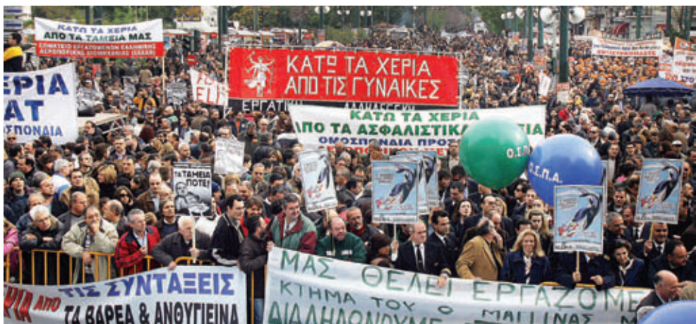
Από τις Πανεργατικές ενάντια στο ασφαλιστικό της Πετραλιά. Στο κέντρο το πανό "Κάτω τα χέρια από τις γυναίκες".

μεγάλη ιστορία του εργατικού κινήματος και, περισσότερο ακόμα, από την κρυμμένη ιστορία των εργατριών. Είναι κρυμμένη γιατί χρειάζεται να συγκρουστεί με τις κυρίαρχες ιδέες για τον ρόλο των γυναικών μέσα στο σπίτι και στην οικογένεια. Γιατί, παρόλο που μετά το δεύτερο παγκόσμιο πόλεμο, στο δεύτερο μισό του 20ου αιώνα, οι γυναίκες βγήκαν μαζικά στην παραγωγή, είχαν ταυτόχρονα να αντιμετωπίσουν μια σειρά από διακρίσεις σε βάρος τους. Η ψαλίδα ανάμεσα στους μισθούς των γυναικών και των ανδρών συναδέλφων τους ήταν (και παραμένει μέχρι σήμερα) πάνω από 20%. Τα βάρη από τις δουλειές του σπιτιού συνέχισαν να πέφτουν στις πλάτες τους. Και οι συστηματική σεξουαλική παρενόχληση ποτέ δεν έπαψε να είναι εργοδοτική ταχτική για να κρατάει τις εργάτριες «στη θέση τους».