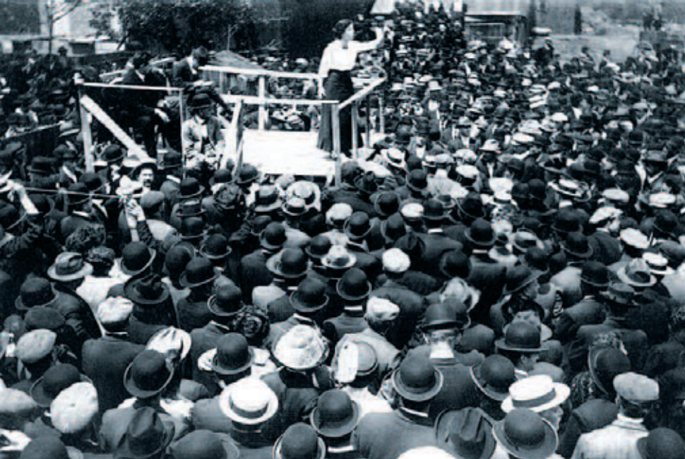
Η Ε.Γ. Flynn μιλά σε απεργιακή συγκέντρωση το 1913.

λο «Ο Καλιμπάν και η Μάγισσα, Γυναίκες, σώμα και πρωταρχική συσσώρευση» (Εκδόσεις των Ξένων). Η άποψη της Federici είναι ότι ο καπιταλισμός είναι το πιο πατριαρχικό σύστημα, ακόμα περισσότερο και από τη φεουδαρχία: «Η οικογένεια αναδύεται αυτή την περίοδο της πρωταρχικής συσσώρευσης σύστοιχο της αγοράς όργανο για τη μεταφορά των κοινωνικών σχέσεων από το δημόσιο στο ιδιωτικό και κυρίως ως μέσο αναπαραγωγής της καπιταλιστικής πειθαρχίας και της πατριαρχικής κυριαρχίας. Αλλά επιπλέον και ως ο πιο σημαντικός θεσμός για την οικειοποίηση και απόκρυψη της γυναικείας εργασίας» (σελ 139). Και πιο κάτω στις σελ 164-165, κάτω από τον υπότιτλο «Ο καπιταλισμός και ο έμφυλος καταμερισμός της εργασίας», υποστηρίζει ότι «η κατασκευή μιας νέας πατριαρχικής τάξης πραγμάτων, η οποία μετέτρεψε τις γυναίκες σε υπηρέτριες του αντρικού εργατικού δυναμικού, αποτέλεσε σημαντικό όπλο της καπιταλιστικής ανάπτυξης... Αυτός ο καταμερισμός εργασίας, όπως ακριβώς και ο διεθνής καταμερισμός εργασίας, ήταν πάνω από όλα μια σχέση εξουσίας που διαιρούσε το εργατικό δυναμικό και παράλληλα έδινε τεράστια ώθηση στη συσσώρευση του κεφαλαίου». Και πιο κάτω υποστηρίζει ότι: «οι άντρες εργάτες έχουν συχνά υπάρξει συνένοχοι σ' αυτή τη διαδικασία καθώς προσπάθησαν να διατηρήσουν τη δύναμη τους σε σχέση με το κεφάλαιο, υποτιμώντας και πειθαρχώντας τις γυναίκες, τα παιδιά και τους αποικιοκρατούμενους πληθυσμούς» (σελ 165).