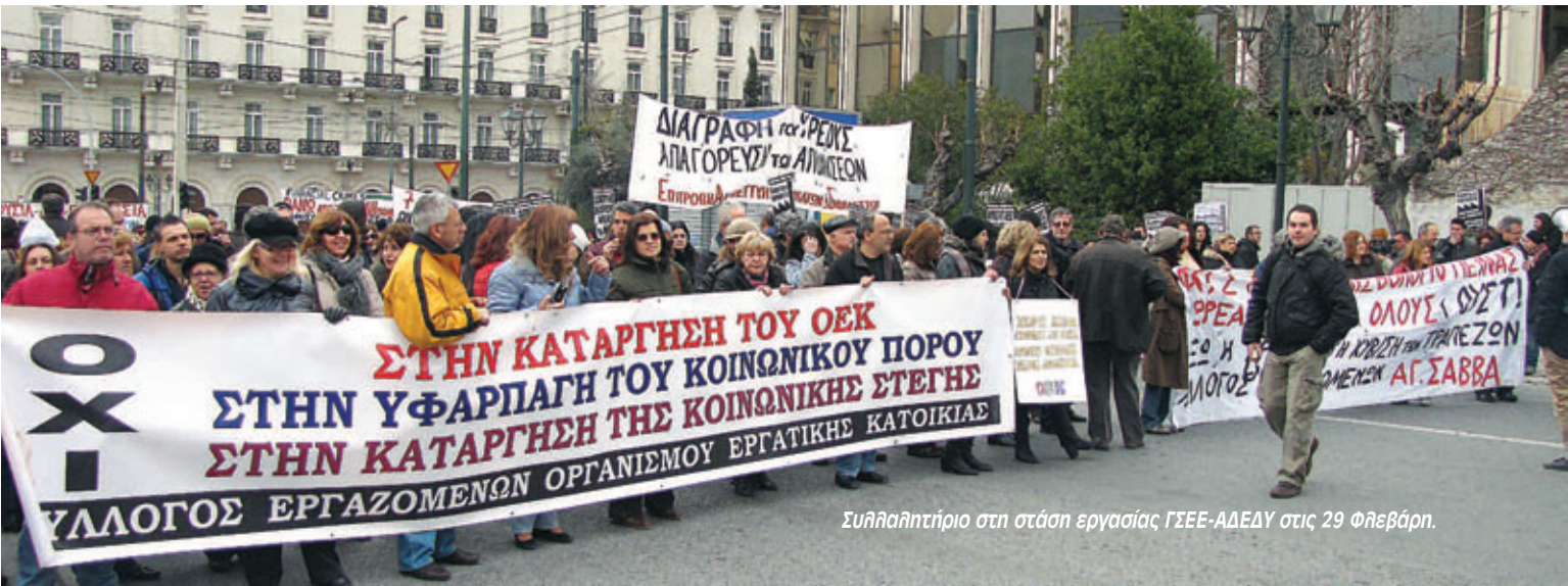
Συλλαλητήριο στη στάση εργασίας ΓΣΕΕ-ΑΔΕΔΥ στις 29 Φλεβάρη.

Σε πολλούς χώρους αυτή η διαδικασία είναι πιο ορατή και συγκροτημένη με την λειτουργία απεργιακών επιτροπών, επιτροπών αγώνα, εργασιακών επιτροπών – οι ονομασίες μπορεί να ποικίλουν αλλά η ουσία τους είναι η ίδια. Σε μια σειρά νοσοκομεία οι απεργιακές επιτροπές που έπαιξαν τόσο σημαντικό ρόλο τον προηγούμενο Οκτώβρη συνεχίζουν να υπάρχουν και να δίνουν μάχες. Σε πολλά ΜΜΕ υπάρχουν τέτοιες επιτροπές, εκλεγμένες πολλές φορές από τις συνελεύσεις στην Ελευθεροτυπία, στον ΔΟΑ, στο Αιτερ, στον Κόσμο του Επενδυτή. Οι εργαζόμενοι της Ελευθεροτυπίας – σε απεργία διαρκείας από τον Δεκέμβρη – έχουν προχωρήσει στην έκδοση δυο απεργιακών φύλλων. Στον Αιτερ, παρά τη λυσσασμένη αντίδραση της εργοδοσίας, οι εργαζόμενοι έχουν κάνει απεργιακές εκπομπές δίνοντας μια πρόγευση του πόσο πραγματική ενημέρωση μπορεί να εξασφαλίσει ο εργατικός έλεγχος στα “κάστρα” των διαπλεκόμενων βαρώνων των ΜΜΕ. Κρατάνε τόσους μήνες, με την συμπαράσταση του εργατικού κινήματος. Όταν για παράδειγμα τα δικαστήρια αποφάσισαν να διακοπεί το ρεύμα, οι συνδικαλιστές της ΓΕΝΟΠ έπεισαν το συνεργείο που είχε πάει να μην το κόψει.