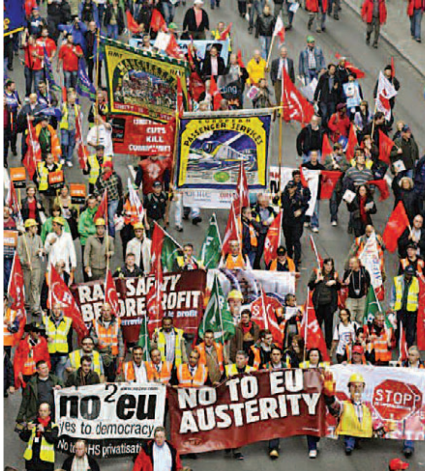
Πανευρωπαϊκή διαδήλωση συνδικάτων στις Βρυξέλλες, Σεπτέμβρης 2010. Το πανό γράφει: "Όχι στην λιτότητα της ΕΕ".

Τέλος, στην πάλη ενάντια στις αντιδημοκρατικές εκτροπές, η Αριστερά και το εργατικό κίνημα δεν έχουν κανένα λόγο