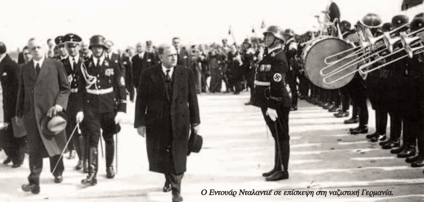
Ο Εντουάρ Νταλαντιέ σε επίσκεψη στη ναζιστική Γερμανία.

τας» της γαλλικής οικονομίας, προχώρησε σε υποτίμηση του φράγκου κατά 25% και ο πληθωρισμός ανέβηκε κατά 50% μέχρι τα τέλη του 1937.