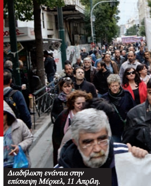
Διαδήλωση ενάντια στην επίσκεψη Μέρκελ, 11 Απριλίου.

Κατ' αρχάς είναι τεράστιο ψέμα ότι πρόκειται για άχρηστες υπηρεσίες. Ο ΕΟΠΥΥ που έκλεισε, είναι η βασική πρωτοβάθμια περίθαλψη για εκατομμύρια εργαζόμενους και συνταξιούχους. Η επαγγελματική εκπαίδευση που ρημάχτηκε, είναι τα σχολεία των παιδιών από τις φτωχότερες οικογένειες. Ο ΟΑΕΔ και οι υπηρεσίες του υπ. Εργασίας που υπολειπονται, τυπικά είναι αυτές