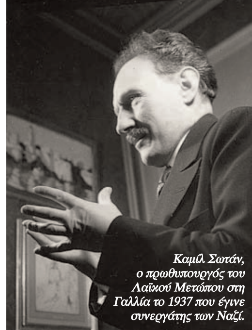
Καμίλ Σωτάν, ο πρωθυπουργός του Λαϊκού Μετώπου στη Γαλλία το 1937 που έγινε συνεργάτης των Ναζί.

Η στρατηγική της εξόδου από την κρίση μέσα από την κατάκτηση μιας κυβέρνησης της Αριστεράς δεν είναι νέα