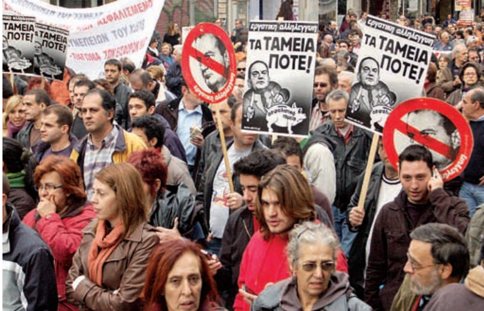
Πανεργατική ενάντια στο ασφαλιστικό νομοσχέδιο το χειμώνα 2007 - 2008.

Όποια κόμματα ή οργανώσεις της αριστεράς δεν κατάφεραν να καταλάβουν τη σημασία αυτού του κύματος, έμειναν έξω από ένα καινούριο κίνημα που έπαιξε σημαντικό ρόλο στη ριζοσπαστικοποίηση που βλέπουμε σήμερα. Το ότι το ΣΕΚ πήρε την πρωτοβουλία μαζί με άλλους αγωνιστές να δημιουργήσουν την κίνηση ENANTIA που στη συνέχεια έπαιξε ρόλο στη δημιουργία της ANΤΑΡΣΥΑ, έχει τις ρίζες του σε εκείνη την περίοδο, στα μεγάλα αντιπολεμικά συλλαλητήρια και στο σύνθημα «Οι άνθρωποι πάνω από τα κέρδη».