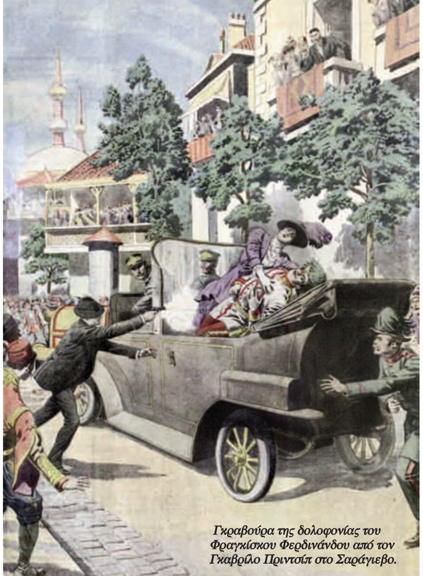
Γκαβούρα της δολοφονίας του Φραγκίσκου Φερδινάνδου από τον Γκαβρίλο Πριντσιπ στο Σαράγιεβο.

Το μεγαλύτερο πρόβλημα το είχε η Βρετανία – η κυριότερη ναυτική δύναμη της εποχής της. Το 1911 το βρετανικό πολεμικό ναυτικό χρησιμοποιούσε ακόμα κάρβουνο για να κινεί τα πλοία του – παρά τα προφανή πλεονεκτήματα του πετρελαίου (ήθελε πολύ λιγότερο χώρο, η καύση του ήταν πιο καθαρή και η απόδοσή του πολύ μεγαλύτερη). Υπήρχε όμως και ένα σοβαρό μειονέκτημα: η Βρετανία είχε ανθρακωρυχεία. Αλλά δεν είχε πετρελαιοπηγές. Στροφή στο πετρέλαιο θα σήμαινε εξάρτηση από τις εισαγωγές – πράγμα που θεωρούσαν απαράδεκτο οι αξιωματούχοι. Ούτε μπορούσαν, όμως, να μείνουν πίσω, αφού αυτό θα έφερνε τον στόλο της σε μειονεκτική θέση σε σχέση με τους ανταγω-