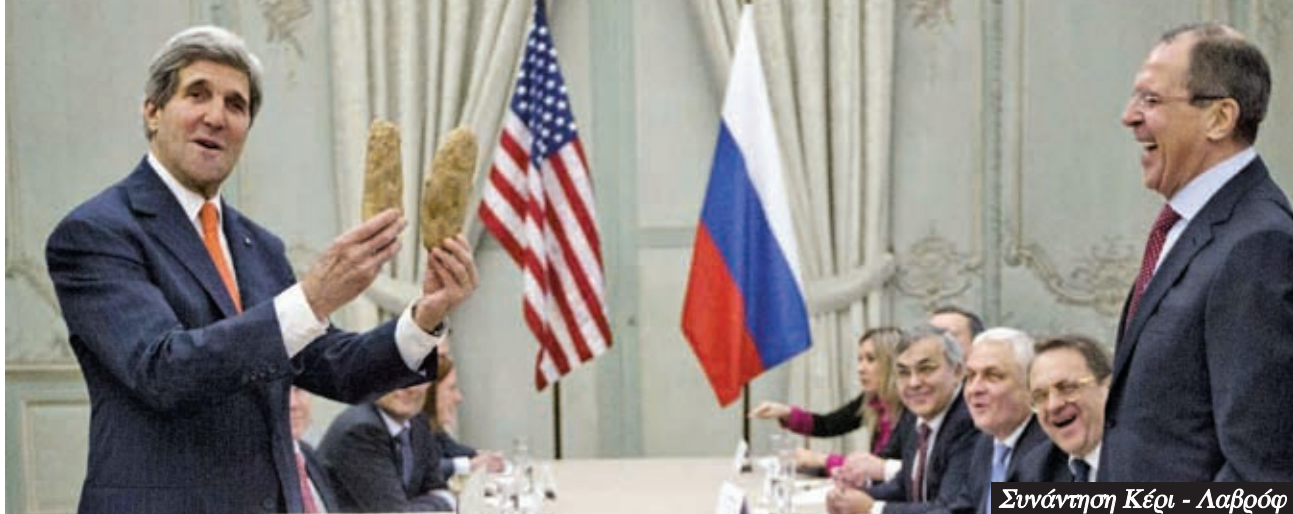
Συνάντηση Κέρι - Λαβρόφ

Σήμερα η Μόσχα είναι η «προτεύουσα» των δισεκατομμυριούχων παγκοσμίως, μπροστά κι από τη Νέα Υόρκη (84 με περιουσία 366 δις δολαρίων έναντι 62 με 280 δις δολάρια). 7 Αυτοί όμως δεν θα υπήρχαν χωρίς τους γίγαντες της βιομηχανίας που είχαν χτιστεί επί κρατικού καπιταλισμού και έμειναν στα χέρια των «σοβιετικών» διευθυντών και «τεχνοκρατών» που τις διαχειρίζονταν.