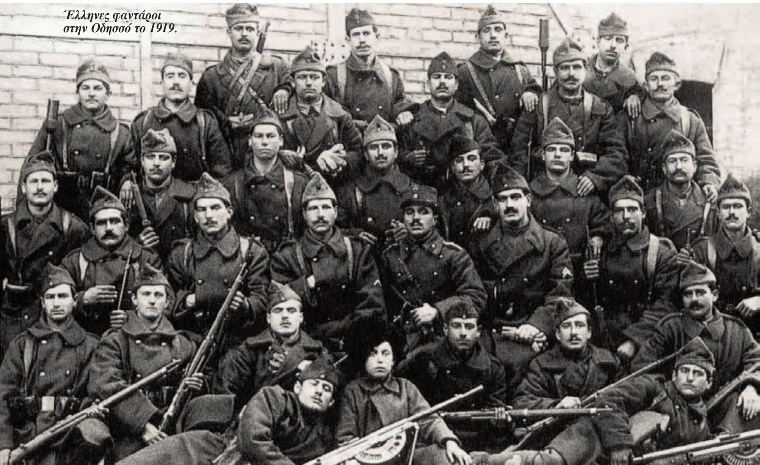
Έλληνες φαντάροι στην Οδησό το 1919.

Οι ιμπεριαλιστικές κυβερνήσεις χρησιμοποίησαν καταρχήν το όπλο του οικονομικού αποκλεισμού. Ενίσχυσαν πλουσιοπάροχα με οπλισμό, πυρομαχικά και άλλα εφόδια τους αντεπαναστατικούς στρατούς των «Λευκών». Παράλληλα, στρατιωτικά τμήματα από 14 χώρες συμμετείχαν σε διάφορες στιγμές στις εκστρατείες ενάντια στη σοβιετική εξουσία. Από την Βρετανία (με τη συμμετοχή τμημάτων από Καναδά, Αυστραλία και Ινδία), τη Γαλλία, τις ΗΠΑ, την Ιαπωνία, την Τσεχοσλοβακία, την Ρουμανία, την Πολωνία, την Ελλάδα, την Σερβία, την Ιταλία και την Κίνα. Στις αρχές του 1919, τη στιγμή της κορύφωσης της ιμπεριαλιστικής επέμβασης περίπου 180 χιλιάδες στρατιώτες αυτών των χωρών βρισκόταν στο έδαφος της Ρωσίας. 1