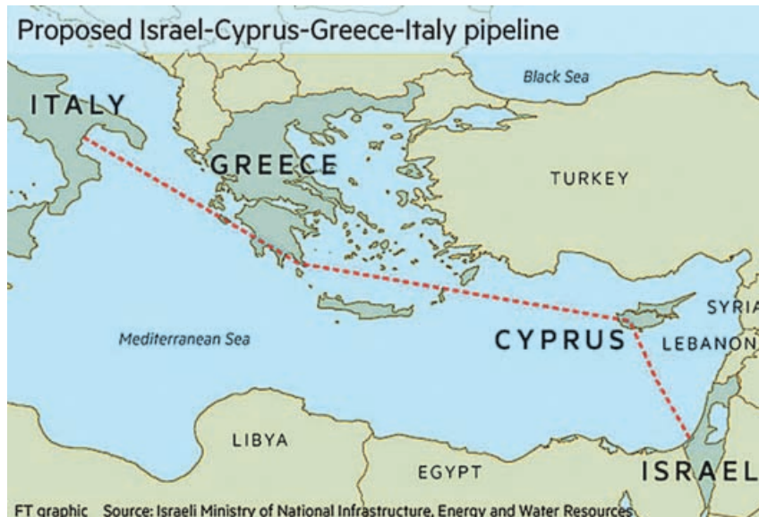
Το σχέδιο για τον αγωγό φυσικού αερίου από το Ισραήλ και την Κύπρο στην Ελλάδα και την Ιταλία.

Βασικός πυλώνας της συμμαχίας ενάντια στο Κατάρ (στην ουσία ενάντια στο Ιράν) δίπλα στη Σαουδική Αραβία ήταν η Αίγυπτος. Στις διμερείς συναντήσεις που είχε ο Τραμπ στα πλαίσια της ομιλίας του στη Σύνοδο του Ριάντ, ο Τραμπ συναντήθηκε για δεύτερη φορά με τον Σίσι που χαρακτήρισε « Φίλο, άνθρωπο με μοναδική προσωπικότητα,