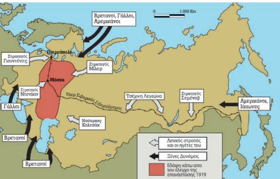
Η αντεπανάσταση και η ιμπεριαλιστική επέμβαση το 1919.