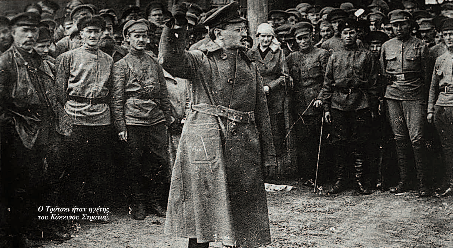
Ο Τρότσκι ήταν ηγέτης του Κόκκινου Στρατού.

λονταριστική δράση λίγων “φωτισμένων” που τρέχουν να υποκαταστήσουν την κίνηση των μαζών.