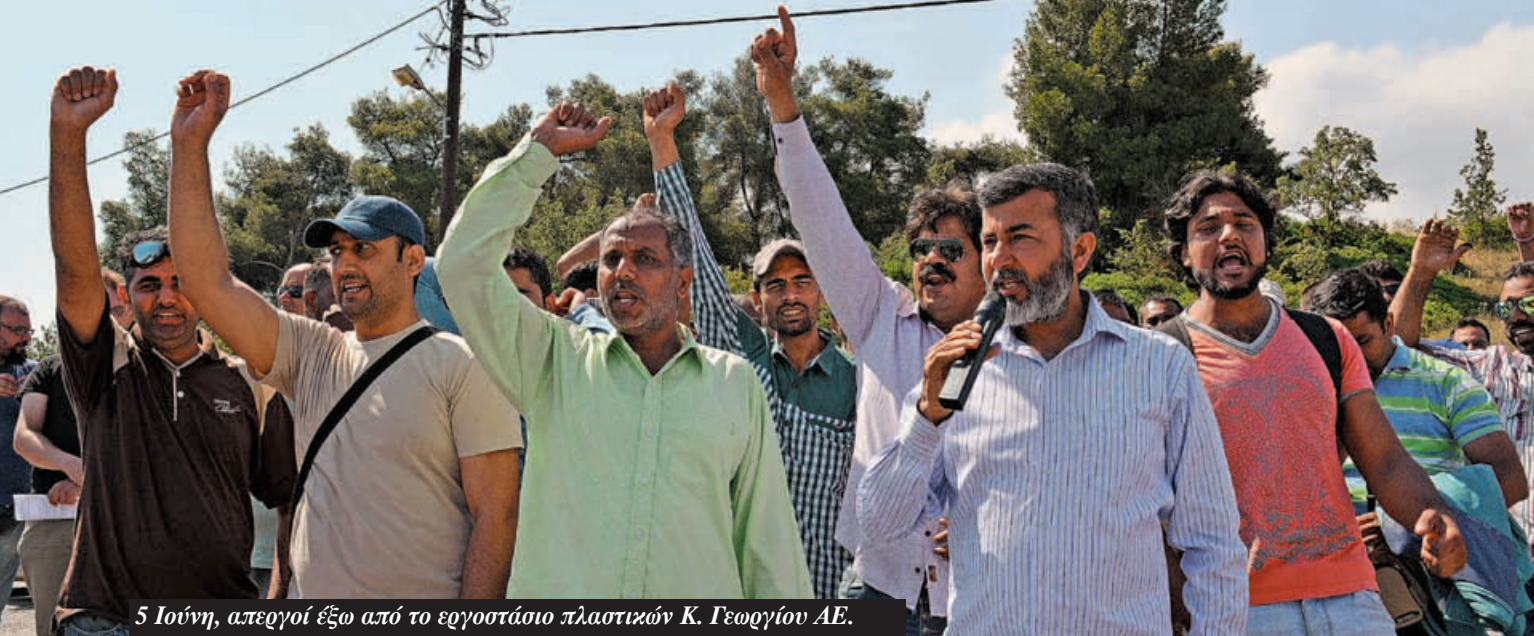
5 Ιούνη, απεργιοί έξω από το εργοστάσιο πλαστικών Κ. Γεωργίου ΑΕ.

νόταν συνεχώς. Έπρεπε να έρθουν διπλές εκλογές τον Μάη και τον Ιούνιο του 2012 για να φέρουν στην επιφάνεια τις τεράστιες αλλαγές που είχαν γίνει. Τον Μάη του 2012 Ν.Δ. και ΠΑΣΟΚ κατέρρευσαν στο 32%. Στο δεύτερο γύρο τον Ιούνιο, πήραν μαζί 42% (Ν.Δ. 29,66 και ΠΑΣΟΚ 12,28).