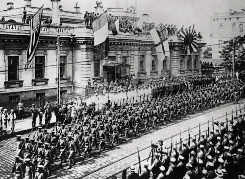
Βλαδιβοστόκ 1918. Κοινή παρέλαση Γιαπωνέζων, Αμερικάνων και Βρετανών, στην αρχή της ιμπεριαλιστικής επέμβασης.

πόητος! Ζήτω ο παγκόσμιος κομμουνισμός!». 16