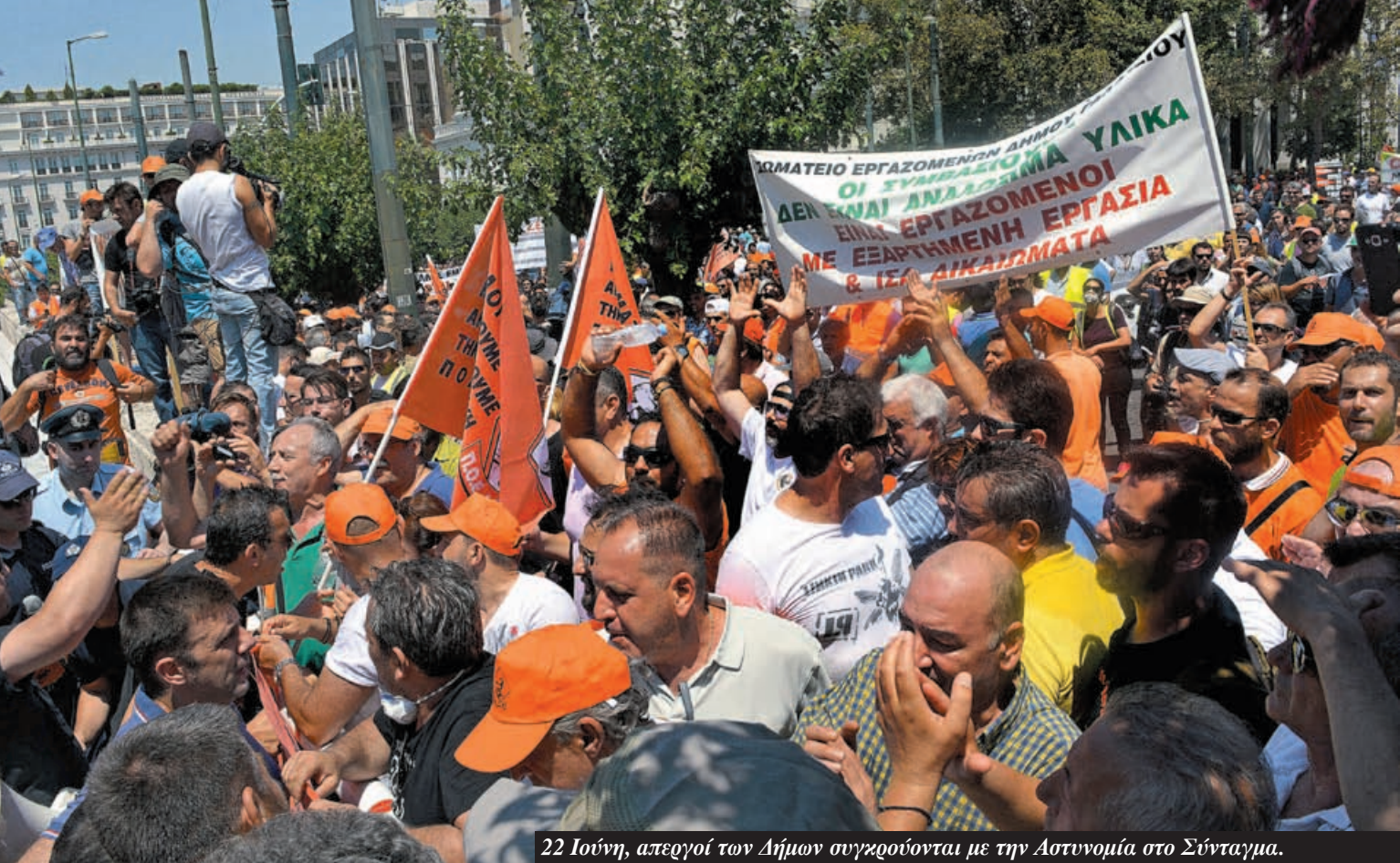
22 Ιούνη, απεργιοί των Δήμων συγκρούονται με την Αστυνομία στο Σύνταγμα.