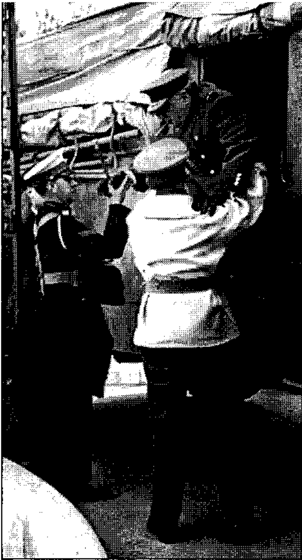
Ο Τσώρτσιλ φτάνει στην Αθήνα

τιά. Ήρθαν οι Αγγλοι. Αρχισαν να μας κτυπούν από παντού. Τα όπλα μας ήταν παλιά. Απ' την στιγμή που οι Αγγλοι μπήκαν στο Πολυτεχνείο σκοτώθηκαν πολλά παιδιά". 6