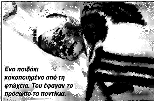
Ένα παιδάκι κακοποιημένο από τη φτώχεια. Του έφαγαν το πρόσωπο τα ποντίκια.

Οι πραγματικές διαστάσεις του προβλήματος αποκαλύπτονται από τις στατιστικές που αποδεικνύουν ότι η οικογένεια είναι το πιο επικίνδυνο μέρος για τις γυναίκες και τα παιδιά: Ξυλοδαρμοί