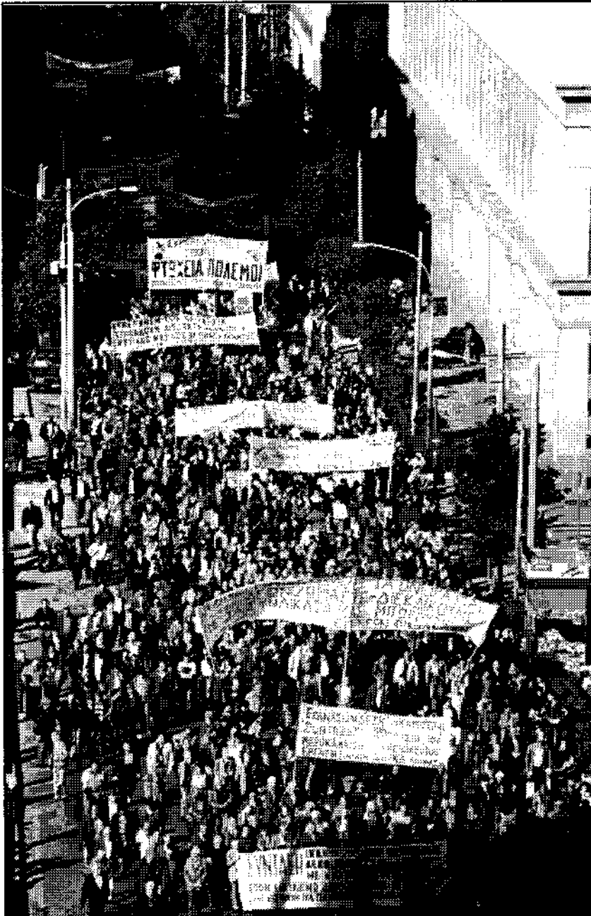
Η Πανεργατική διαδήλωση στις 14 Δεκέμβρη

που μπορεί να ταρακουνήσει το σύστημα και να ξαποστείλει τους πραιτωριανούς του. Ενάμιση εκατομμύριο διαδηλωτές στη Ρώμη στις 12 Νοέμβρη, η μεγαλύτερη εργατική διαδήλωση, έστειλαν το μήνυμα ότι ο Μπερλουσκόνι και οι φασίστες σύμμαχοι του πρέπει να φύγουν πριν καν κλείσουν ένα χρόνο στην εξουσία, ίσως πριν κλείσει η χρονιά.