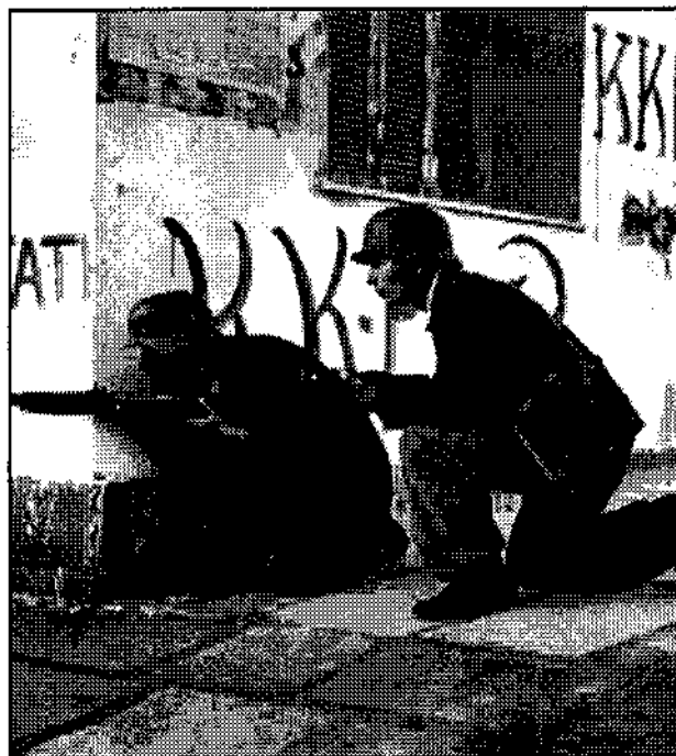
Μαχητές του ΕΛΑΣ στην Αθήνα

Η γενική απεργία συνεχιζόταν, τίποτα δεν κινούνταν. Δεκάδες