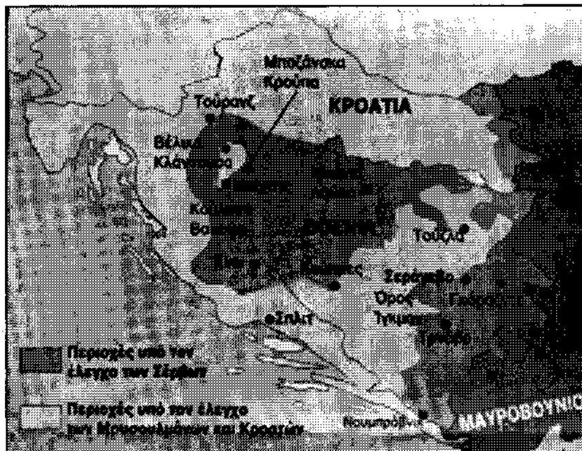
Χάρτης που δείχνει τις περιοχές που έχει καταλάβει ο Κάρατζιτς και αντιστοιχούν στο 70% της Βοσνίας

Όμως, ούτε από τη νέα φάση των ιμπεριαλιστικών μεθοδεύσεων λείπουν οι α-