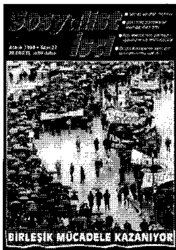
Πρόσφατο εξώφυλλο του περιοδικού "Σοσιαλιστής Εργάτης"

Ένα χαρακτηριστικό παράδειγμα είναι ο έλεγχος του υδάτινου δυναμικού της περιοχής. Μια από τις στρατηγικές του Τουρκοκώτ Οζάλ στη δεκαετία του '80 ήταν η χρησιμοποίηση των υερών των βουνών του Κουρδιστάν σαν στρατηγικό μέσο πίεσης