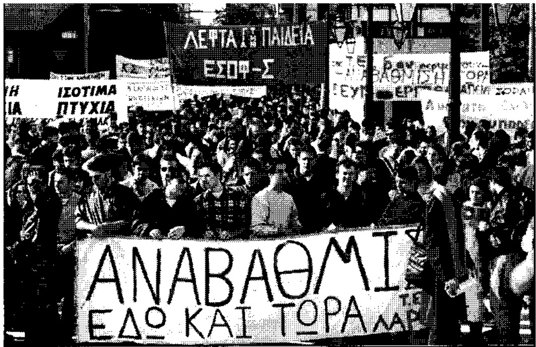
Από την πανελλαδική διαδήλωση των ΤΕΙ στις 22 Νοέμβρη

* Την Τετάρτη 30/11 στην Αθήνα και την Θεσσαλονίκη γίνεται η πρώτη κοινή διαδήλωση φοιτητών, σπουδαστών και μαθητών ενάντια στον προϋπολογισμό. Στην Αθήνα, η πορεία συναντά διαδήλωση των καθαριστριών στα σχολεία που απεργούν. Το σύνθημα “φοιτητές-εργατιά μια φωνή και μια γραφή” ενθουσιάζει τους διαδηλωτές και τον κόσμο στα πεζοδρόμια.