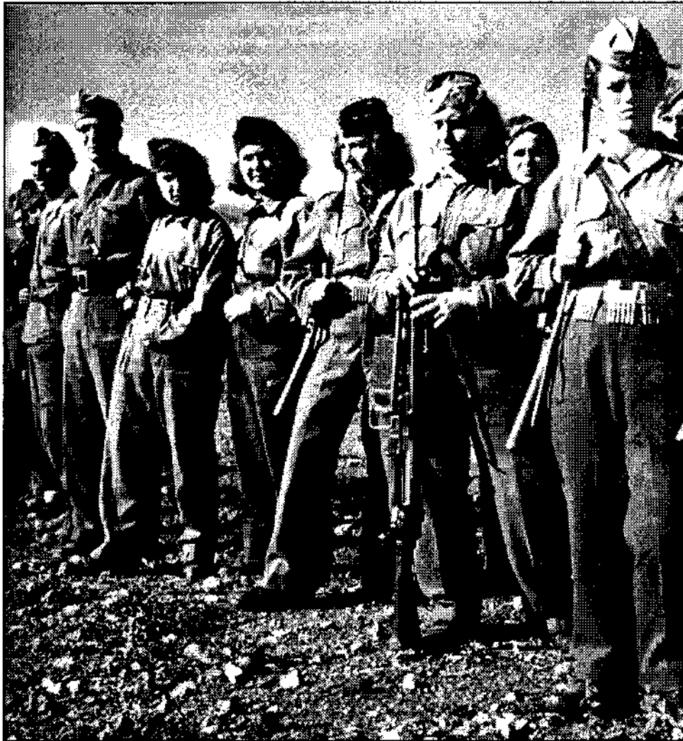
Μονάδα του ΕΛΑΣ που απαρτιζόταν κύρια από νέες γυναίκες