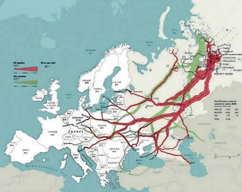
Η Ρωσία τροφοδοτεί την Ευρώπη με πετρέλαιο και φυσικό αέριο

κή υπεροχή της αμερικανικής οικονομίας αλλά χάρη στη συντριπτική υπεροχή της αμερικανικής στρατιωτικής μηχανής. Οι ΗΠΑ όμως έχασαν τον πόλεμο κατά της τρομοκρατίας. Το τελευταίο επεισόδιο «παίχτηκε» τον Αύγουστο με την άτακτη υποχώρηση των στρατιωτικών δυνάμεων των ΗΠΑ από το Αφγανιστάν και την παράδοση, άνευ όρων της εξουσίας, ύστερα από 20 χρόνια πολέμου στους Ταλιμπάν. Οι εικόνες αυτές έπαιξαν σίγουρα ρόλο στην απόφαση του Πούτιν να συγκεντρώσει δυνάμεις στα σύνορα με την Ουκρανία και να αποπειραθεί να δώσει μια στρατιωτική λύση στη διαμάχη.