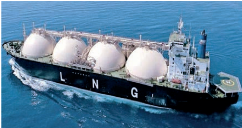
Οι εφοπλιστές επενδύουν σε δεξαμενόπλοια υγροποιημένου φυσικού αερίου