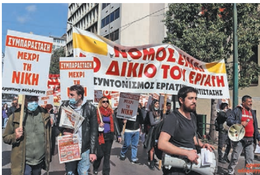
26/2, Το μπλοκ του Συντονισμού

Οι κινητοποιήσεις των τελευταίων ημερών του Φλεβάρη και της αρχής του Μάρτη επιβεβαιώνουν αυτή την εικόνα. Στις 23 Φλεβάρη οι απεργιοί των Νο-