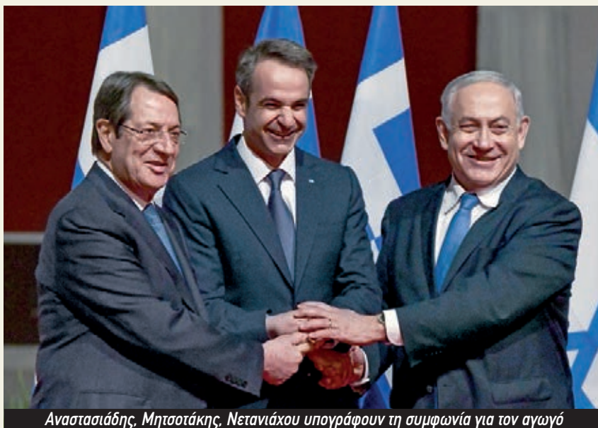
Αναστασιάδης, Μητσοτάκης, Νετανιάχου υπογράφουν τη συμφωνία για τον αγωγό

Όμως, στη σύγχρονη εποχή, υπήρχε μία έλλειψη σύνδεσης μεταξύ των χωρών μας. Αυτό όμως το διορθώσαμε, γιατί τώρα πλέον έχουμε ξεκινήσει αυτές τις διμερείς συναντήσεις μεταξύ μας. Αυτή είναι η έβδομη τριμερής συνάντηση. Είναι ιστορικής σημασίας, όμως, γιατί αυτό που κάνουμε αυτή τη στιγμή είναι ότι αναβαθμίζουμε τη συνεργασία μας σε ακόμα υψηλότερο επίπεδο για να προμηθεύσουμε με ενέργεια την Ευρώπη. Και θέλουμε να ενισχύσουμε, αυτά που είναι προς το κοινό μας συμφέρον”». 1