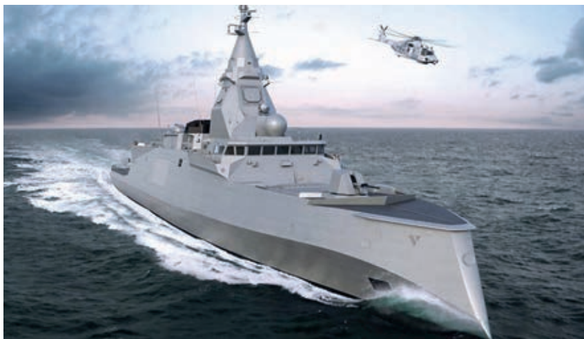
Η κυβέρνηση ξοδεύει δισεκατομμύρια για νέες φρεγάτες

δολάρια, η Pelham Capital που διαχειρίζεται 380 δισ. δολάρια και έχει αγοράσει το 4,7% της Energean, και η Kerogen Capital που έχει αγοράσει το 3,6%». 8