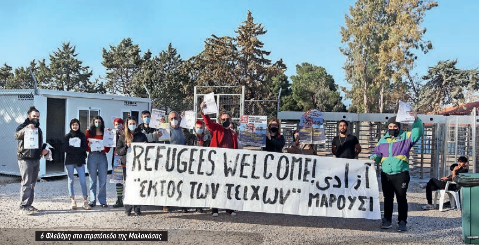
6 Φλεβάρη στο στρατόπεδο της Μαλακάσας

γραφεί από το ABR, 1.008 pushback που αφορούσαν 26.755 ανθρώπους. Οι πρακτικές είναι δολοφονικές: