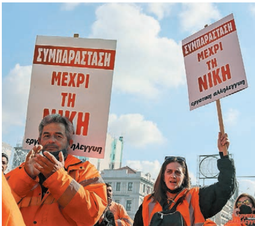
26/2. Οι απεργοί του Πρίνου με την πικέτα της Εργατικής Αλληλεγγύης

Η επαναστατική αριστερά, όμως, θυμάται και θυμίζει την παράδοση της ρή-