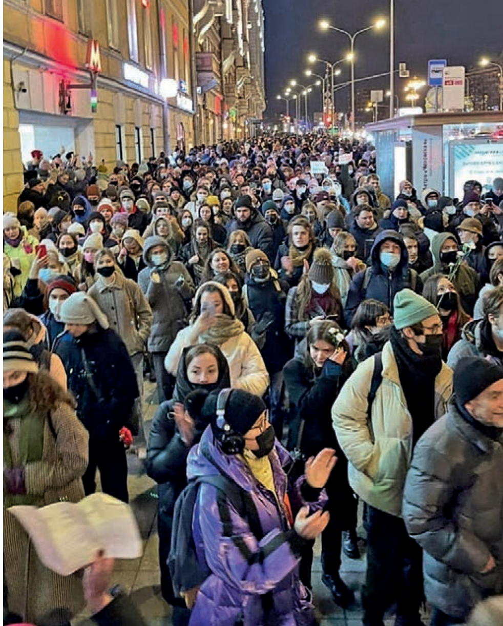
24/2, Αντιπολεμική διαδήλωση στην Πετρούπολη

Η Ουκρανία είναι μια από τις ελάχιστες χώρες του πλανήτη που είχαν συσσωρευτικά αρνητική ανάπτυξη μέσα στην περίοδο 1990-2017. Με άλλα λόγια το εθνικό ακαθάριστο προϊόν το 2017 ήταν μικρότερο από ότι ήταν 27 χρόνια πριν. Μόνο τρεις χώρες στο κόσμο έχουν να επιδείξουν χειρότερες επιδόσεις μέσα στην περίοδο αυτή: η Λαϊκή Δημοκρατία του Κονγκό, το Μπουρούντι και η Υεμένη. Η σιδηροβιομηχανία –το «ατού» παλαιότερα της ουκρανικής βιομηχανίας έχει μετατραπεί ύστερα από 30 χρόνια ληλασίας και εγκατάλειψης σε ένα φάντασμα του παλιού της εαυτού. Η αγροτική παραγωγή –η Ουκρανία έχει ένα από τα πιο εύφορα εδάφη στον κόσμο– καταφέρνει με δυσκολία να συντηρήσει τις αγροτικές οικογένειες (η απόδοση της γης είναι τρεις περίπου φορές χαμηλότερη από ότι στην Γερμανία και πέντε φορές μικρότερη από ότι στη Γαλλία). 1 Και πλάι – πλάι σε αυτή την ανείπωτη φτώχεια υπάρχει ο