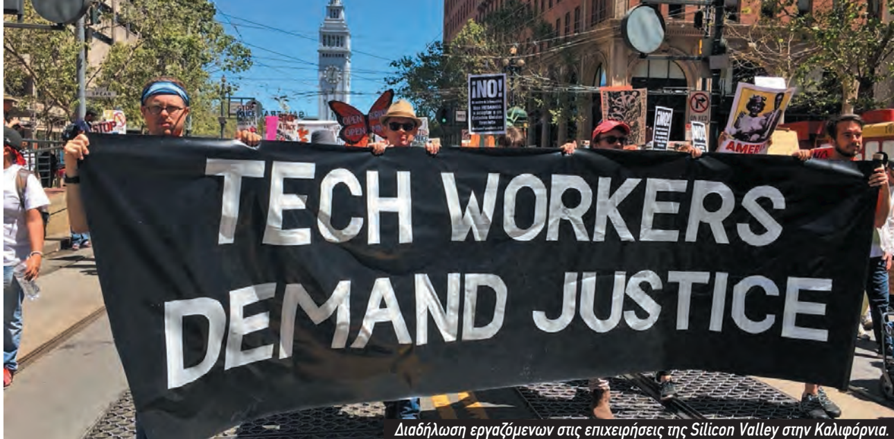
Διαδήλωση εργαζόμενων στις επιχειρήσεις της Silicon Valley στην Καλιφόρνια.

τα συστήματα μηχανικής μάθησης μπορούν να μάθουν τόσο ότι η γη είναι επίπεδη, όσο και ότι η γη είναι στρογγυλή. Αλιεύουν απλώς τις πιο συχνές φράσεις από τα δεδομένα, οι οποίες αλλάζουν με την πάροδο του χρόνου». 14