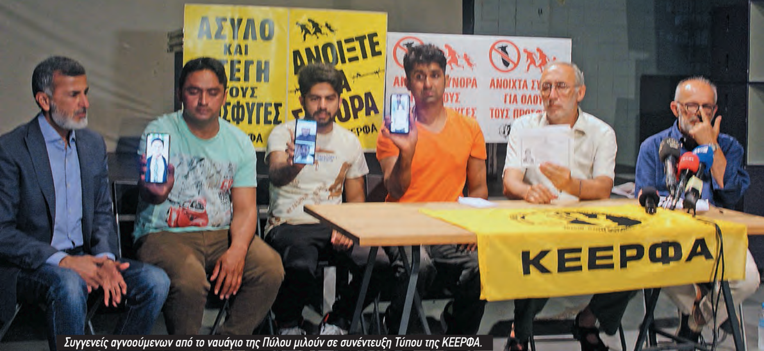
Συγγενείς αγνοούμενων από το ναυάγιο της Πύλου μιλούν σε συνέντευξη Τύπου της ΚΕΕΡΦΑ.

ύδατα για τα οποία υπεύθυνο για τη διάσωση ήταν το Ελληνικό Λιμενικό. Γι' αυτό άλλωστε βρέθηκε και εκεί. Και μόνο η φωτογραφία των ανθρώπων στο πλοίο από το ελικόπτερο, με σηκωμένα τα χέρια, φτάνει να αποδείξει ότι ζητούσαν απεγνωσμένα βοήθεια. Το επιβεβαιώνει η Nawal Soufi, που συνομιλούσε μαζί τους. Το επιβεβαίωσαν αυτό και οι ίδιοι οι επιζώντες.