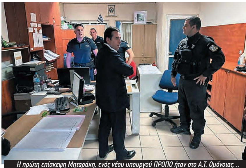
Η πρώτη επίσκεψη Μηταράκη, ενός νέου υπουργού ΠΡΟΠΟ ήταν στο Α.Τ. Ομόνοιας...