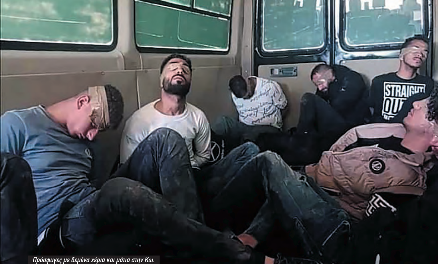
Πρόσφυγες με δεμένα χέρια και μάτια στην Κω.

δήλωσαν στα συλλαλητήρια που κατήγγειλαν το ρατσιστικό έγκλημα στην Πύλο σπάζοντας το υποκριτικό «τριήμερο πένθος» είναι η ζωντανή απόδειξη ότι το αντιρατσιστικό κίνημα είναι πιο μεγάλο και πολύ πιο μπροστά απ' ό,τι ήταν την δεκαετία του 1990 ή του 2000. Τα αντιρατσιστικά συλλαλητήρια αλληλεγγύης που έγιναν στην Ολλανδία, την Βρετανία, την Ιταλία, αυτά που προηγήθηκαν στην Γαλλία, και αυτά που θα ακολουθήσουν σε όλη την Ευρώπη, δείχνουν ότι είναι κομμάτι ενός διεθνούς κινήματος.