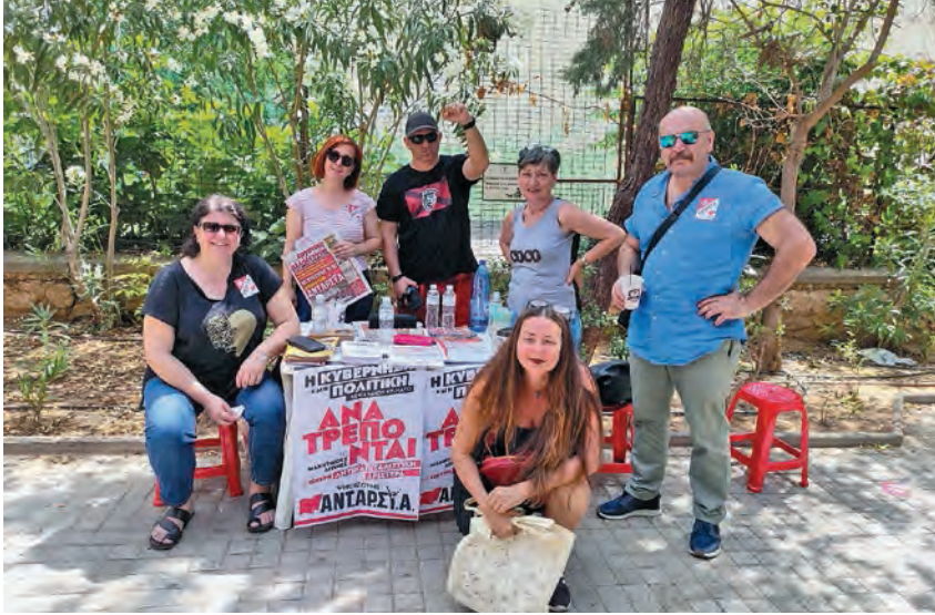
Εκλογική εξόρμηση της ΑΝΤΑΡΣΙΑ στη Νίκαια στις 25/6.

τήθηκαν από τον αγώνα για να ζήσουν. Στο χέρι της Αριστεράς είναι να βοηθήσει να βγουν στους δρόμους μαχητικά.