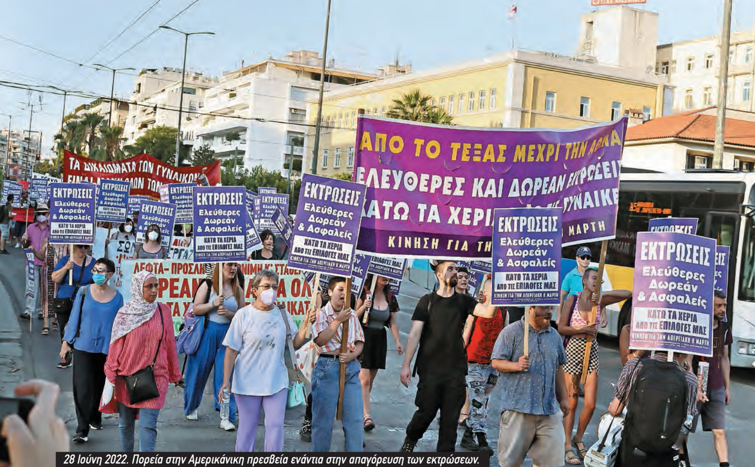
28 Ιούνη 2022. Πορεία στην Αμερικάνικη πρεσβεία ενάντια στην απαγόρευση των εκτρώσεων.

Μητσοτάκη στα αφεντικά. Προφανώς από όλη αυτή τη διαδικασία δεν κερδίζουν οι άντρες της εργατικής τάξης, αλλά ανοίγει ο δρόμος για την καταπάτηση των εργασιακών δικαιωμάτων όλων αντρών και γυναικών.