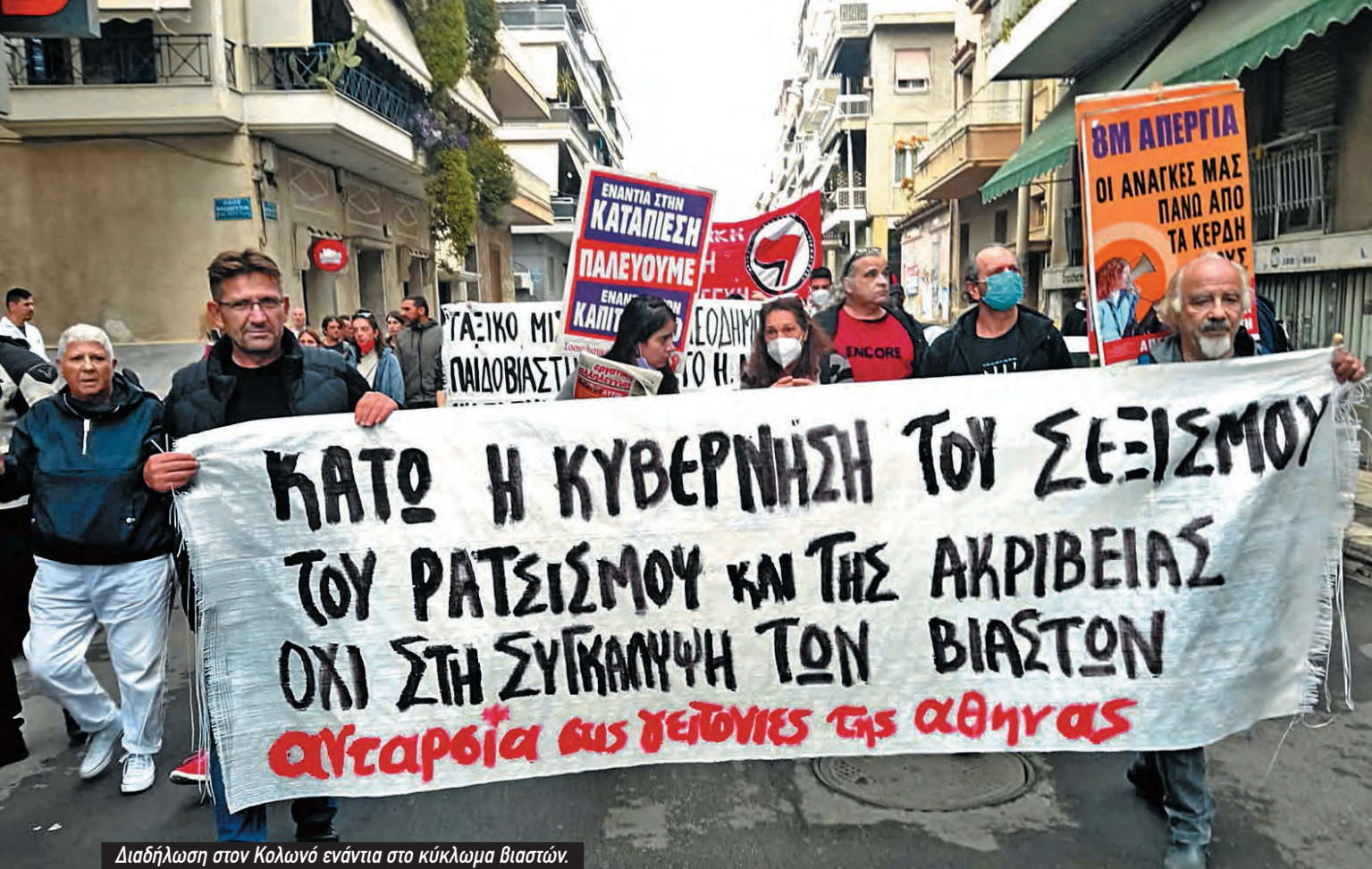
Διαδήλωση στον Κολωνό ενάντια στο κύκλωμα βιαστών.