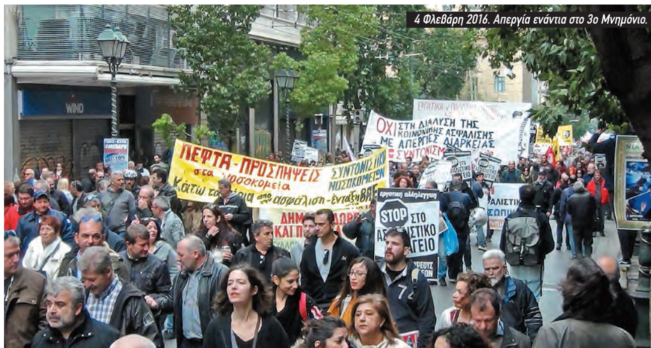
4 Φεβράρη 2016. Απεργία ενάντια στο 3ο Μνημόνιο.

Ο Λένιν προτείνει τη ρήξη με το σοσιαλδημοκρατικό μοντέλο του κόμματος