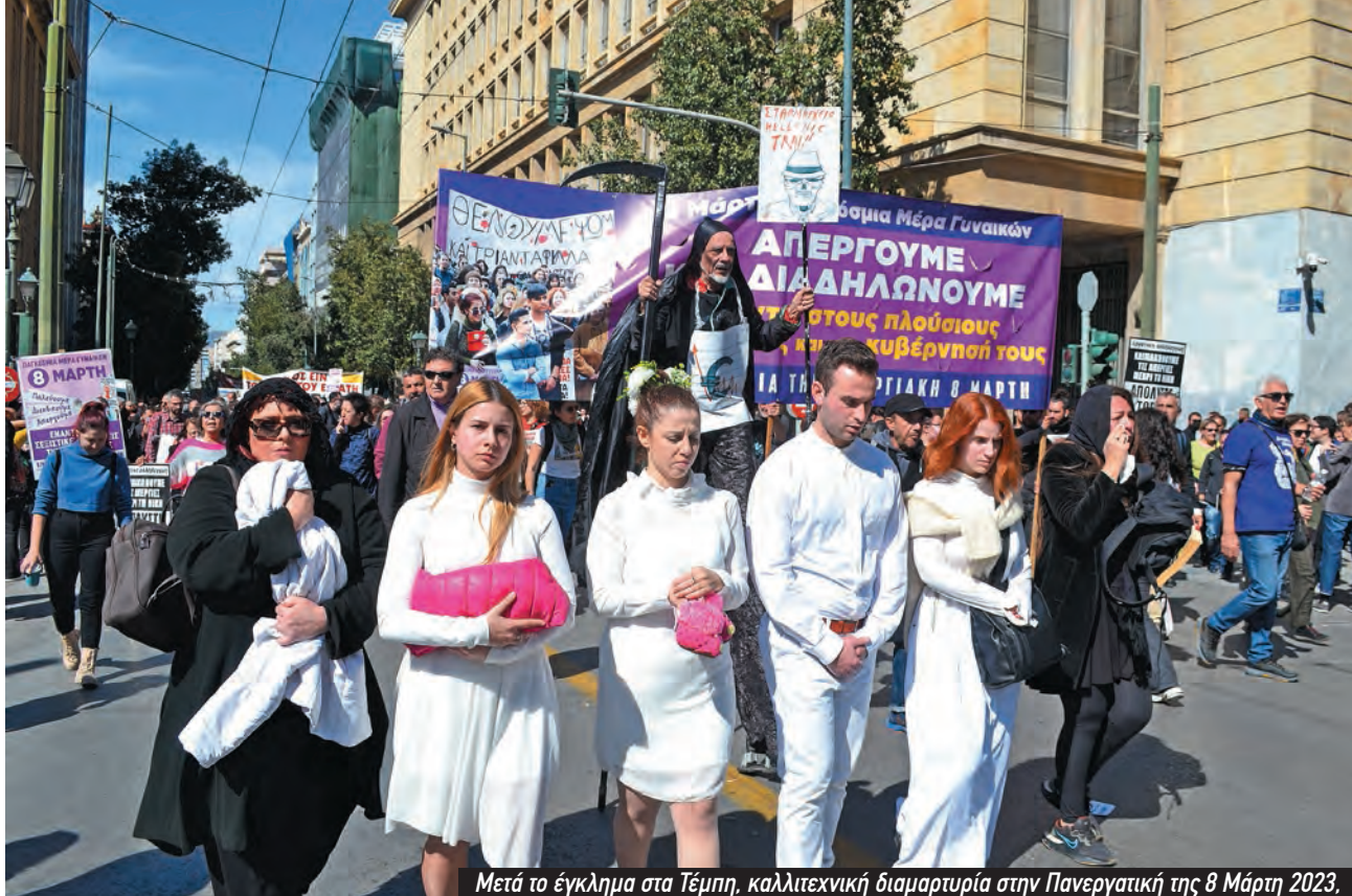
Μετά το έγκλημα στα Τέμπη, καλλιτεχνική διαμαρτυρία στην Πανεργατική της 8 Μάρτη 2023.

τιμωρητικές. Αλλά η απεργία είναι δικαίωμα αναφαίρετο και κατοχυρωμένο και δεν θα έπρεπε μια τέτοιου είδους επιχειρηματολογία να το αναιρεί. Δηλαδή αν πάμε σε έναν άλλο κλάδο, τον ερευνητικό για παράδειγμα, κι ένας ερευνητής που παίρνει μια υποτροφία αποφασίσει να απεργήσει, επιτρέπεται να έρθει το ΙΚΥ και να του πει δεν μου παρέδωσες, πλήρωνε; Κανείς δεν μπορεί να σου στερήσει το δικαίωμα να απεργήσεις πόσο μάλλον μία ρήτρα.