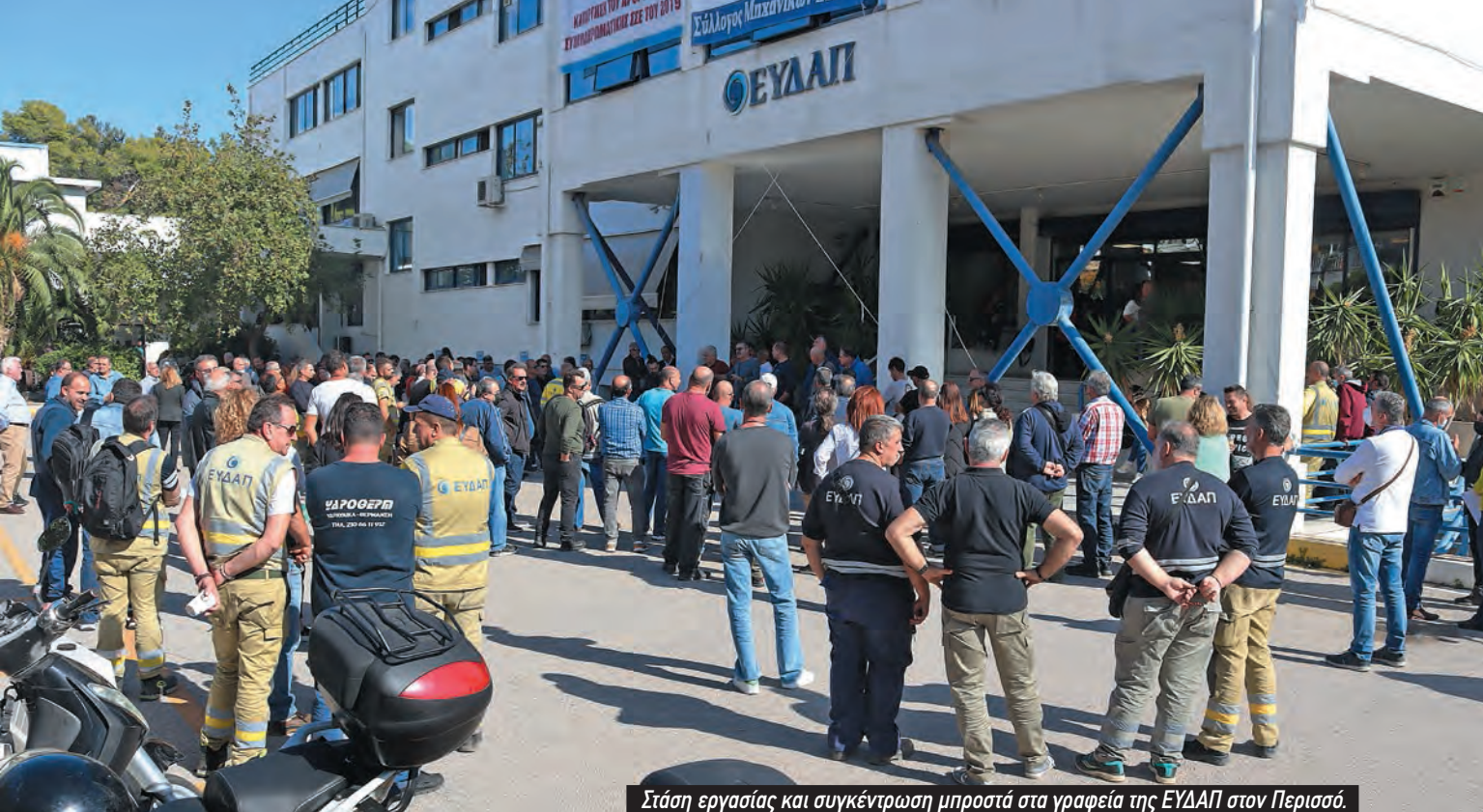
Στάση εργασίας και συγκέντρωση μπροστά στα γραφεία της ΕΥΔΑΠ στον Περιίσσο.