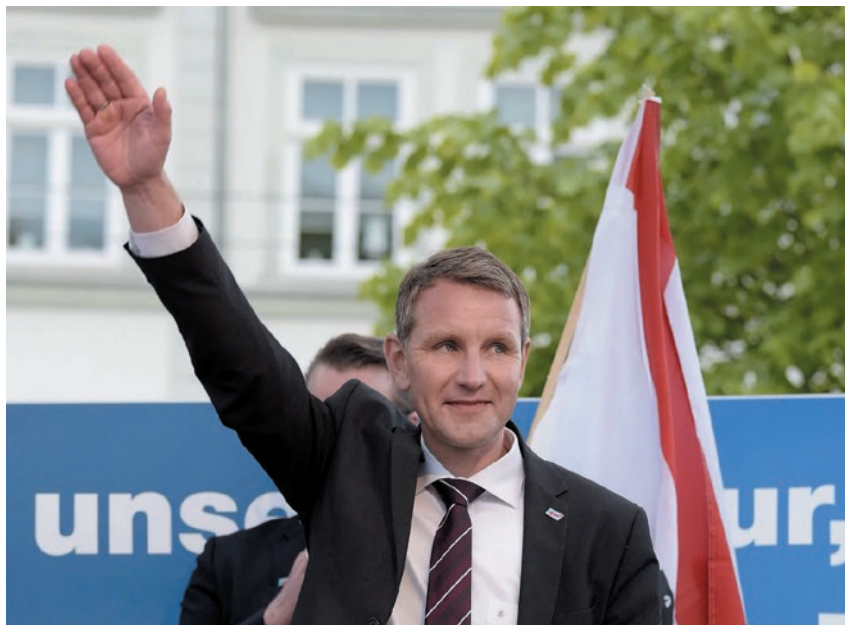
Ναζιστικός χαιρετισμός από ηγέτη του AfD.

Στο μεταξύ το κέντρο του κόμματος, στο Βερολίνο, λειτουργεί ως “μοντέρνα” βιτρίνα. Έχει δύο συμπεδέρους, έναν