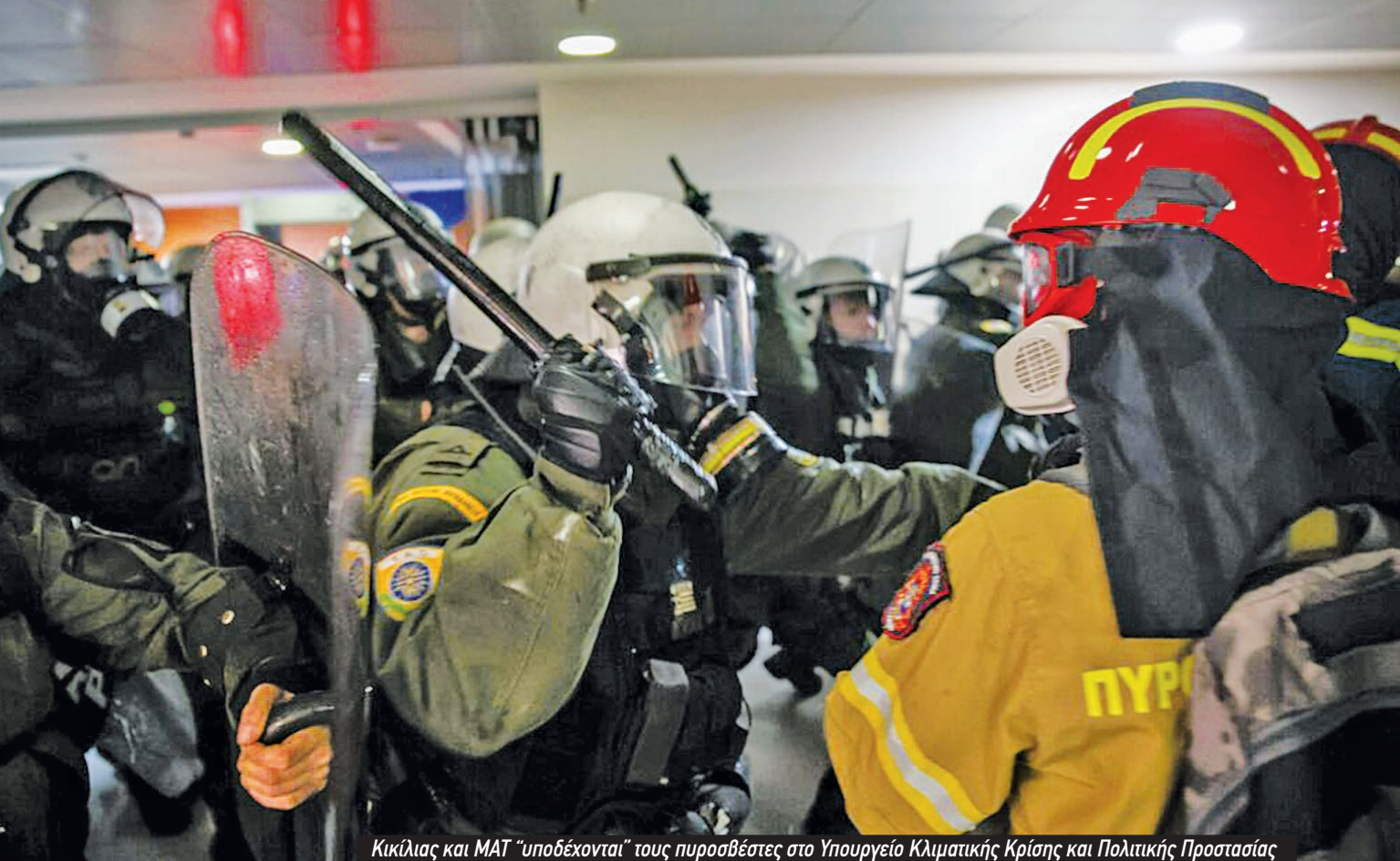
Κικίλιας και ΜΑΤ "υποδέχονται" τους πυροσβέστες στο Υπουργείο Κλιματικής Κρίσης και Πολιτικής Προστασίας