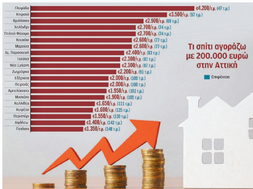
Διάγραμμα στην εφημερίδα "Καθημερινή" για το κόστος αγοράς κατοικίας στην Αττική.

Μεταπολεμικά, κάτω από την πίεση και την αγανάκτηση της εργατικής τάξης από τις συνθήκες του πολέμου αλλά και λόγω της μεγάλης άνθησης που χαρακτήριζε το σύστημα εκείνη τη περίοδο, τα κράτη διεθνώς όπως και στην Ελλάδα αναλαμβάνουν ένα τμήμα της στεγαστικής εργατικής τάξης. Τότε δημιουργείται ο Οργανισμός Εργατικής Κατοικίας (ΟΕΚ) που ως ιδρυτικό σκοπό του έχει την παροχή στέγης σε οικονομικά ασθενέστερα στρώματα. Ο Οργανισμός, μαζί με το Υπουργείο Δημοσίων Έργων που συνεχίζει να καλύπτει τις ανάγκες των προσφυγικών πληθυσμών, θα αποτελέσουν τους δύο μεγάλους κρατικούς φορείς παροχής στέγης την περίοδο αυτή. Οι πόροι του προέρχονταν από τις εισφορές των ιδίων των εργαζομένων (1% επί των αποδοχών τους) και των εργοδοτών τους (0,75%). Πάνω από 363.000 οικογένειες βοηθήθηκαν για να βρουν κατοικία, σε 56.000 παραχωρήθηκε έτοιμη κατοικία, σε 184.000 δόθηκε στεγαστικό δάνειο ή ανέγερσης κατοικίας και 123.000 έλαβαν δάνειο επισκευής. 5