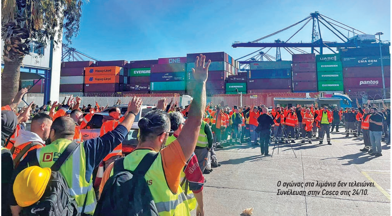
Ο αγώνας στα λιμάνια δεν τελειώνει. Συνέλευση στην Cosco στις 24/10.

που η κοινωνία φτάνει σε επαναστατική κρίση και η εργατική τάξη επιχειρεί την «έφοδο στον ουρανό», τα χαρακτηριστικά που έρχονται στο προσκήνιο είναι η συλλογικότητα και η δημοκρατική λειτουργία των νέων μορφών οργάνωσης που φέρνει η εργατική τάξη μέσα από τον ξεσηκωμό της. Από την Παρισινή Κομμούνα και τα εργατικά συμβούλια της Ρώσικης επανάστασης μέχρι τον «διευρυμένο» Μάη του 1968 και τις εκρήξεις του νέου αιώνα, η κοινωνική αλλαγή που κουβαλάει η εργατική τάξη όταν επαναστατεί παραμένει θεμέλιο για την Αριστερά που αναζητάει ανατρεπτική στρατηγική.