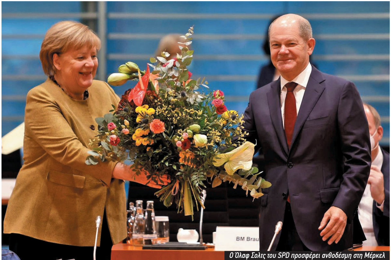
Ο Όλαφ Σολτς του SPD προσφέρει ανθοδέσμη στη Μέρκελ

την αλήθεια για το ποιος φταίει. Να μιλήσει και να οργανώσει ενάντια στους πλούσιους και τον καπιταλισμό.