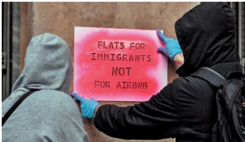
«Διαμερίσματα για μετανάστες, όχι για AIRBNB»

Ταυτόχρονα υπάρχει ήδη ένας αγώνας που δίνεται μεμονωμένα στις γειτονιές με επιτροπές κατοίκων που αντιδρούν και συγκροούνται με την αύξηση των ενοικίων και τον εξευγενισμό των γειτονιών. Αυτό που χρειάζεται είναι αυ-