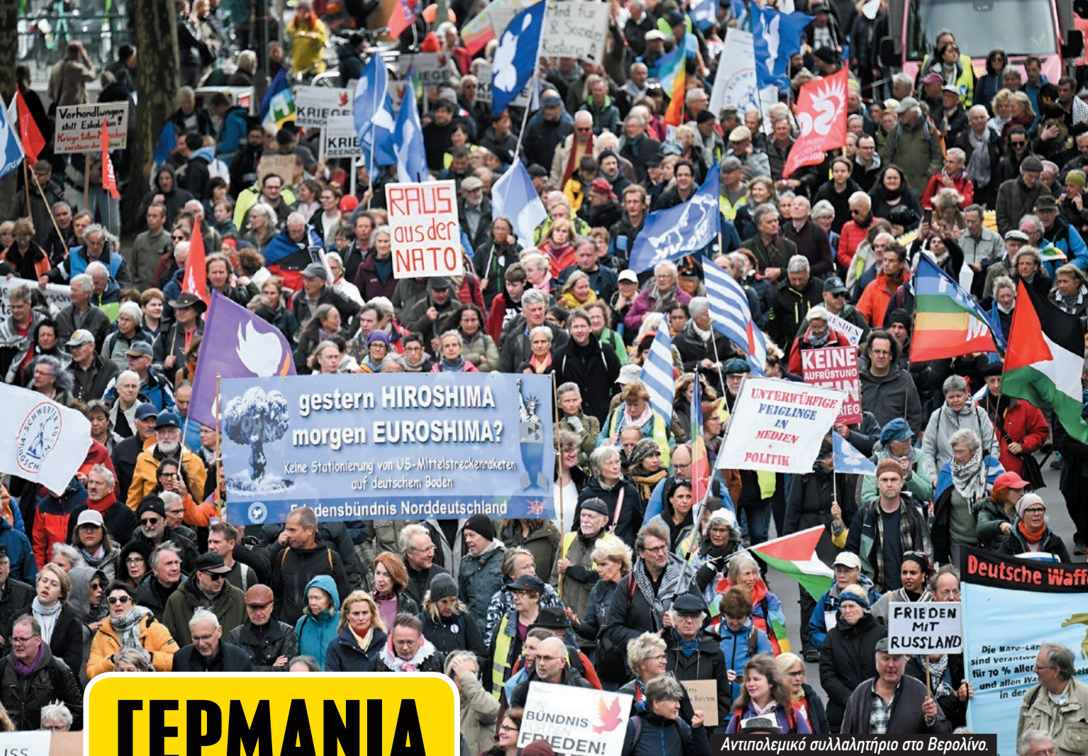
Αντιπολεμικό συλλαλητήριο στο Βερολίνο.