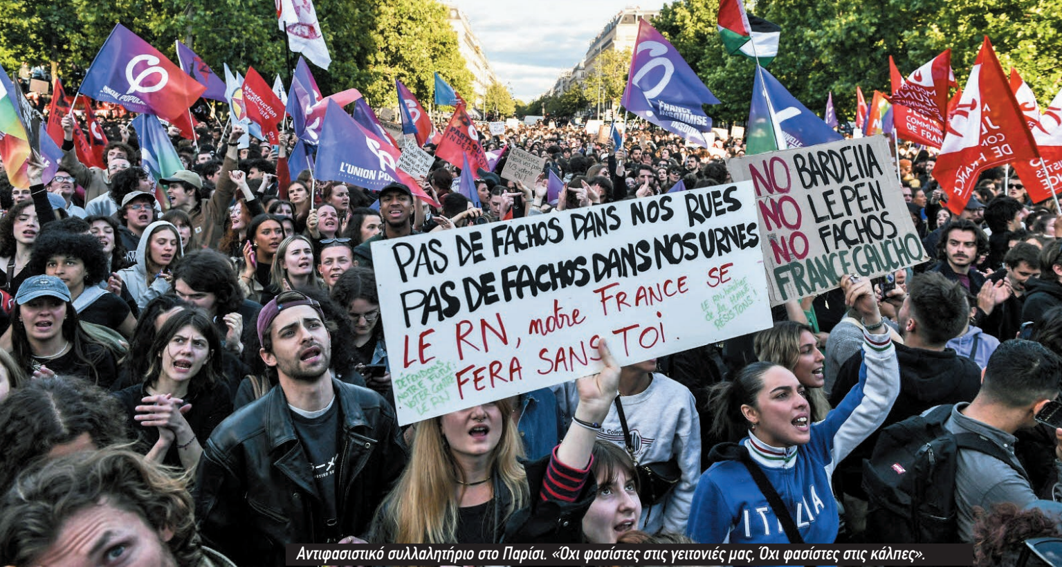
Αντιφασιστικό συλλαλητήριο στο Παρίσι. «Όχι φασίστες στις γειτονιές μας, Όχι φασίστες στις κάλπες».

λελεύθερου Κόμματος, του Γερμανικού Εθνικού, του Λαϊκού και του Κέντρου. Το πιο σημαντικό, βασίστηκαν στην αστυνομία και τον στρατό που εργάζονταν μαζί με τους τραμπούκους του κόμματός τους για να συντρίψουν όλη την αντιπολίτευση... Η ύπαρξη οργανώσεων μαζικών οδομαχιών ήταν βασικό στοιχείο για να κερδίσουν την υποστήριξη της άρχουσας τάξης και της κρατικής μηχανής. Οι φασίστες ηγέτες ουσιαστικά είπαν στην άρχουσα τάξη: «Αντιμετωπίζετε μια βαθιά κρίση. Απαιτείτε επιθέσεις στο βιοτικό επίπεδο των εργαζομένων που είναι υπερβολικές ακόμη και για τους πιο δειλούς ηγέτες των εργατικών οργανώσεων. Έχουμε τις μαζικές οργανώσεις που μπορούν να συνεργαστούν με την αστυνομία και τον στρατό για να συντρίψουν αυτές τις οργανώσεις». 8