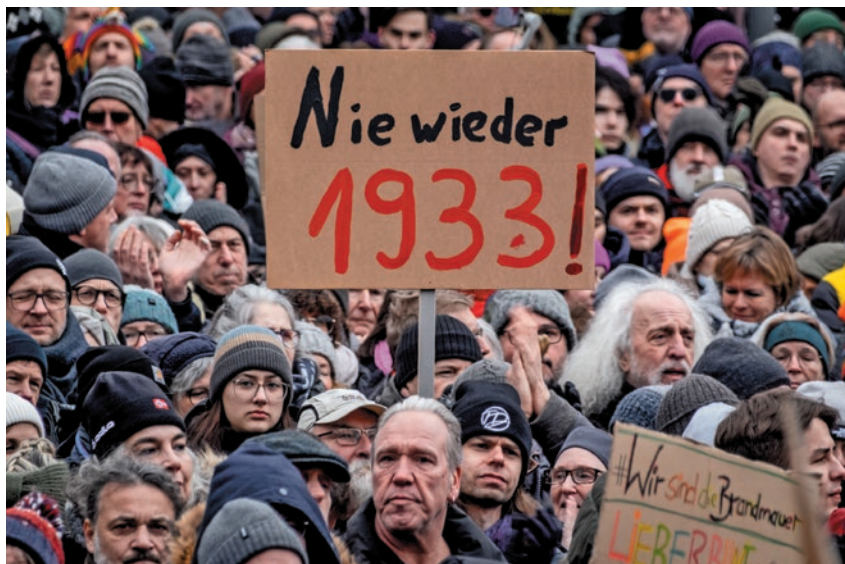
Αντιφασιστικό συλλαλητήριο. Η πικέτα γράφει «Ποτέ ξανά 1933».

από την Ανατολή και μία από τη Δύση. Ο μεν Τίνο Κρουπάλα προέρχεται από το CDU και μεταπήδησε στο AfD το 2015. Η δε Αλίσε Βάιντελ πέρασε κατευθείαν από τραπεζίτσα σε “υπερασπίστρια του λαού”. Έκανε καριέρα ως σύμβουλος στη Goldman Sachs, σε τράπεζες της Φρανκφούρτης και για έξι χρόνια βρισκόταν στην Τράπεζα της Κίνας. Δηλώνει θαυμάστρια της Θάτσερ και για χρόνια ήταν μέλος του ιδρύματος Φρίντριχ φον Χάγιεκ [ενός από τους ‘πατεράδες’