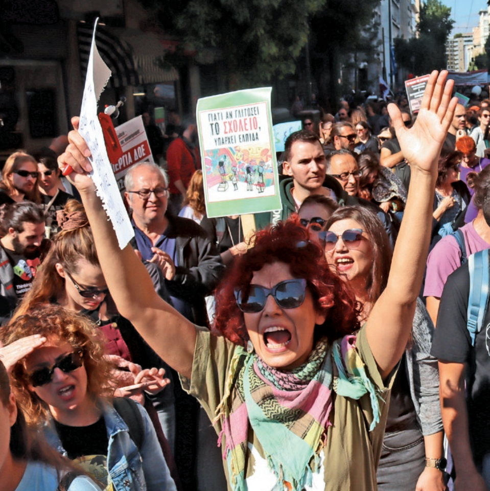
Απεργία εκπαιδευτικών στις 23 Οκτώβρη. η πικέτα γράφει: «Γιατί αν γλυτώσει το Σχολείο, υπάρχει ελπίδα».

σια παιδιατρικά νοσοκομεία. Η πολιτική της κυβέρνησης Μητσοτάκη προσπαθεί συνειδητά να οδηγήσει στη συρρίκνωση και την ιδιωτικοποίηση των Παιδιατρικών νοσοκομείων όλα τα τελευταία χρόνια. Πριν δυο χρόνια ήταν η υποστελέχωση του Παίδων Πεντέλης, στην συνέχεια ήταν το Καραμανδάνειο της Πάτρας, η παράδοση του Παιδογκολογικού του Αγία Σοφία στην Βαρδινογιάννη και πιο πρόσφατα οι επιθέσεις στο Αγλαΐα Κυριακού. Η πολιτική τους είναι η σκόπιμη υποστελέχωση των δημόσιων Παιδιατρικών νοσοκομείων έτσι ώστε να αναγκάζονται οι γονείς που δεν μπορούν να περιμένουν τα παιδιά τους σε μια ατελείωτη λίστα αναμονής για χειρουργείο, να καταφεύγουν σε ιδιωτικές κλινικές και να πληρώνουν από την τσέπη τους για την Υγεία των παιδιών τους. Η κυβέρνηση προσπαθεί να ιδιωτικοποιήσει και την Ψυχική Υγεία και Απεξάρτηση. Να μην έχουν δημόσια και δωρεάν πρόσβαση σε υπηρεσίες ψυχικής υγεί-