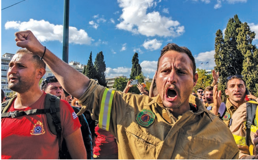
1 Νοέμβρη, οι πυροσβέστες στο Σύνταγμα