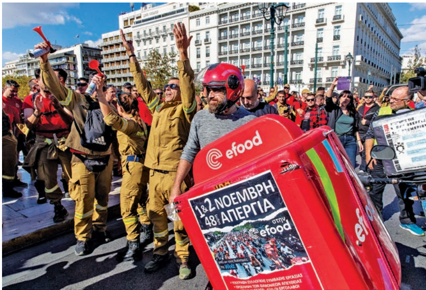
Πυροσβέστες μαζί με απεργούς της efood

τη συζήτηση για το ποια μπορεί να είναι η συνέχεια. Ο κόσμος συζητάει πολιτικά παντού- στη δουλειά, στους δρόμους, στις συγκοινωνίες. Αυτή είναι η εικόνα που υπάρχει σήμερα.