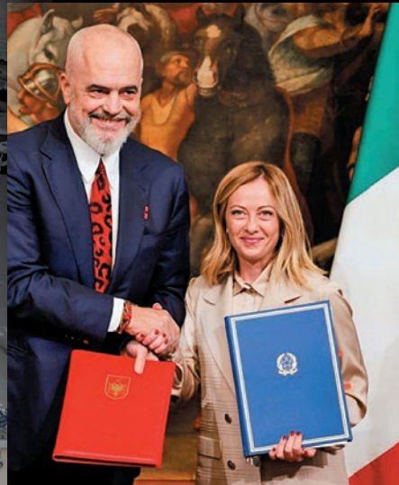
Στρατόπεδο κράτησης προσφύγων από την Ιταλία στην Αλβανία. Φτιαγμένο ύστερα από Συμφωνία Μελόνι-Ράμα.

Τέτοιες επικίνδυνες αντιμετώπισεις όχι μόνο δεν «τραβάνε το χαλί κάτω από τα πόδια» των φασιστών αλλά, αντίθετα τους «στρώνουν κόκκινο χαλί» για να αυξήσουν την επιρροή τους μέσα σε μπερδεμένα κομμάτια της εργατικής τάξης.