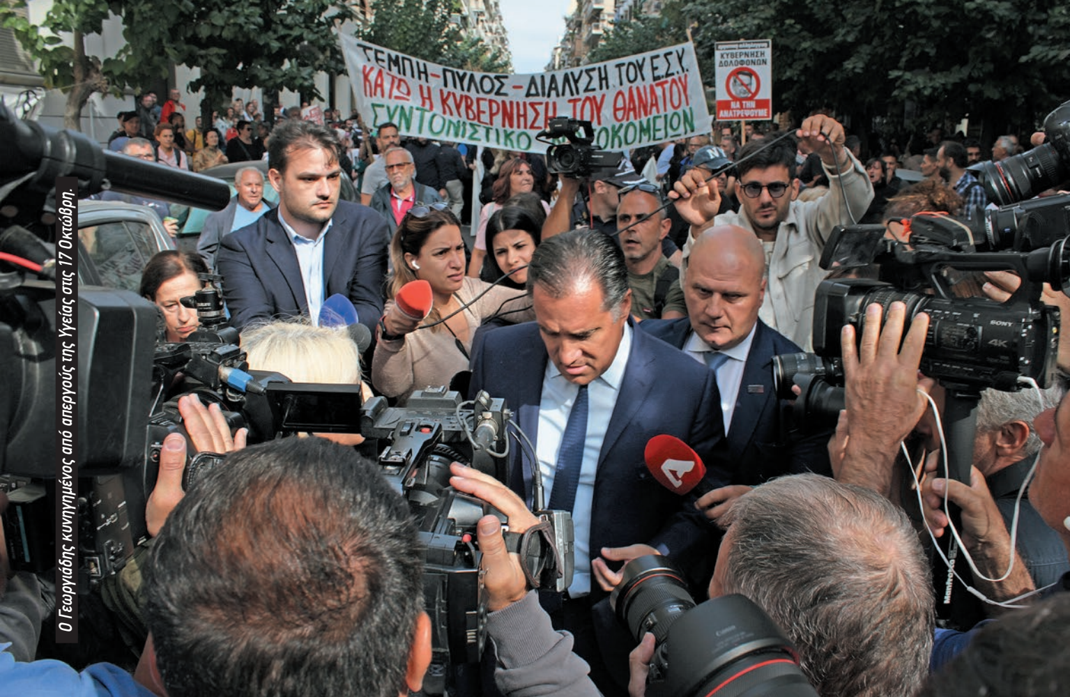
Ο Γεωργιάδης κινημένος από απεργούς της Υγείας στις 17 Οκτώβρη.