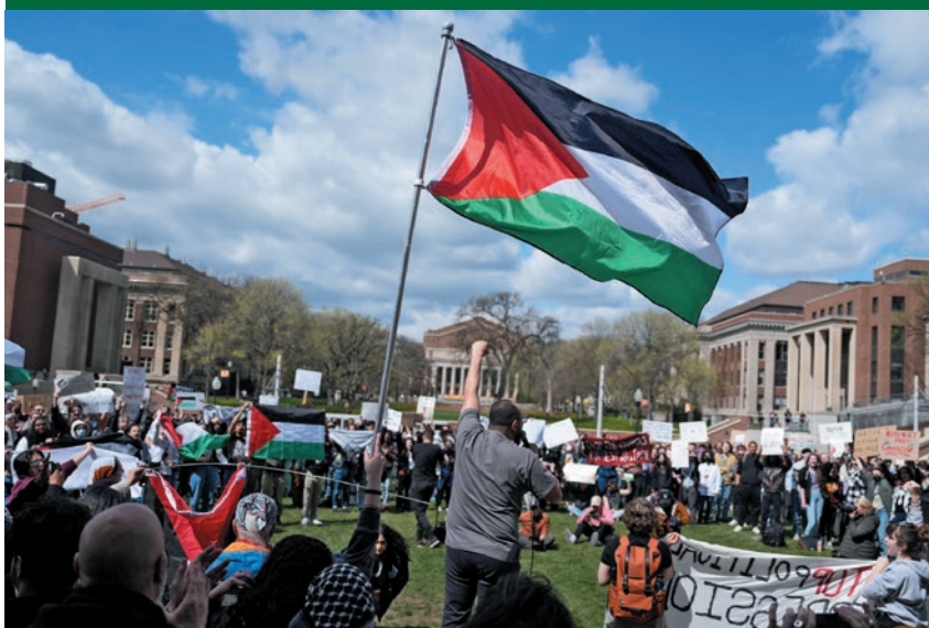
Στο πελινό της Παλαιστίνης σε Λονδίνο, Γενεύη, Μινεσότα