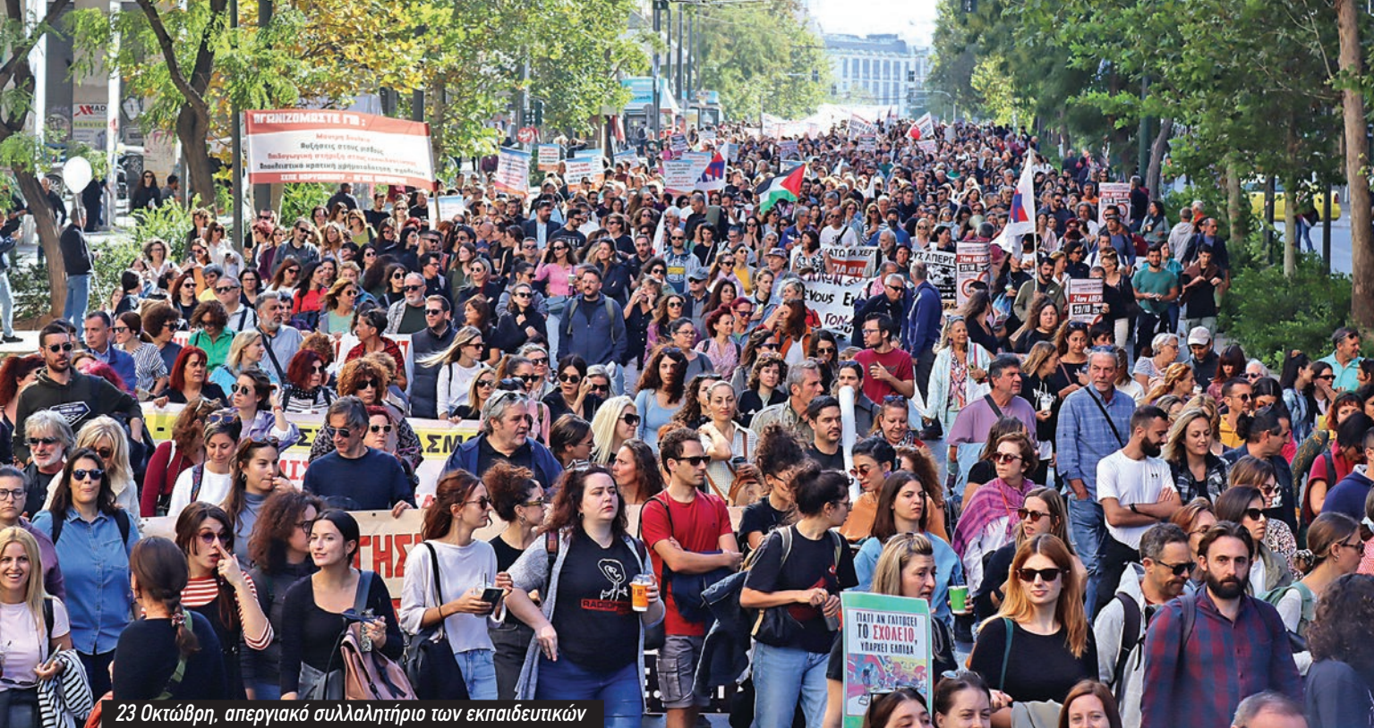
23 Οκτώβρη, απεργιακό συλλαλητήριο των εκπαιδευτικών