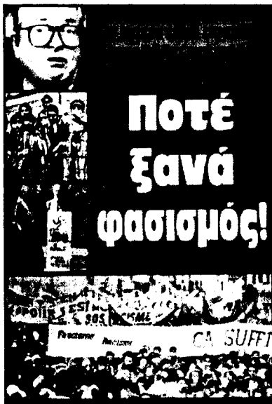
Για παραπέρα διάβασμα για το φασισμό: "Ποτέ ξανά φασισμός" του Κρις Μπάμπερυ από τις Έκδόσεις Εργατική Δημοκρατία

Η συνθηματολογία τους περί "υπερά- σπισης της ελληνικότητας της Μακεδο- νίας" και περί "διαφθοράς" δεν μπορούν