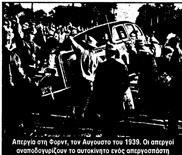
Απεργία στη Φορντ, τον Αυγουστο του 1939. Οι απεργοί αναποδογυρίζουν το αυτοκίνητο ενός απεργοσπάστη

Στις 20 Γενάρη αναλαμβάνει ο Κλίντον και επίσημα την προεδρία των ΗΠΑ. Πολλοί μιλούν για το σαραντάρη Κλίντον, για έναν άνεμο ανανέωσης στον Λευκό Οίκο, για τον καινούργιο Κέννεντυ. Στην Ελλάδα, το ΠΑΣΟΚ και ο ΣΥΝ αμέσως έτρεξαν να πουν ότι η πολιτική του Κλίντον, που είχε σαν κεντρικό σύνθημα την αλλαγή, έχει ομοιότητες με την δικιά τους. Λένε ότι θα είναι μια πολιτική που - όχι αμέσως βέβαια - θα βελτιώσει τις συνθή-