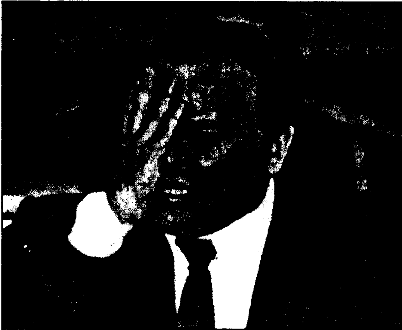
Ο Γκαιντάρ κλαίει

και για όλες τις καπιταλιστικές κυβερνήσεις του κόσμου, υπάρχει και πολιτικό και οικονομικό κόστος που συνήθως εμποδίζει την πραγματοποίηση των σχεδίων τους.