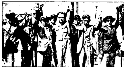
ΕΚΔΟΣΕΙΣ ΕΡΓΑΤΙΚΗ ΔΗΜΟΚΡΑΤΙΑ