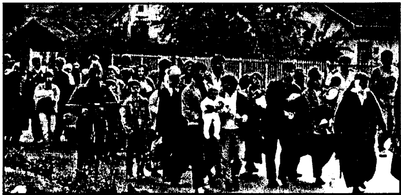
Πρόσφυγες από τη Βοσνία.

Τον υποστήριξαν στα πρώτα βήματα του πολέμου. Έτσι, για παράδειγμα, όταν είχε ήδη αρχίσει η εισβολή στην Σλοβενία τον Ιούλιο του '91, η ΔΑΣΕ έλεγε ότι "για την ανακήρυξη της ανεξαρτησίας της Σλοβενίας και της Κροατίας δεν τηρήθηκαν οι συνταγματικές διατάξεις". Και μόνο όταν φάνηκε ότι ο Μιλόσεβιτς δεν μπορούσε να επιβάλει σταθερότητα άλλαξαν κυνικά την πολιτική τους υποστηρίζοντας η κάθε μια κάποια Δημοκρατία