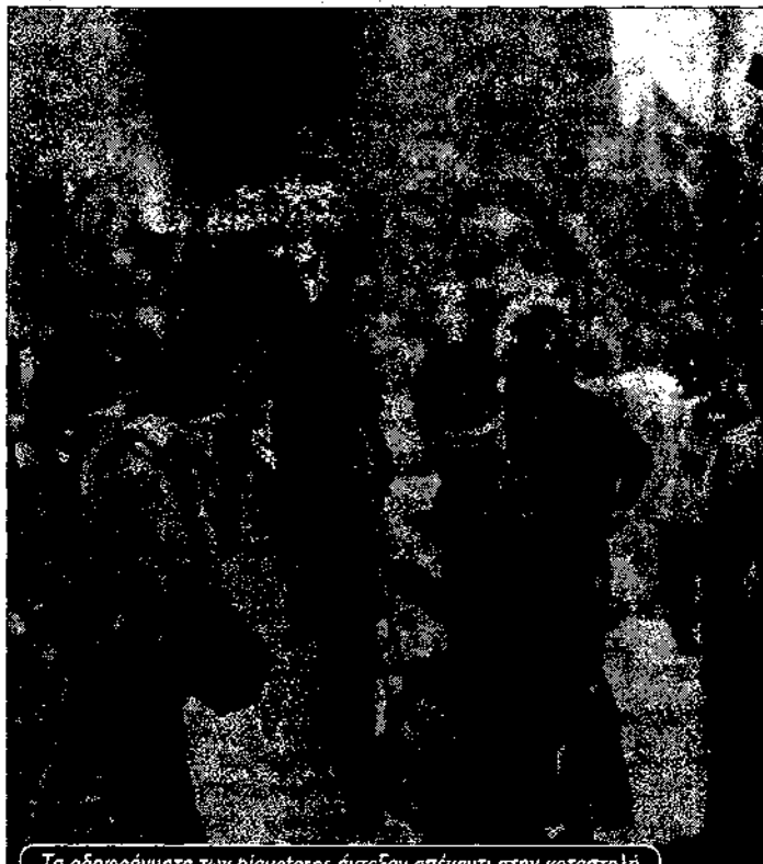
Τα οδοφράγματα των riqueteros άντεξαν απέναντι στην καταστολή

Οι απολύσεις και οι περικοπές στους μισθούς επιτάχυναν την κρίση στις μικρές και μεσαίες επιχειρήσεις. Τον Σεπτέμβρη του