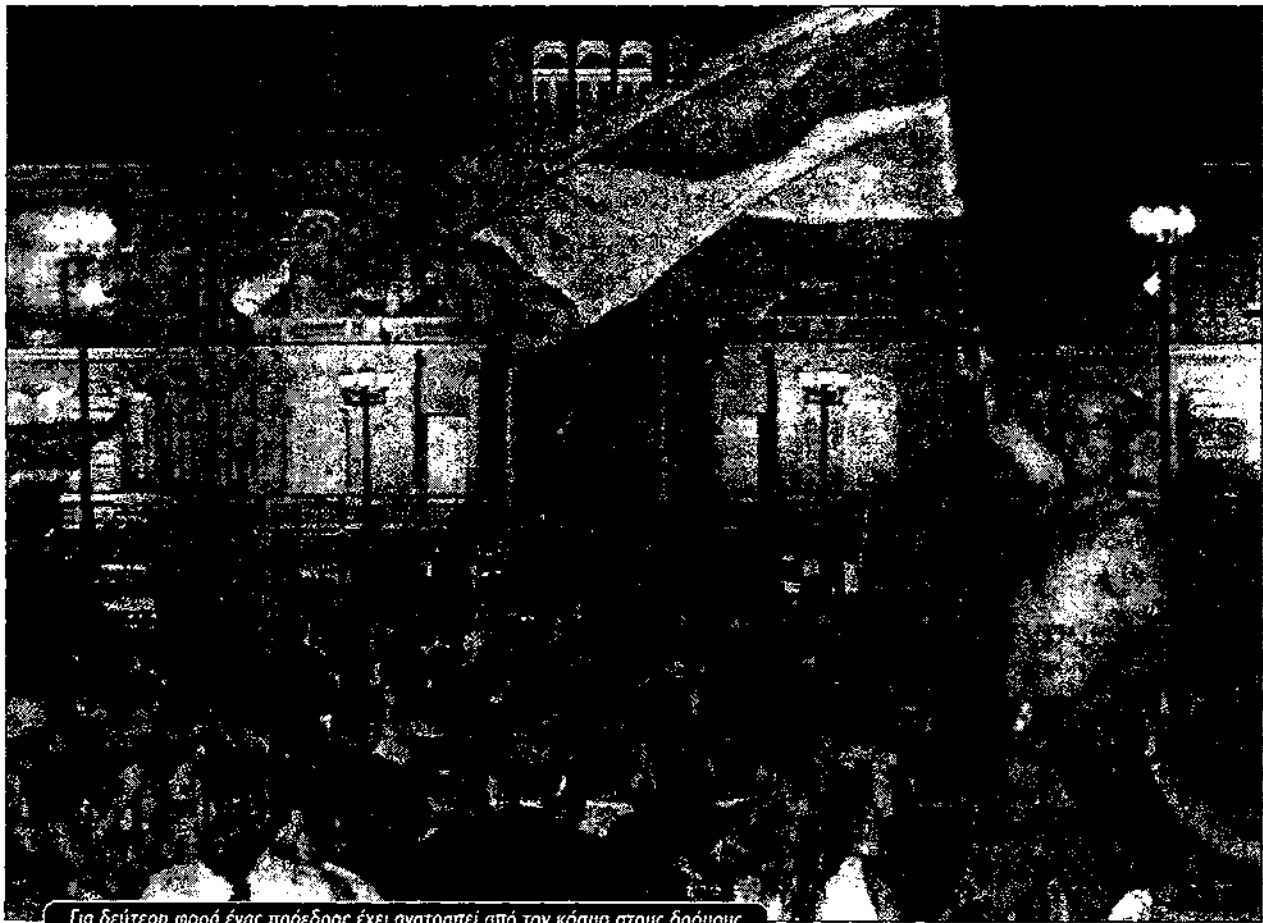
Για δεύτερη φορά ένας πρόεδρος έχει ανατραπεί από τον κόσμο στους δρόμους

Γι' αυτό, η συμπεριφορά της δεν ήταν μόνο γραφειοκρατική. Ήξερε ότι για να έχει τον έλεγχο των εργατών ήταν αναγκασμένη περιοδικά να καλεί σε προσεκτικά οργανωμένες μαχητικές - και συχνά πολύ βίαιες - κινητοποιήσεις. Κατά κάποιο τρόπο έμοιαζε περισσότερο με ένα διεφθαρμένο συνδικάτο των ΗΠΑ, όπως οι Τιμστερς την εποχή του Τζιμ Χόφα, παρά με τη βρετανική TUC [ή την ελληνική ΓΣΕΕ] -εκτός βέβαια από το γεγονός ότι έπαιζε πολύ πιο κεντρικό ρόλο στην αστική πολιτική της χώρας.