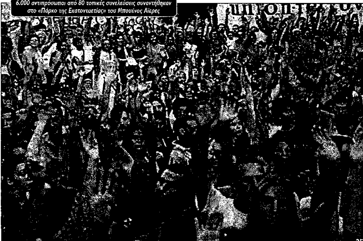
6.000 αντιπρόσωποι από 80 τοπικές συνελεύσεις συναντήθηκαν στο «Πάρκο της Εκατονταετίας» του Μπιουένος Αίρες

Ήδη, λοιπόν, από τον Μάρτη οι νέες μορφές αγώνα και οργάνωσης αποδείκνυαν ότι μπορούσαν να ταρακουνήσουν την κοινωνία από τα θεμέλιά της σε μια περίοδο που η άρχουσα τάξη διχαζόταν όλο και περισσότερο για το πώς θα αντιμετώπιζε την έντονη νομισματική κρίση της αργεντίνικης οικονομίας και του κράτους. Γι' αυτό είχαν δίκιο όσοι στη μαρξιστική αριστερά θεωρούσαν ότι η δυναμική της περιόδου είναι επαναστατική ("προ-επαναστατική κατάσταση"). Παρόλα αυτά κάτι τέτοιο δεν σημαίνει ότι η συνείδηση αυτών που ηγούνταν στα κινήματα ήταν αυτόματα, ή έστω γενικά, επαναστατική. Οι διαφορετικοί άνθρωποι που μπήκαν σε αυτούς τους αγώνες κουβαλούσαν και διαφορετικές ιδέες για το πώς θα παλέψουν αλλά και για το τι περιμένουν σαν αποτέλεσμα. Αυτό φάνηκε στους πρώτους αγώνες στην επαρχία Νεουκέν. Οι μαχητικοί νέοι που συγκρούστηκαν με την αστυνομία ένωσαν πίκρα και οργή όταν η τοπική ηγεσία συμφώνησε σε ένα συμβιβασμό με τον κυβερνήτη που πρόσφερε λίγες θέσεις εργασίας και κάποια επιδόματα για τους πολύ φτωχούς. Οι ίδιες διαφωνίες εκδηλώθηκαν και στη διάρκεια του μεγάλου κινήματος στο Ματάντζα. Η ηγεσία συμφώνησε να κλείσει το μπλόκο μετά α-