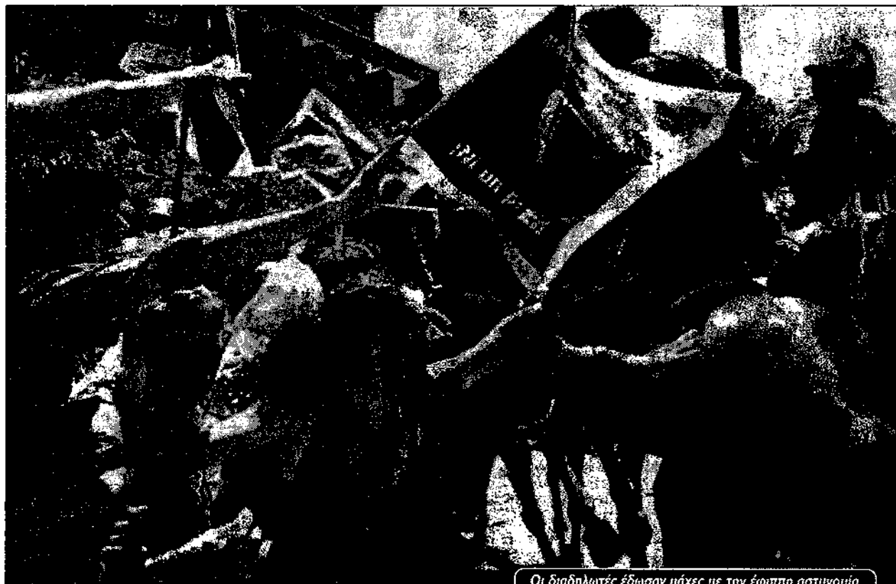
Οι διαδηλωτές έδωσαν μάχες με την έφιππη αστυνομία