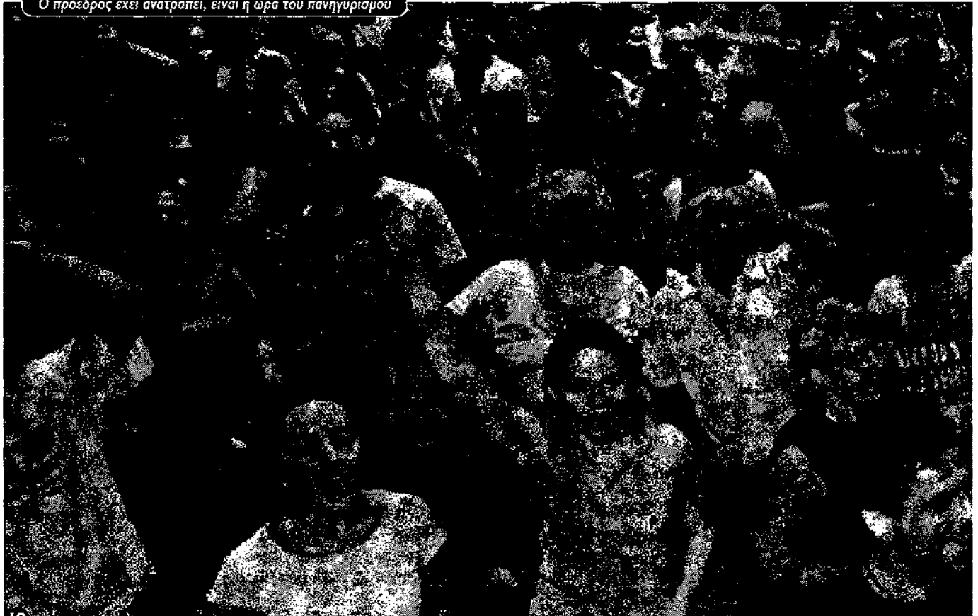
Ο πρόεδρος έχει ανατραπεί, είναι η ώρα του πανηγυρισμού

Λειτουργούν δεκάδες τοπικές συνελεύσεις, ένα γνήσιο προϊόν της λαϊκής οργάνωσης που ξεπετάχθηκε από την εξέγερση της κα-