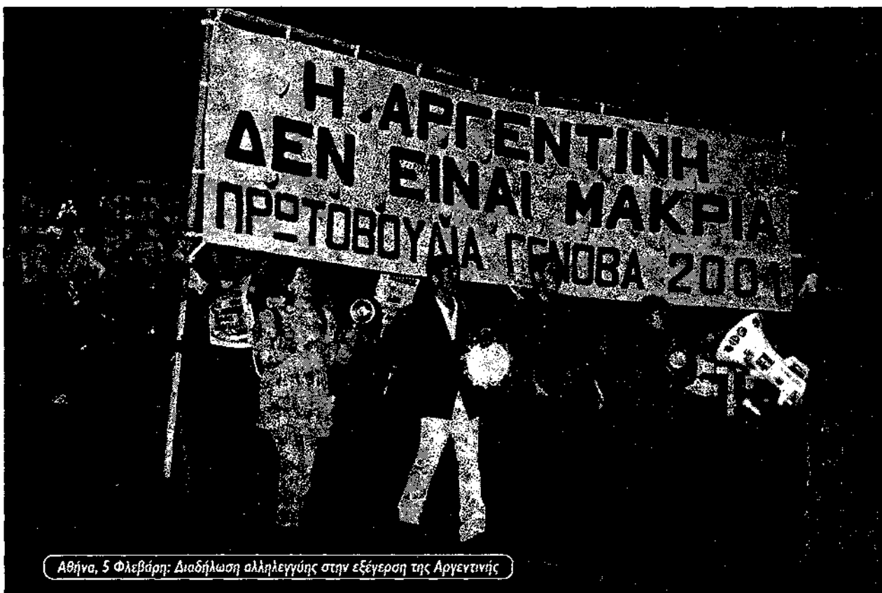
Αθήνα, 5 Φλεβάρη: Διαδήλωση αλληλεγγύης στην εξέγερση της Αργεντινής

Ο Μάρτιν Γουλφ, αρθρογράφος των Financial Times, συνόψισε την απογοήτευση πολλών καπιταλιστικών κύκλων από τη σύγκυση στους κόλπους της κυβέρνησης. "Ο πρόεδρος της Αργεντινής" έγραφε "μετέτρεψε την συμφορά σε κάτι χειρότερο" με τις προσπάθειές του να εφαρμόσει μια "λαϊκίστικη πολιτική" με στόχο να ικανοποιήσει τους πόντες. Ο Γουλφ βέβαια δεν είπε τι άλλο μπο-