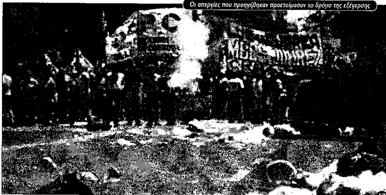
Οι απεργίες που προηγήθηκαν προετοίμασαν το δρόμο της εξέγερσης

Είναι κάτοικοι του San Cristobal. "Τις τελευταίες βδομάδες βρισκόμαστε μεταξύ ευφορίας και φόβου", λένε. "Εχουμε κάνει πράγ-