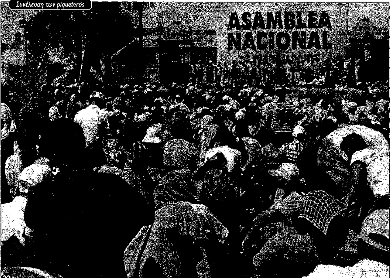
Συνέλευση των riqueteros

Αυτές οι αυταπάτες επέτρεψαν στον Μενέμ και τον Καβάγιο να προωθήσουν τις ιδιωτικοποιήσεις και την αναδιάρθρωση χωρίς να συναντήσουν ιδιαίτερη συντονισμένη αντίσταση. Υπήρξαν εκρήξεις με απεργίες και καταλήψεις ενάντια στα κλεισίματα εργοστασίων και τις απολύσεις. Αλλά ήταν απομονωμένες εκρήξεις, κι ακολουθούσε η ήττα και η απογοήτευση. Συνεχώς υπήρχε πίεση