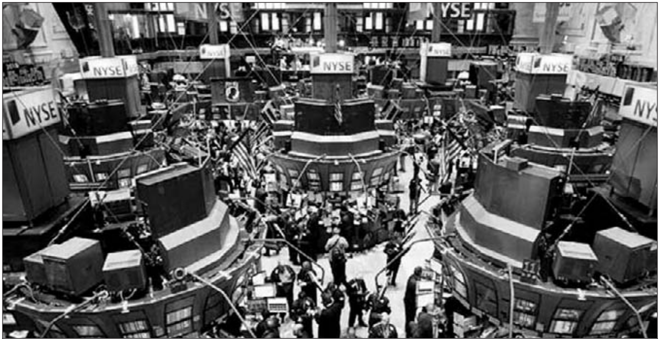
Το χρηματιστήριο της Νέας Υόρκης