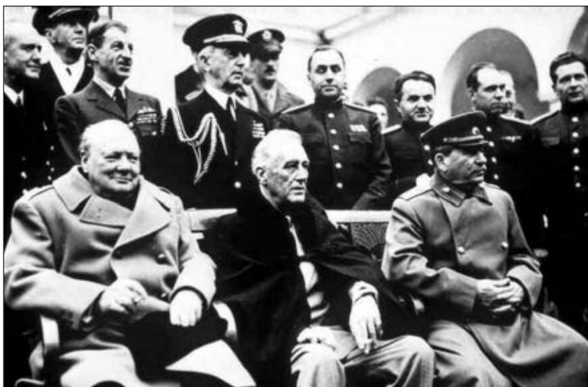
Στάλιν, Ρούσβελτ και Τσότσοϊτς στην Γιάττα

Αυτός ο τεράστιος κατασταλτικός μηχανισμός χρησιμοποιήθηκε για να επιβάλει την πειθαρχία και στο στρατό. Ο στρατός