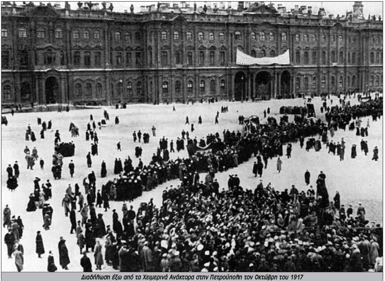
Διαδήλωση έξω από τα Χειμερινά Ανάκτορα στην Πετρούπολη τον Οκτώβριο του 1917

καθίσουμε εμείς και να μην αφήσουμε την αντεπανάσταση να προκαλέσει;”, ήταν το πολιτικό τους σκεπτικό.