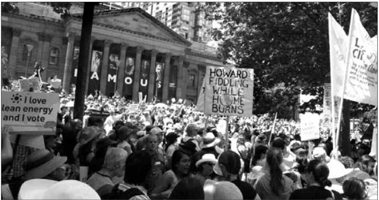
Πάνω από 100.000 διαδηλωτές βγήκαν στους δρόμους στην Αυστραλία στις 11 Νοέμβρη απαιτώντας μέτρα ενάντια στην κλιματική αλλαγή

το μέγεθος του κινδύνου εξ'ατίας της κλιματικής αλλαγής, σήμερα έχουν καταλήξει να προτείνουν την καταναλωτική αυτοσυγκράτηση του καθενός σαν άτομο, την «πράσινη αγορά» και «πράσινη φορολογία», χωρίς να αναφέρονται στον τρόπο και τις προτεραιότητες οργάνωσης του συστήματος.