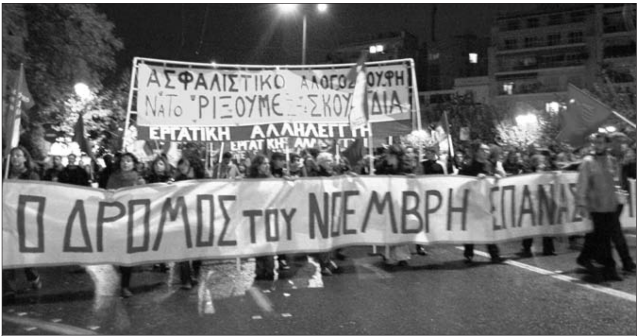
Πορεία Πολυτεχνείου 17 Νοέμβρη 2007

πιάνεις όταν επενδύεις 10 ευρώ και άλλη όταν επενδύεις 1 εκατομμύριο», κραύγαζε σε τηλεοπτική εκπομπή ο γνωστός κ.Γεωργιάδης. Αυτό που φαντασιώνονται όλοι αυτοί είναι ένα Investment Fund που θα βγει στο παζάρι των χρηματοπιστωτικών αγορών με μπάτζα 31 δις ευρώ από τα αποθεματικά των Ταμείων.