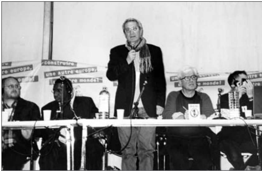
Ο Τόνι Νέγκρι μιλάει σε αντιπολεμική συζήτηση στο ΕΚΦ στο Παρίσι, Νοέμβρης 2003