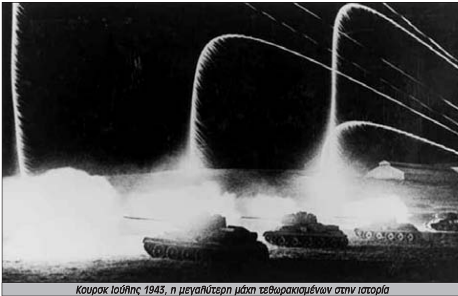
Κουρσκ Ιούλης 1943, η μεγαλύτερη μάχη τεθωρακισμένων στην ιστορία

οτι το Σύμφωνο με τον Χίτλερ είχε καταρρεύσει έφτασε μέχρι το σημείο να δώσει εντολή να εκτελεστεί ένας γερμανός φαντάρος που λιποτάκτησε στις 21 Ιούνη 1941, την παραμονή της εισβολής, και πέρασε τα σύνορα για να ειδοποιήσει. Ο Στάλιν τον θεώρησε προβοκάτορα!