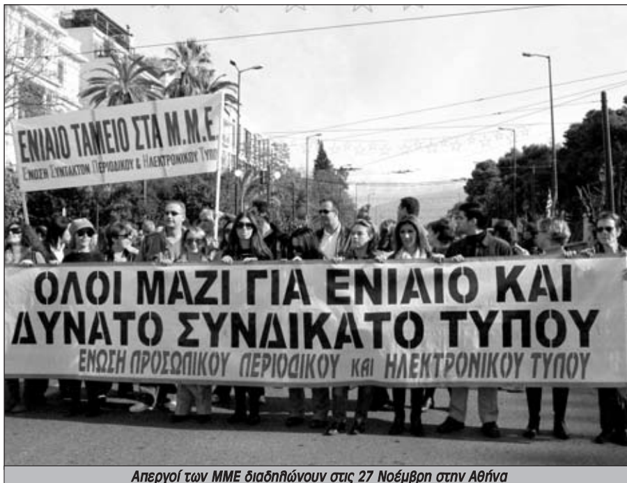
Απεργία των ΜΜΕ διαδηλώνουν στις 27 Νοέμβρη στην Αθήνα

διάθεση να συγκρουστούν με αυτή την πολιτική στο ασφαλιστικό αλλιώς και γιατί έχουμε μπροστά μας μία αδύναμη κυβέρνηση. Τα αποτελέσματα των εκλογών απέδειξαν ότι η πλειοψηφία της εργατικής τάξης εμπνέεται από το κίνημα που έδωσε την κόντρα με την κυβέρνηση Καραμανλή. Σε όλους τους χώρους οι εμπειρίες από τις προηγούμενες μάχες και το μήνυμα της αριστερής στροφής που βγήκε από την κλήπη, έχει διαμορφώσει ένα κλίμα αυτοπεποίθησης και αποφασιστικότητας σε όλους τους εργαζόμενους να μην αφήσουν την κυβέρνηση να υλοποιήσει ούτε τον προϋπολογισμό της λιτότητας, ούτε την επίθεση στο ασφαλιστικό ούτε καμία άλλη μεταρρύθμιση.