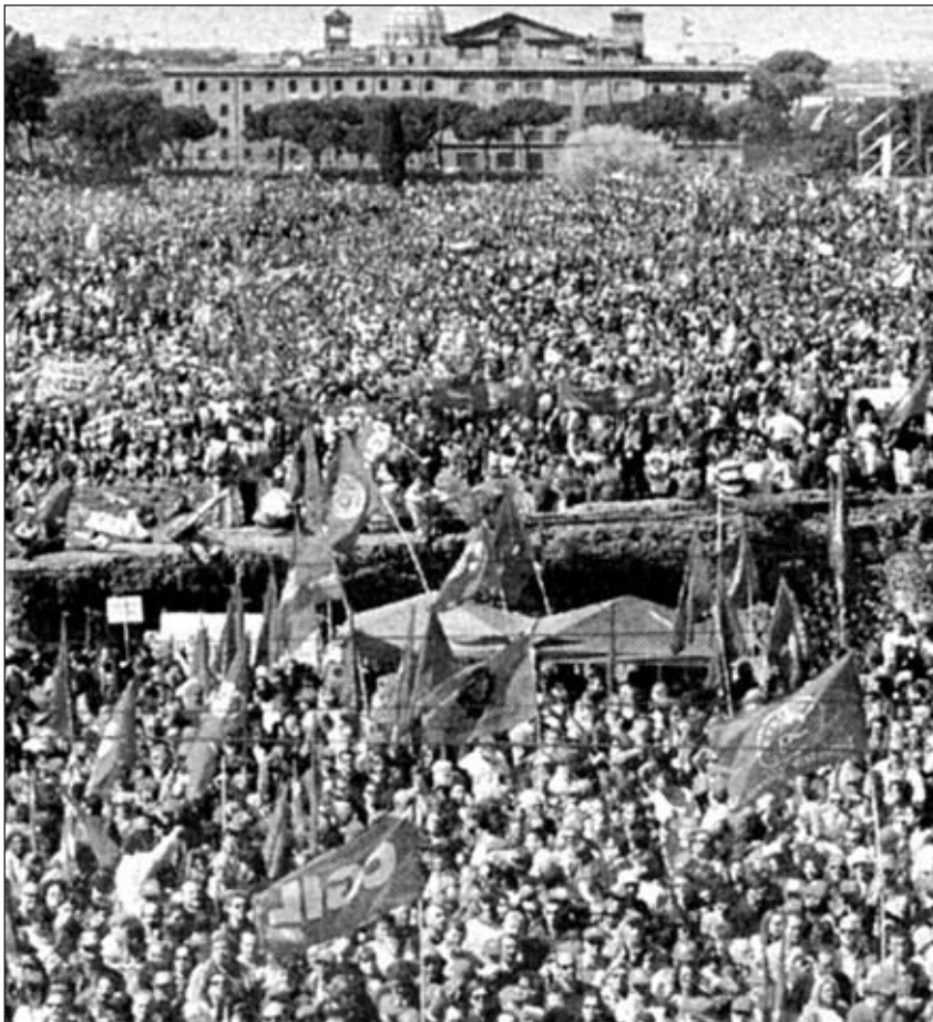
Η εργατική τάξη είναι εδώ: 1,5 εκατομμύριο απεργό διαδηλώνουν στην Ρώμη, Ανοιξη 2002

κής τάξης στο «πλήθος» έχουμε την ένταξη ολόκληρων κατηγοριών απασχόλησης που παλιότερα θεωρούνταν «μεσοαστικές» στην εργατική τάξη που συνοδεύεται με την οργάνωσή της σε συνδικάτα, τις απεργίες και όλες τις μορφές δράσης της «παλιάς» εργατικής τάξης.