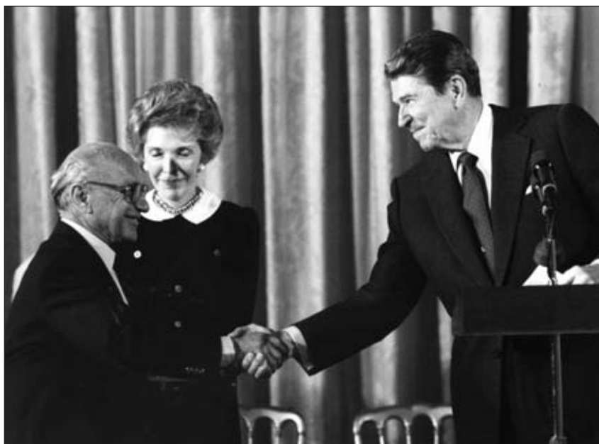
Ο Ρίγκαν με τον "γκουρού" του νεοφιλελευθερισμού Μίτον Φρίντμαν

Πού οφείλει, λοιπόν, ο νεοφιλελευθερισμός αυτή του την καθολική αποδοχή; Η απάντηση είναι πολύ απλή: πίσω από τις ωραίες εικόνες για τις "αξίες του πολιτισμού" και την "ελευθερία της σκέψης και της έκφρασης" δεν κρύβεται παρά ένα σχέδιο που έχει σαν μοναδικούς στόχους την "επανεδραίωση των συνθηκών της καπιταλιστικής συσσώρευσης" από την μια και την "παλινορθωση της δύναμης των