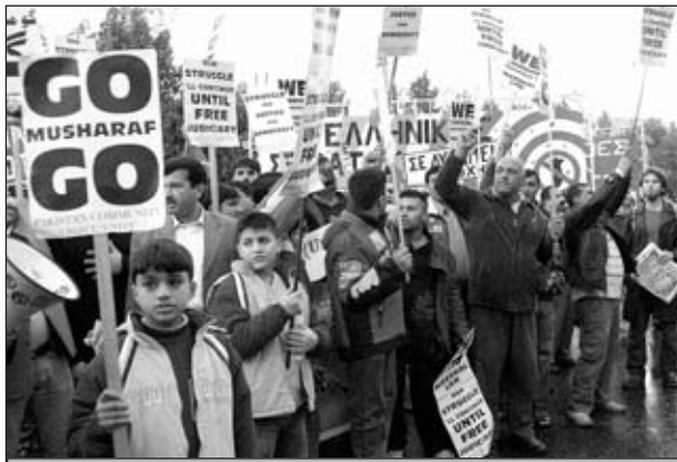
Διαμαρτυρία έξω από την Πακιστανική πρεσβεία 17/11/07