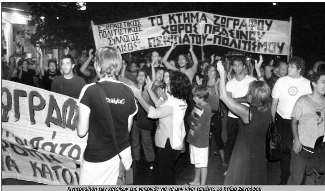
Κινητοποίηση των κατοίκων της γειτονιάς για να μην γίνει τσιμέντο το Κτήμα Ζωγράφου

απέμεινε από τους λιγοστούς ελεύθερους χώρους.