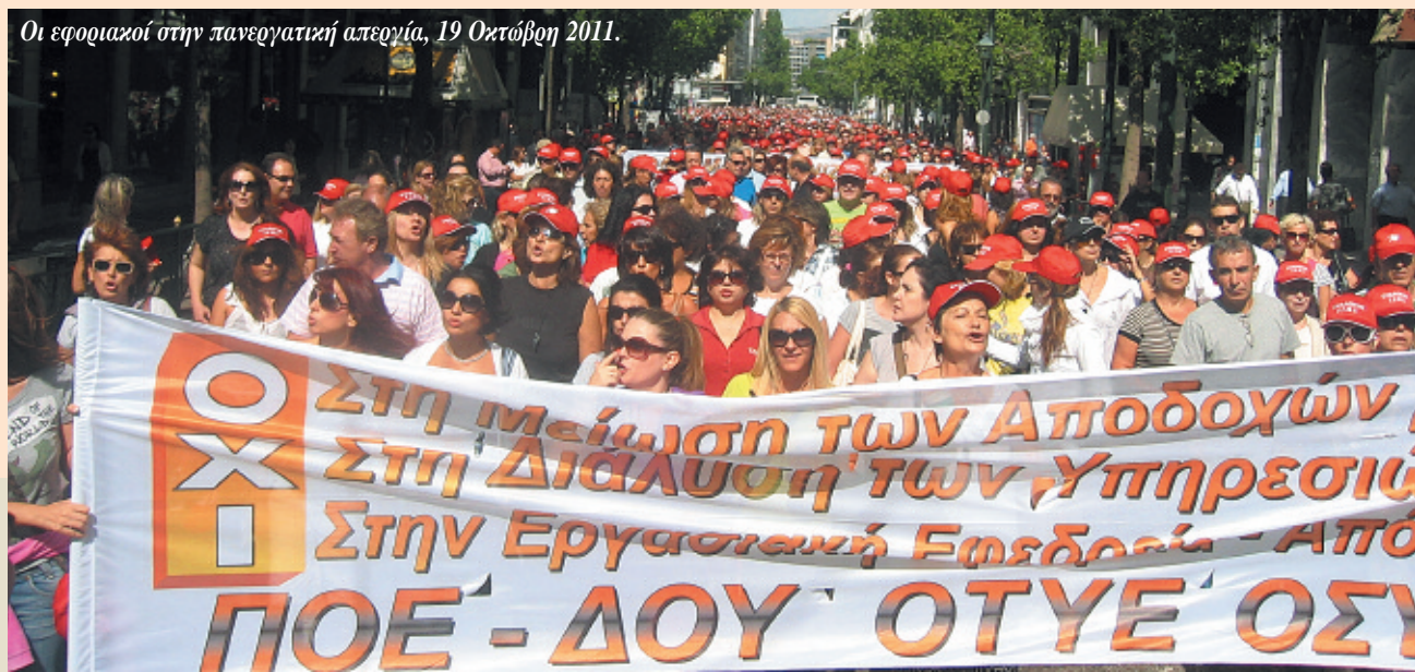
Οι εφοριακοί στην πανεργατική απεργία, 19 Οκτώβρη 2011.

Η συμμετοχή στην 5η Οκτώβρη είναι ανεπανάληπτη, πρόκειται για τη μεγαλύτερη απεργία που έχει κάνει ποτέ η ΑΔΕΔΥ. Κάτω από αυτήν την πίεση, η αποφασισμένη για τις 19/10, 24ωρη πανεργατική απεργία γίνεται 48ωρη 19-20/10. Αλλά η διάθεση της βάσης πάει