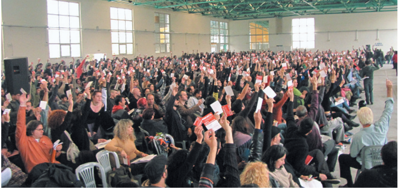
Στιγμιότυπο από ψηφοφορία στην πρώτη Συνδιάσκεψη της ANΤΑΡΣΥΑ, 29 - 30 Οκτώβρη.

λιτικό αυτό σχέδιο πάσχει από δύο πλευρές: στο πεδίο της κοινής δράσης είναι υπερβολικά στενό, καθιστά δηλαδή προνομιακούς συμμάχους της ANΤΑΡΣΥΑ κάποια κομμάτια της Αριστεράς τη στιγμή που οι κινηματικές δράσεις θα πρέπει σήμερα να πετυχαίνουν μια πολύ ευρύτερη ενότητα. Η επίθεση του ΠΑΣΟΚ στην εργατική τάξη απελευθερώνει πλατιές δυνάμεις που το προηγούμενο διάστημα συσπειρώνονταν στη σοσιαλδημοκρατία: η Αριστερά πρέπει να επιδιώκει (και όχι να αποκλείει) την κοινή δράση με αυτά τα κομμάτια στη βάση των μαχητικών μορφών πάλις που το ίδιο το κίνημα αναδεικνύει (καταλήψεις εργατικών χώρων, απεργίες διαρκείας, κλπ).