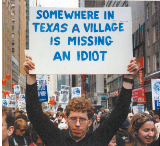
Αμερική, 15 Φεβράρη 2003.

τους συμμετέχοντες: “Στην Αμερική για δεκαετίες είχαμε έναν μονόπλευρο ταξικό πόλεμο. Όμως τώρα η δικιά μας μεριά αρχίζει να απαντά κι αυτή”.