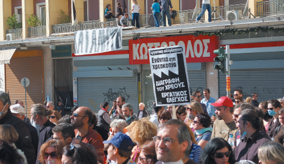
Απεργοί κάτω από το κατειλημμένο Υπουργείο Εσωτερικών.

βαίωσε τις ηγεσίες τους ότι οι υπάλληλοι που υπάγονται στο υπ. Οικονομικών θα εξαιρεθούν από το ενιαίο μισθολόγιο και θα ισχύσει για αυτούς ειδικό καθεστώς. Μάλιστα, η φόρμουλα εξαίρεσης που χρησιμοποιήθηκε για τους εφοριακούς άρχισε να συζητιέται ανεπίσημα σαν αντικείμενο διαπραγμάτευσης και για άλλους κλάδους και στο τέλος, κεντρικά ανάμεσα σε ΑΔΕΔΥ και κυβέρνηση, συνολικά για όλους τους δημόσιους υπάλληλους.