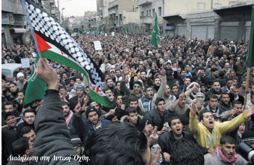
Διαδήλωση στη Δυτική Όχθη.

Η επιτυχία της Παλαιστινιακής Αρχής να γίνει δεκτή ως μέλος στην ΟΥΝΕΣΚΟ έδειξε πόσο τεταμένη είναι η κατάσταση. Στην ψηφοφορία 107 ψήφισαν υπέρ της Παλαιστίνης, 14 κατά με πρωτεργάτες τις ΗΠΑ και το Ισραήλ, και 52, ανάμεσά τους η Βρετανία, απείχαν. Αμέσως μετά την ψηφοφορία οι ΗΠΑ ανακοίνωσαν το πάγωμα της χρηματοδότησης προς την ΟΥΝΕΣΚΟ, η οποία