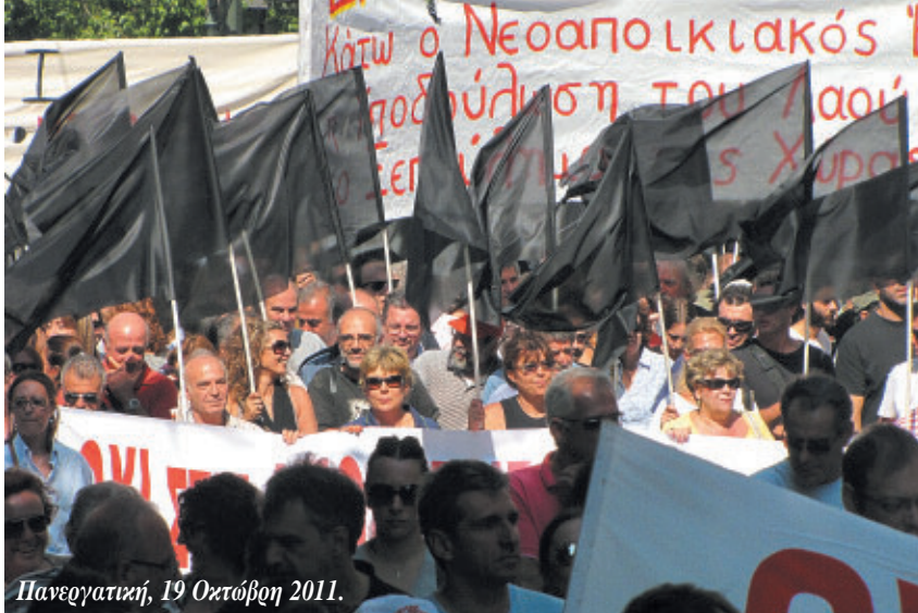
Πανεργατική, 19 Οκτώβρη 2011.

Όμως τα νέα περνάνε από τον ένα χώρο στον άλλο σαν μεταδοτικός ιός που εξαπλώνεται με την ταχύτητα του φωτός. Μέχρι να προλάβει να κλείσει η κατάληψη στο Υγείας, ξεκινάνε καταλήψεις μια σειρά άλλα υπουργεία, με παρόμοια διαδικασία κίνησης της βάσης. Έτσι, η «αναστολή» δεν κρατά και πολύ καθώς ο αγώνας πλαταίνει και οι εργαζόμενοι του υπουργείου Υγείας ξαναβγαίνουν σε κατάληψη. Με τον ίδιο τρόπο προχωράνε τα πράγματα στους δήμους, τα νοσοκομεία, την ΕΡΤ και μια σειρά άλλους χώρους.