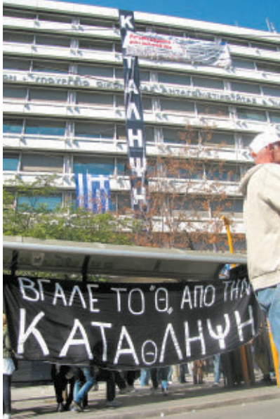
Το Υπουργείο Οικονομικών στο Σύνταγμα υπό κατάληψη.

Η απόφαση της ΓΕΝΟΠ ΔΕΗ να εμποδίσει στην πράξη την έκδοση των λογαριασμών ή αργότερα το κόψιμο του ρεύματος σε όποιον δεν πληρώνει το χαράτσι είναι ένα παράδειγμα του τι σημαίνει η δύναμη των εργατών να μπλοκάρουν τον έλεγχο των από πάνω και να επιβάλλουν δικό τους έλεγχο. Το άτυπο μπλοκάρισμα των καταλόγων της εφε-