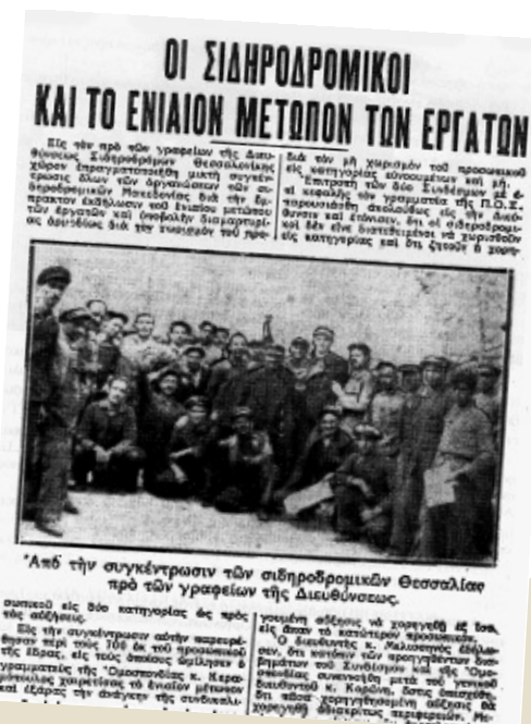
Από την συγκέντρωση των σιδηροδρομικών Θεσσαλίας πρό των γραφείων της Διευθύνσεως.

Η αιματηρή καταστολή των εργατών συνεχίστηκε και αφού πήραν την κυβέρνηση οι αντιβενιζελικοί. Σημαντικές ταραχές στην Καβάλα προκάλεσαν την επιβολή στρατιωτικού νόμου στην πόλη. 6 Στο Αλιβέρι η χωροφυλακή πυροβόλησε εναντίον εργατών που διαμαρτύρονταν επειδή είχαν μείνει πέντε μήνες απλήρωτοι, αφήνοντας στον τόπο δυο από αυτούς· οι τραυματίες ήταν δεκάδες. Οι Φιλελεύθεροι απέφευγαν να πιάσουν στον σχετικό κοινοβουλευτικό έλεγχο, ενώ ο Αλέξανδρος Παπαναστασίου, ηγέτης του σοσιαλιστικών τάσεων Αγροτεργατικού Κόμματος, δήλωνε χλιαρά ότι δεν έπρεπε να επιτρέπεται στους αστυνομικούς να χτυπούν τόσο πολύ τους εργάτες, 7 ξαναβρίσκοντας έτσι κοινωνικές ευαισθησίες τις οποίες είχε χά-