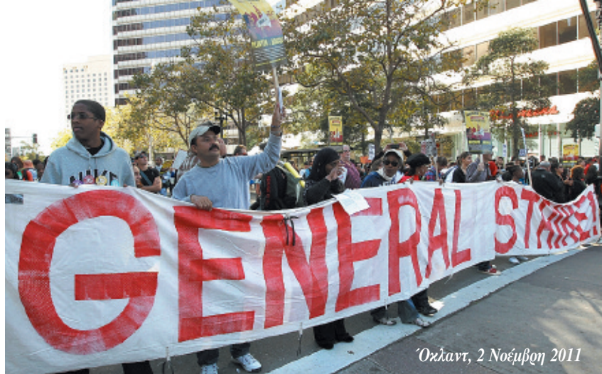
Οκλαντ, 2 Νοέμβρη 2011

Σ' αυτό το επίπεδο η σύγκριση με το κίνημα της δεκαετίας του '60 είναι πολύ διαφωτιστική. Το κίνημα φούντωσε στα μέσα εκείνης της δεκαετίας μέσα στα πανεπιστήμια και τα σχολεία, στα γκέτο των Μαύρων στις μεγάλες πόλεις. Το αντιπολεμικό κίνημα έφτασε να κινητοποιεί εκατομμύρια, και να έχει μεγάλο