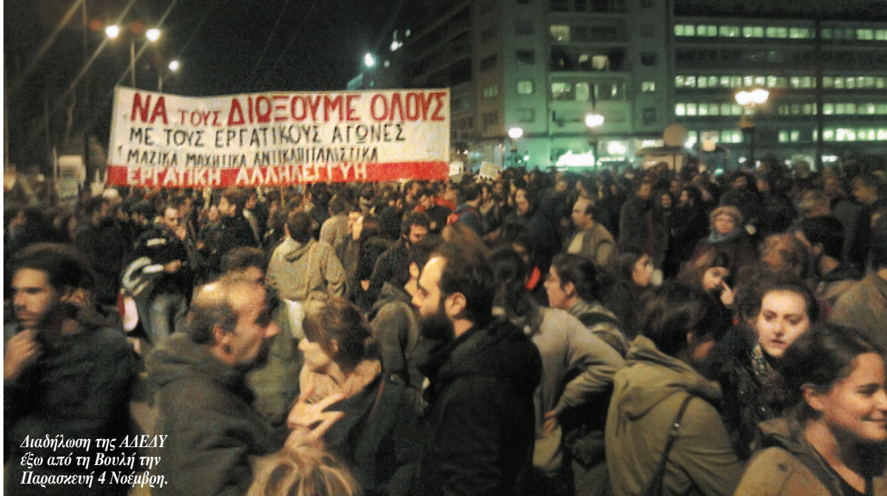
Διαδήλωση της ΑΔΕΔΥ έξω από τη Βουλή την Παρασκευή 4 Νοέμβρη.

Η ελπίδα τους, ότι το «κούρεμα» θα γλυκάνει τα νέα μνημόνια και τα νέα προγράμματα λιτότητας όχι μόνο είναι αδιέξοδη, αλλά θα αντιμετωπίσει την εργατική αντίσταση, όχι μόνο στην Ελλάδα, αλλά σε όλη την Ευρώπη.