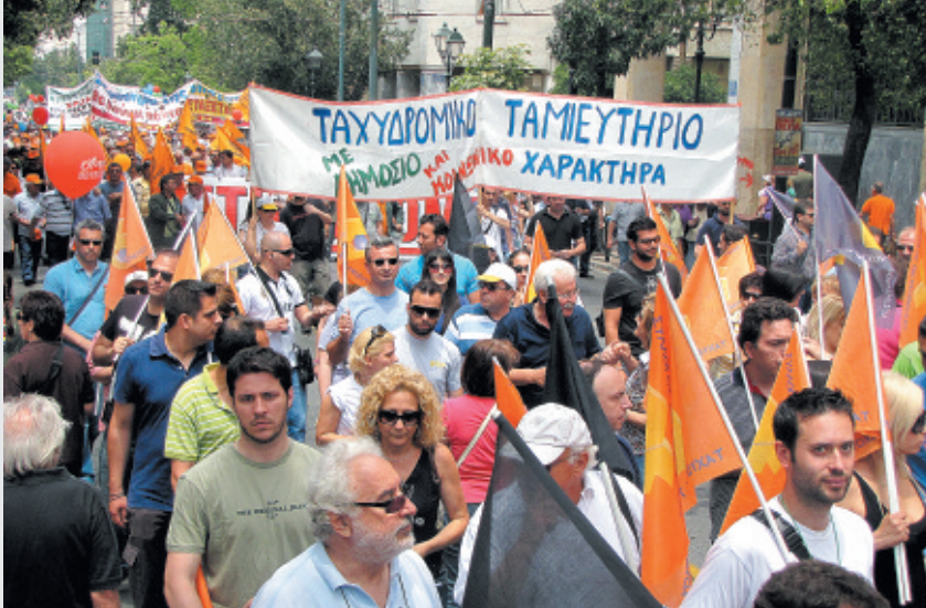
Οι εργαζόμενοι του Ταχυδρομικού Ταμειυτηρίου διαδηλώνουν στην απεργία της 15 Ιούνη.

Ο εργατικός έλεγχος θέτει σε αμφισβήτηση όχι μόνο τους κανόνες της αγοράς αλλά και ολόκληρη την αστική εξουσία. “Είναι φανερό ότι η εξουσία δεν βρίσκεται ακόμα στα χέρια του προλεταριάτου, αλλιώς δεν θα είχαμε εργατικό έλεγχο της παραγωγής αλλά τον έλεγχο της παραγωγής από το εργατικό κράτος”, γράφει ο Τρότσκι στο ίδιο κείμενο. “Αυτό για το οποίο μιλάμε είναι εργατικός έλεγχος σε ένα καπιταλιστικό καθεστώς, κάτω από την εξουσία της αστικής τάξης... Μια αστική τάξη όμως