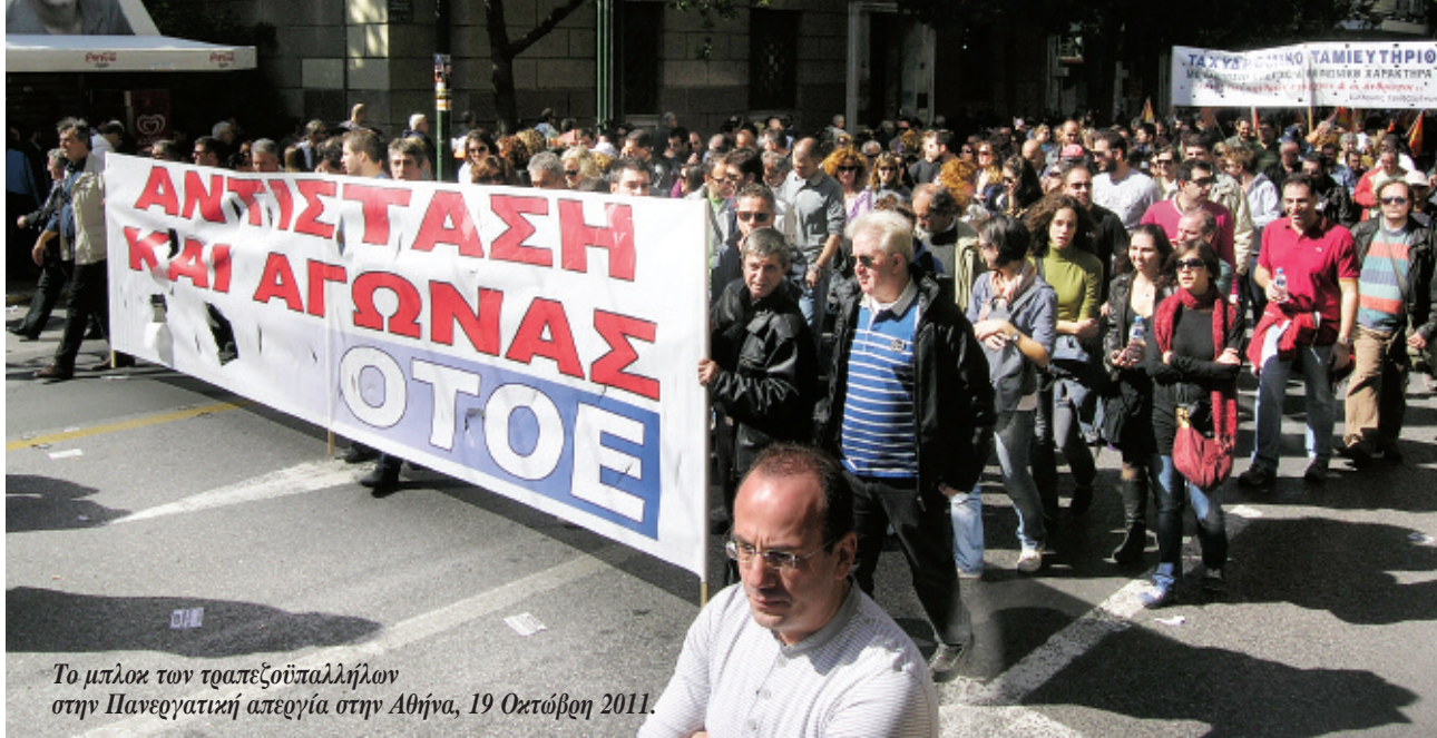
Το μπλοκ των τραπεζοϋπαλλήλων στην Πανεργατική απεργία στην Αθήνα, 19 Οκτώβρη 2011.

μετατρέψει το City του Λονδίνου στον χρηματοπιστωτικό κόμβο του πλανήτη. Το ίδιο έκαναν και οι κυβερνήσεις του Μητσοτάκη, του Σημίτη και του Καραμανλή στη χώρα μας: η Ελλάδα έπαψε να έχει αυτάρκεια σε πχ ζάχαρη ή σιτηρά, αλλά η Αθήνα έγινε πραγματικά η τραπεζική πρωτεύουσα των Βαλκανίων. Χωρίς το Ευρώ, χωρίς ένα “σκληρό νόμισμα” αυτή η “επιτυχία” θα ήταν αδιανόητη.