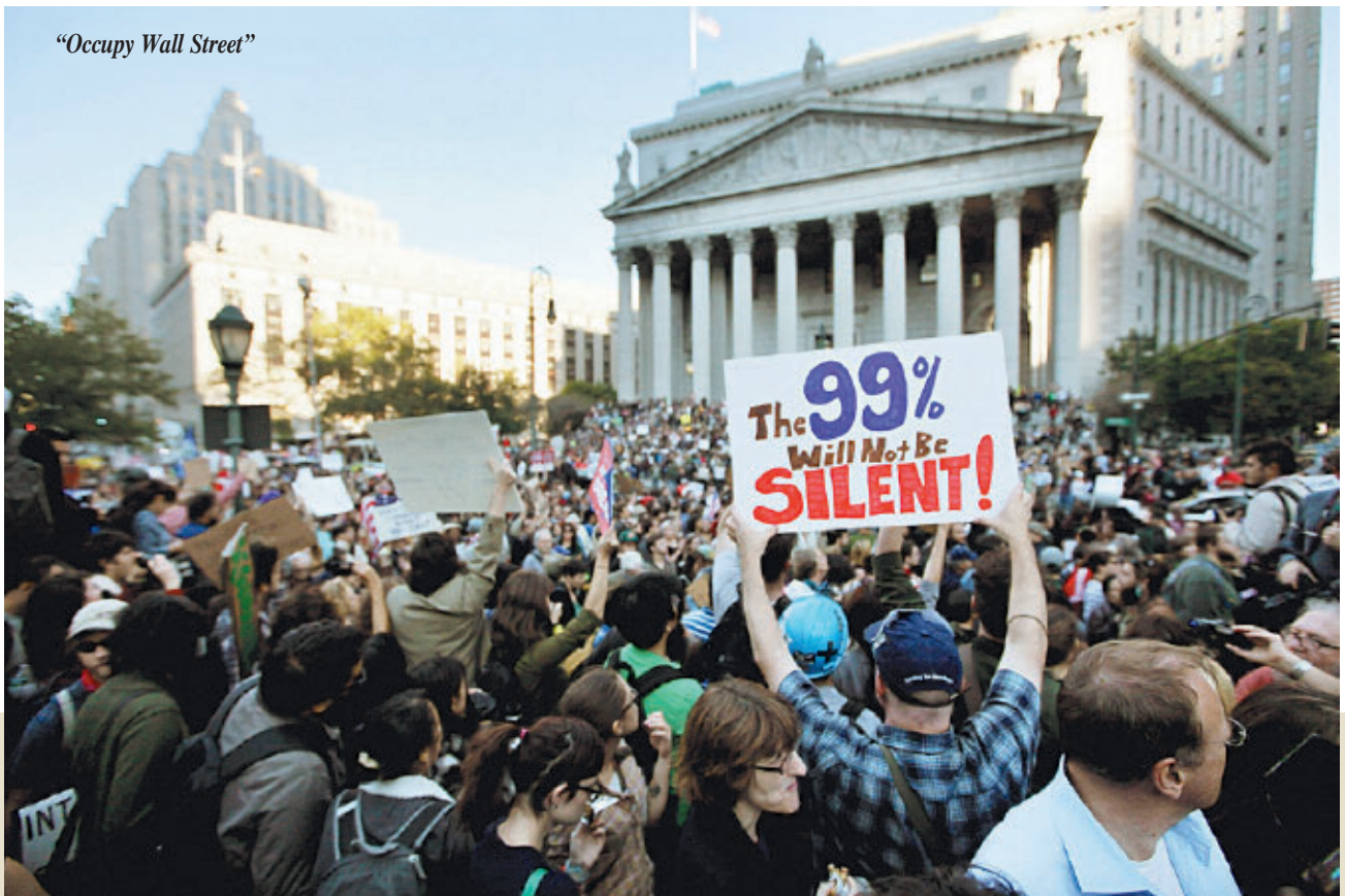
“Occupy Wall Street”

Αρχικά, η κατάληψη δεν ξεπερνούσε τις μερικές εκατοντάδες ακτιβιστές και ακτιβίστριες. Δυο βδομάδες περίπου μετά, η αστυνομία συνέλαβε περίπου 700 διαδηλωτές ενώ διέσχισαν την γέφυρα του Μπρούκλιν – που συνδέει το Μανχάταν με το Μπρούκλιν. Τα νέα έκαναν τον γύρο του κόσμου. Αυτή η επίδειξη δύναμης από πλευράς της αστυνομίας και του Μπλούμπεργκ, του πολυεκατομμυριούχου δημάρχου της Ν. Υόρκης, όχι μόνο δεν πτόησε τον κόσμο που συμμε-