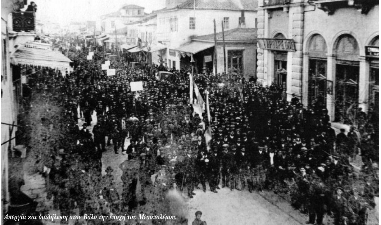
Απεργία και διαδήλωση στον Βόλο την εποχή του Μεσοπολέμου.

λερ και την αιματηρή πάταξη της αριστεράς από την κυβέρνηση του. Ένα άλλο πλεονέκτημά του είναι ότι θα λύσει, όταν θα έρθει η ώρα του, και το εργατικό πρόβλημα. Ο Χίτλερ, στον επινίκαιο λόγο που εκφωνεί μετά τις εκλογές, στη μεγαλύτερη διαδήλωση που οργανώθηκε ποτέ στο Βερολίνο, «εξήγε τας φιλεργατικές διαθέσεις του, τονίσας ότι θ' αποδώση το δίκαιον εις τους εργάτας όταν καταπνιγή οριστικώς ο κομμουνισμός». 13